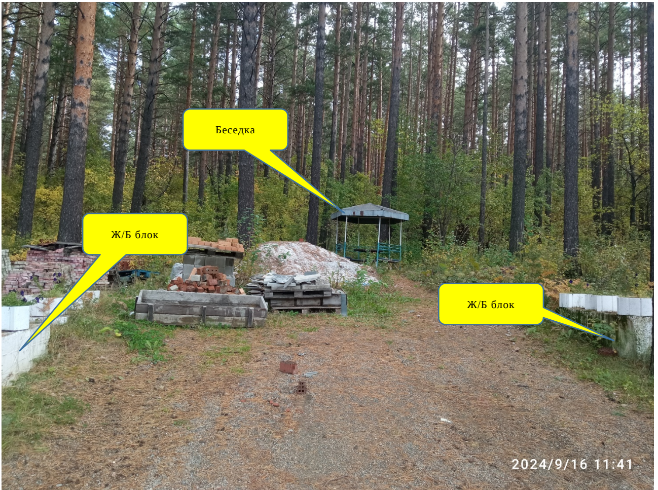
Беседка, стол со скамейками напротив дома № 122/4-б