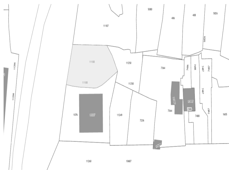
СХЕМА РАСПОЛОЖЕНИЯ ЗЕМЕЛЬНОГО УЧАСТКА, В ОТНОШЕНИИ КОТОРОГО ПОДГОТОВЛЕН ПРОЕКТ РЕШЕНИЯ О ПРЕДОСТАВЛЕНИИ РАЗРЕШЕНИЯ НА УСЛОВНО РАЗРЕШЕННЫЙ ВИД ИСПОЛЬЗОВАНИЯ «ПРЕДПРИНИМАТЕЛЬСТВО» В ОТНОШЕНИИ ЗЕМЕЛЬНОГО УЧАСТКА С КАДАСТРОВЫМ НОМЕРОМ 38:36:000012:11188, ПЛОЩАДЬЮ 1165 КВ. М, РАСПОЛОЖЕННОГО ПО АДРЕСУ: РОССИЙСКАЯ ФЕДЕРАЦИЯ, ИРКУТСКАЯ ОБЛАСТЬ, Г. ИРКУТСК, УЛ. СУРНОВА.

РОССИЙСКАЯ ФЕДЕРАЦИЯ Г. ИРКУТСК АДМИНИСТРАЦИЯ КОМИТЕТ ПО ГРАДОСТРОИТЕЛЬНОЙ ПОЛИТИКЕ ЗАМЕСТИТЕЛЬ МЭРА- ПРЕДСЕДАТЕЛЬ КОМИТЕТА Р А С П О Р Я Ж Е Н И Е