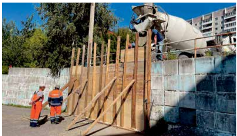
На фото — процесс ремонта подпорной стены в микрорайоне Университетском у дома № 107. Все работы проведены по просьбам местных жителей, которые обратились к Евгению Стекачеву или его помощнику

Теперь 35 депутатов в тесном взаимодействии с жителями города и администрацией будут работать на развитие территорий своих избирательных округов и Иркутска в целом.