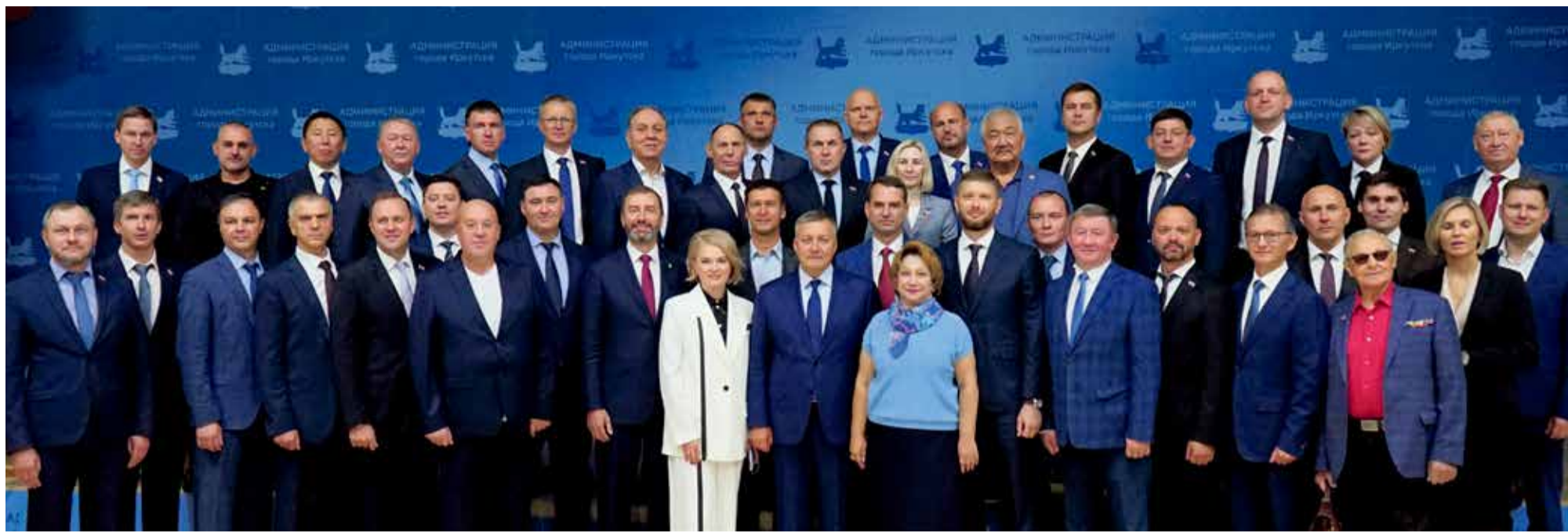
Команда города и региона, которая сплоченным коллективом будет работать над развитием Иркутской области, благоустройством малой Родины, решением острых и долгосрочных вопросов