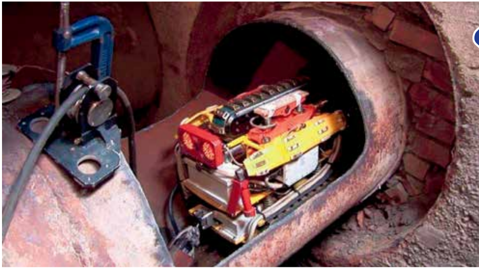
«Открываешь колодец, вырезаешь в трубе люк, запускаешь робота» — примерно так выглядит работа диагностического оборудования, если не вникать во все ее тонкости. На деле же это серьезный, тонкий технологичный процесс, от точности которого зависит безаварийная работа сетей

«Начало отопительного сезона традиционно вызывает много вопросов. Подчеркну: существуют строгие технологические регламенты, законодательство, в соответствии с которыми строится работа. Главная задача — сделать все от нас зависящее сейчас, чтобы зима прошла максимально спокойно, без происшествий. На это сегодня направлены все силы и средства.»