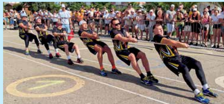
В перетягивании каната сборной богатейшей из АНХК не было равных. Ангарские нефтехимики не уступили соперникам ни одной схватки с 2017 года

— На спортивных играх «Роснефти» в моей дисциплине выступило очень много интересных, сильных команд, борьба была напряженная! Все соперники выкладывались по полной. В целом очень понравилась организация — условия проживания, питание, церемония открытия. Только положительные впечатления. Есть с чем сравнить: я занимаюсь теннисом с 11 лет, участвовал в чемпионате России среди молодежи. Теннис — это 80 % моей жизни, играл в школе, университете и сейчас. По профессии я оператор технологических установок нефтеперерабатывающего производства и рад, что меня ценят как спортсмена и что спорт развивается в нашей компании.