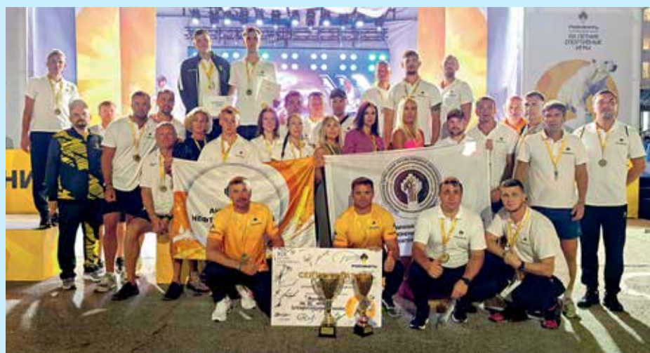
Знакомьтесь — спортивные нефтехимики из команды «Ангара»! На XIX Летних спортивных играх «Роснефти» команда Ангарской нефтехимической компании стала бронзовым призером