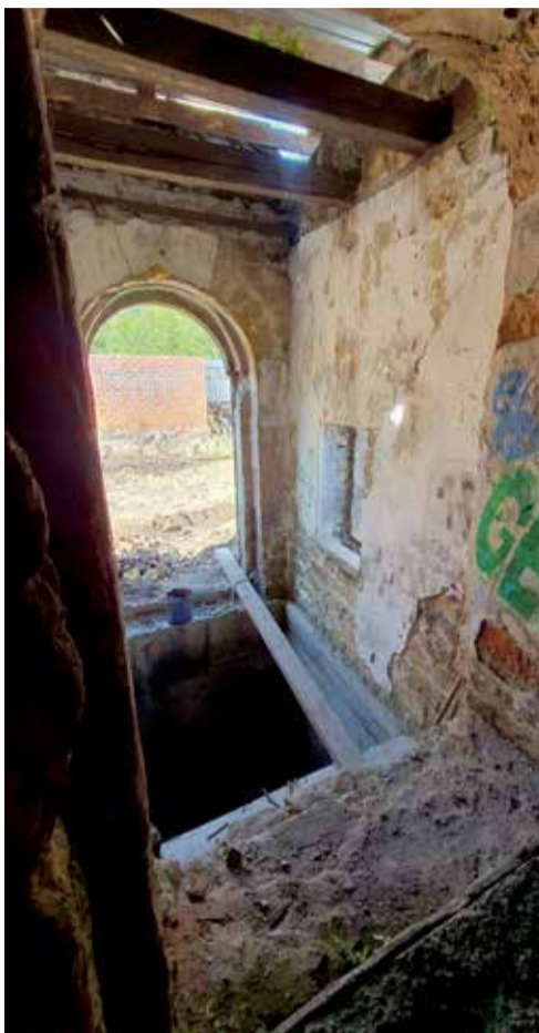
Входная группа водонапорной башни: по центру проем двери с полукруглым навершием, прямоугольное окно для попадания естественного света, сверху — балки кровли, которую еще тоже предстоит восстанавливать, а пока она прикрыта металлическим листом. Также до морозов строители планируют укрепить стены цокольного этажа и самого помещения башни

Сколько времени может уйти на полный цикл работ — сказать трудно. Руководитель ООО «Наследие» говорит, что многое зависит от финансирования и времени на оформление всех необходимых документов. Но если представить идеальные условия, то в полном объеме ремонтно-реставрационные мероприятия могут завершиться в 2026 году. Стоимость работ оценивается в несколько десятков миллионов рублей.