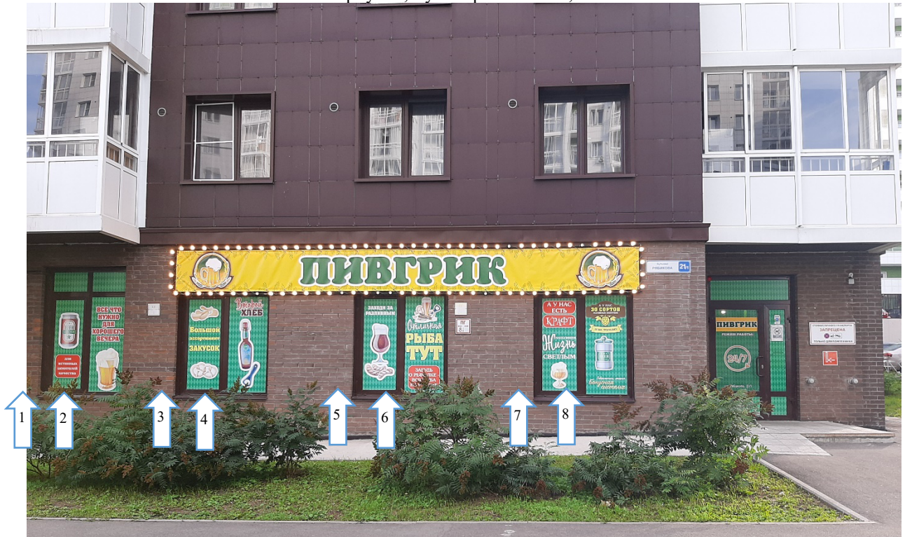
местоположение информационных конструкций