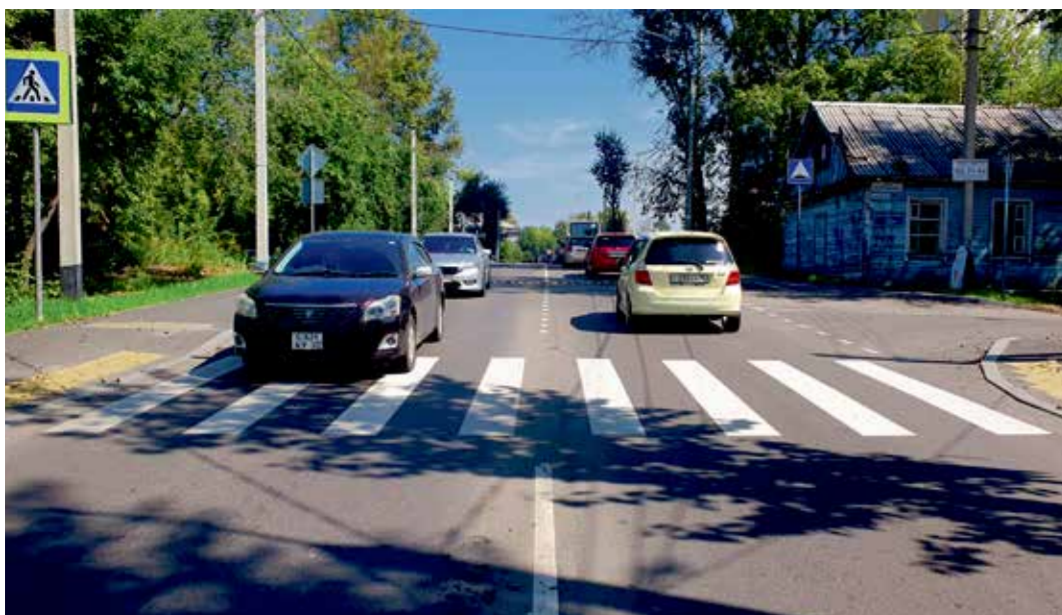
Эта зебра и разделительные линии расположились на улице Сеченова, одном из двух участков, соединяющих микрорайон Юбилейный с «городом». Интенсивность движения высокая, а значит, нужно, чтобы пешеходы точно знали, где можно перейти дорогу, а автомобилисты видели, где разрешен поворот, а где сплошная