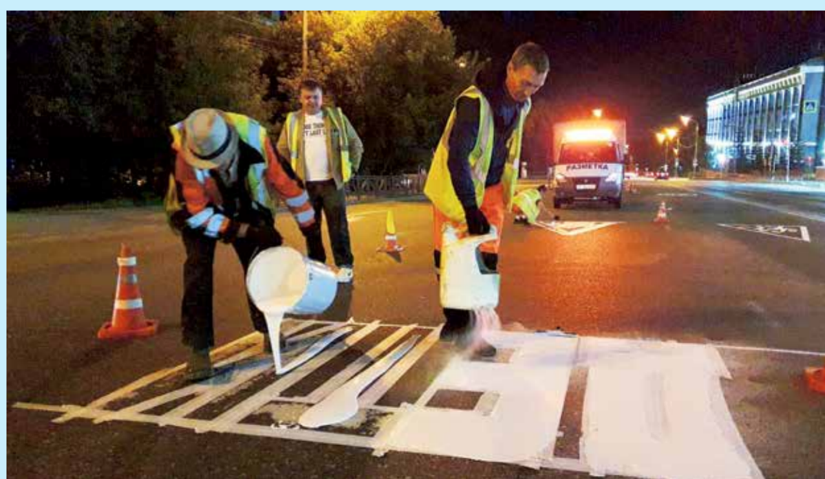
На этом снимке видим результат слаженной работы 573-й бригады ООО «ДМП» — слово «ДЕТИ» уже перенесено на асфальт, очерчено скотчем, а часть букв залита холодным пластиком — специалисты разровняли тягучий слой и посыпали его микрошариками из собственноручно изготовленного «кита». Вторая часть букв находится в процессе заливки, и далее по кругу — выравнивание и посыпка стеклянными шариками. Затем нужно подождать и успеть вовремя снять малярный скотч, иначе он окаменеет вместе с основным рисунком и убрать его будет почти невозможно. Действия дорожников выверены до секунд! Наблюдать за работой профессионалов — удовольствие

вблизи детского учреждения, на проезжей части которого возможно появление детей, и две надписи «ДЕТИ».