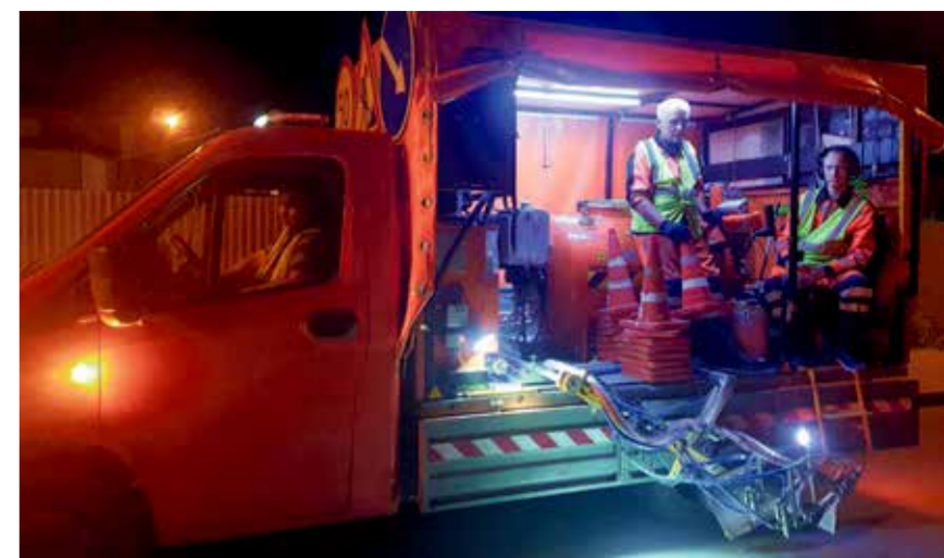
Ежедневно (ежедневно!) на улицы Иркутска выходят восемь бригад дорожников только от ООО «ДМП». Они вместе с другими подрядчиками ежегодно занимаются обновлением разметки в городе. Например, эта бригада работает с установкой «Шмель» — их задача наносить сплошные и прерывистые линии на проезжей части. С помощью этих штрихов и полос автомобилисты могут быстро и точно ориентироваться во время движения. А светоотражающие компоненты разметки особенно полезны в темноте, во время дождя, тумана или снегопада

В ы автомобилист или пешеход? В любом случае, и водителям, и «безлошадным», в городе с таким интенсивным движением, как наш Иркутск, проще передвигаться, если на пути все четко и ясно указано. Здесь — пешеходный переход, здесь — сужение дороги, а тут нужно быть вдвойне внимательным — на дороге могут выскочить дети! Линии, нанесенные на асфальт, дублируют дорожные знаки и призывают внимательнее следить за дорогой: чем разметка ярче, тем заметнее она окружающим, а значит, движение будет более безопасным для всех его участников. А еще (обращали внимание?) — дорога с новенькой зеброй и освеженными разделительными полосами может положительно влиять на настроение! О том, где в Иркутске на днях появилась свежая разметка, кто и когда ее наносит, а также о том, как это делается, — сегодня в свежем номере.