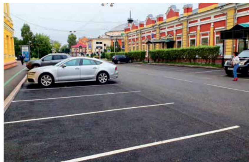
Улица Пролетарская, район ТЦ «Сезон». Пожалуй, эта часть улицы имеет больший трафик движения, чем та, что тянется между Желябова и Польских Повстанцев. Тем не менее разметку сделали на обоих участках максимально качественно — она уже пережила несколько ливней, по ней проехали тысячи колес не только личного и общественного транспорта, но и много строительной техники, которая занята на работах на соседней улице Свердлова. Четкие ровные белые линии на черном асфальте выглядят строго, призывая к порядку и аккуратности