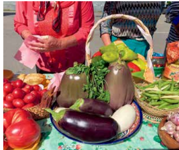
Посмотрите, какие богатыри! Баклажаны от СНТ «Бумажник» поразили членов жюри. Грамотно подобранные для нашей климатической зоны сорта и агротехника позволили огородникам собрать отличный урожай

В прошлую субботу, 24 августа, на площади возле стадиона «Труд» с утра наблюдалась повышенная активность. Подъезжали машины, из которых выходили люди и начинали устанавливать разноцветные шатры, расставлять столы, стулья, доставать из сумок и коробок овощи, фрукты, цветы, корзинки, вазы. Затем заиграла музыка, появились нарядные артисты. Казалось, в город прибыл шумный цыганский табор. Все встало на свои места, когда в центре площади установили фотозону с надписью «Фестиваль общественных организаций садоводов города Иркутска».