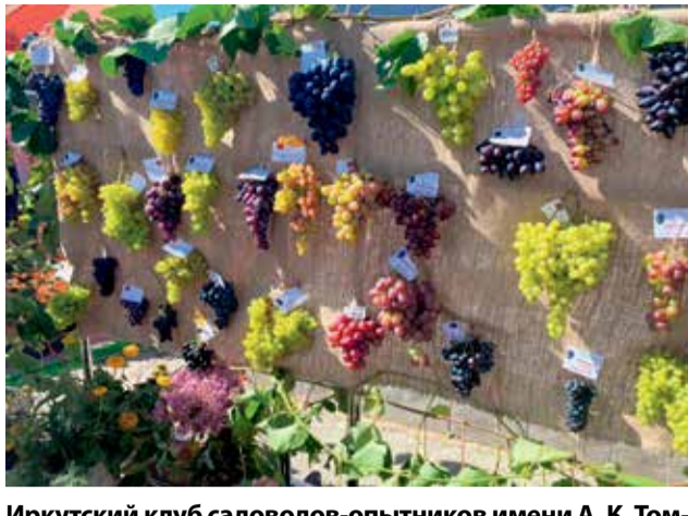
Иркутский клуб садоводов-опытников имени А. К. Томсона представил на выставке 50 сортов винограда. Все гроздья выращены на открытых участках и в теплицах в СНТ Иркутска и Иркутского района. На фестивале можно было приобрести лозу и самому попробовать вырастить виноград. Опытные заводчики этой ягоды из клуба Томсона всегда готовы дать консультацию