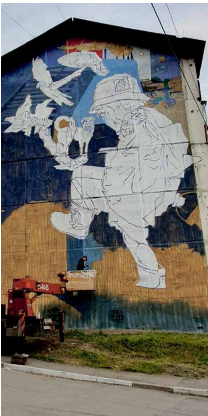
Спустя всего несколько дней после старта, в понедельник, 26 августа, работа на доме 31а в микрорайоне Первомайском выглядит так: большая часть фасада окрашена, центральная часть картины и наполнение ее деталями еще впереди

Кроме того, 11 работ появятся в городе Усолье-Сибирском и по одной — в Шелехове и Слюдянке.