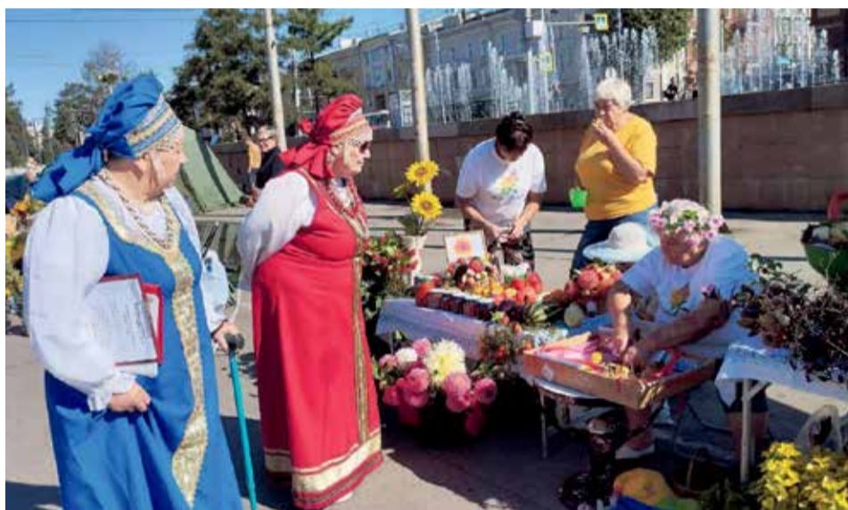
Многие участники ярмарки украсили свой гардероб элементами русского национального костюма — кокошниками. Популярностью пользовались также косоворотки и сарафаны. Но несомненный колорит придавали выставке участники творческого клуба «Любимовка». Артисты хора «Ангара» и ансамбля «За колицей» пели под аккомпанемент гармоны народные песни, а в паузах между выступлениями интересовались продукцией, выставленной на прилавках

Иркутские садоводы и огородники поделились своими достижениями на фестивале