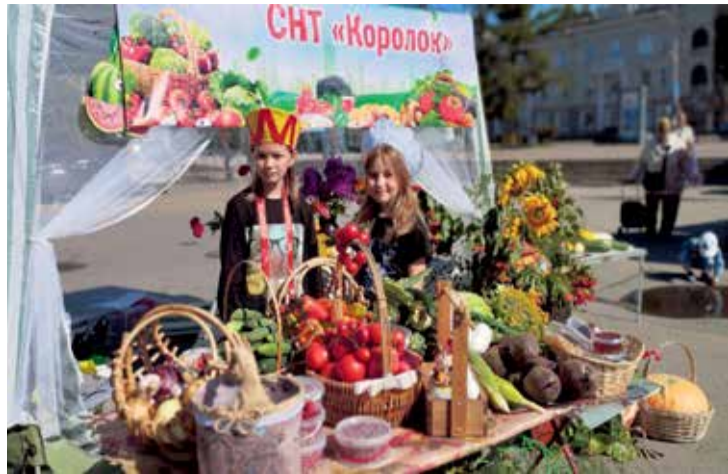
На фестиваль многие садоводы привезли с собой детей. Они помогли взрослым оформлять торговые места, участвовали в конкурсах. Для юных садоводов этот праздник стал новым позитивным социальным опытом. На вопрос «Будете участвовать в следующем фестивале?» они, не задумываясь, ответили: «Обязательно!»