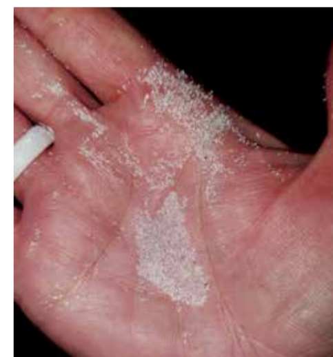
А это стекломикросферы, благодаря которым улучшается видимость элементов дорожной разметки. Мельчайшие крупинки, диаметр (фракция) которых согласно заводской маркировке от 120 до 600 микрометров (мкм)! Каждая покрыта специальным составом, чтобы еще лучше отражать попадающие на них лучи света фар и фонарей

Некрасова, чтобы посмотреть, как там наносит дорожные осевые линии.