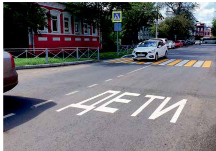
Дорожная разметка на улице Володарского сообщает водителям об ограничении скорости, о том, что рядом дети (неподалеку школа, детский сад и библиотека). Для удобства здесь четко обозначены места для парковки автомобилей и очень яркий бело-желтый акцент сделан на зебре