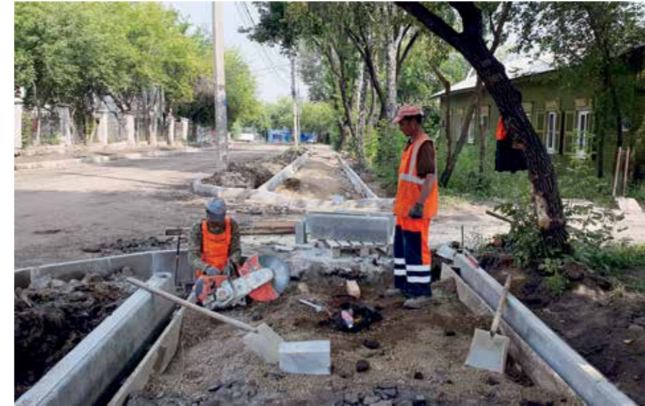
За весь период ремонта в переулке Спортивном дорожные строители демонтировали более 800 метров бордюрного камня и, разумеется, примерно столько же установили. Речь идет и о большом дорожном бордюре и камне меньшего размера, который используют для оформления тротуаров