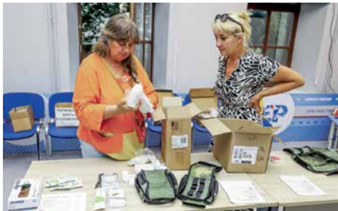
На сбор тактических аптечек в иркутское отделение благотворительной организации «Золотые руки ангела» приходят разные люди. Часто выручают ребята из движения «Молодая гвардия», студенты из патристического клуба БГУ, прихожане храмов и просто неравнодушные иркутяне. Волонтеры с опытом уже знают, что и как нужно делать, на их обучение не приходится тратить время. Но и новичкам здесь, конечно, рады. Пара занятий — и они делают все быстро и аккуратно

— Мы постоянно на связи с нашими ребятами и всегда с максимальным вниманием относимся к их предложениям по усовершенствованию любой нашей продукции, — рассказывает «Иркутску» руководитель медицинского направления благотворительной организации «Золотые