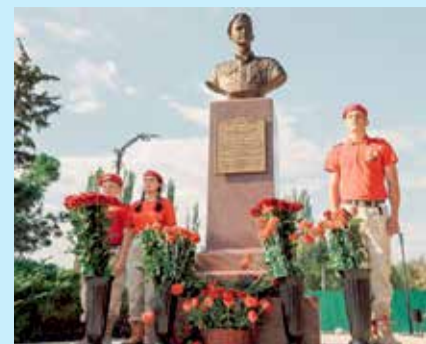
Эдуард Дьяконов (2001–2022) — иркутянин, рядовой радист-разведчик 57-й отдельной роты специального назначения 8-й гвардейской общевойсковой армии Южного военного округа, Герой России (посмертно). Теперь его именем назван сквер в Мариуполе