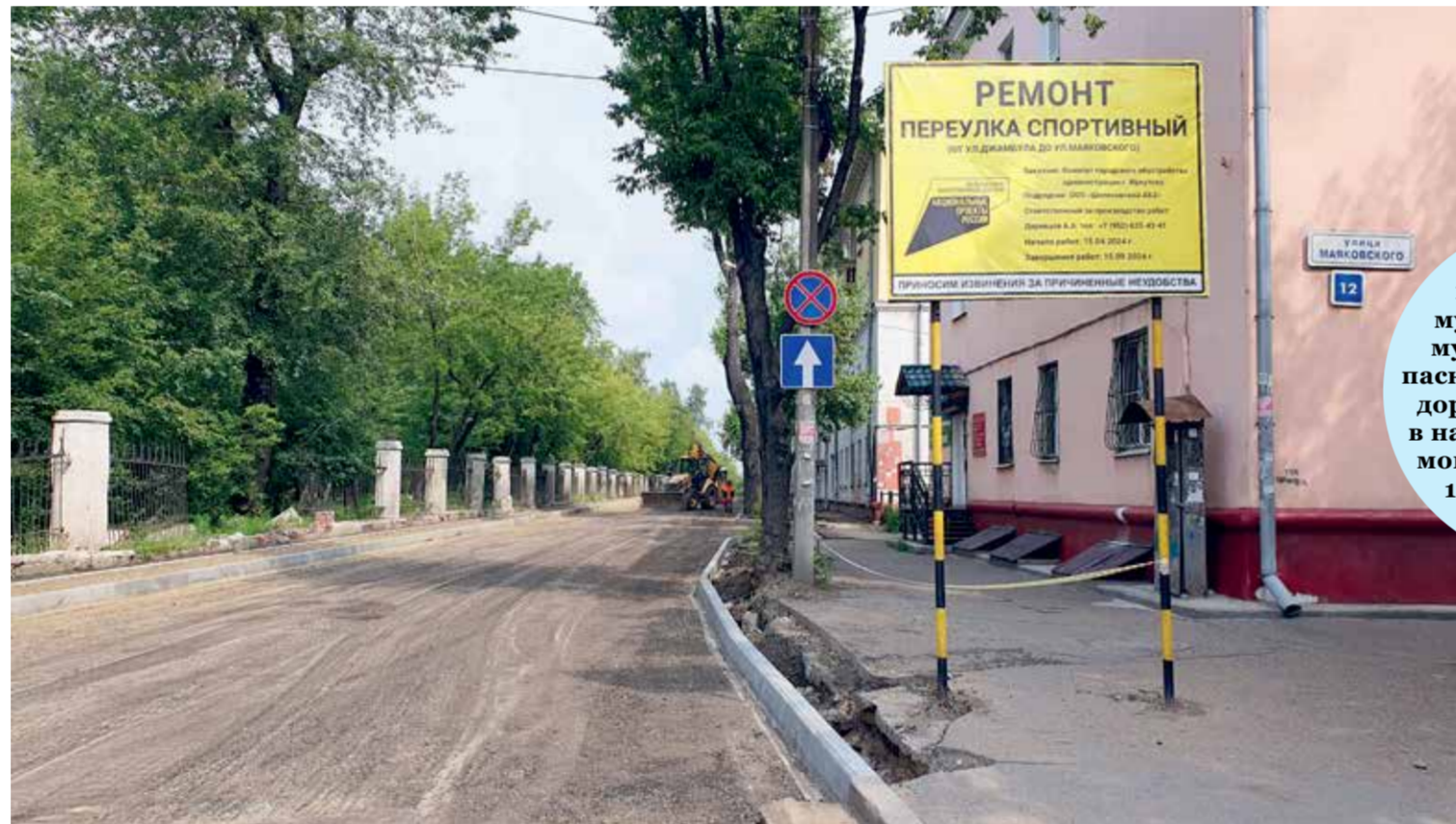
Ширина проезжей части переулка Спортивного (рядом с парком имени Парижской коммуны на левом берегу города) — семь метров. Там две полноценные полосы движения. Ширина тротуара по левой стороне — 1,2 м, по правой — 2,25 м. В паспорте объекта срок окончания работ намечен на 15 сентября, однако подрядчик намерен завершить строительство на месяц раньше

С 6 июля в переулке Спортивном на левом берегу Иркутска относительная тишина — с этого дня здесь закрыли проезд: повод — ремонт по национальному проекту «Безопасные качественные дороги». Теперь звуки издают лишь строительная техника и инструменты. Дорожникам никто не мешает — движение перекрыто, а местные жители с личным транспортом пользуются другими проездами. Впрочем, они и раньше ими пользовались, а сквозные проезды закрыли бетонными блоками, чтобы не было желающих курсировать через дворы. На временно тихой улочке побывала репортерская группа «Иркутска», чтобы посмотреть, как продвинулась стройка.