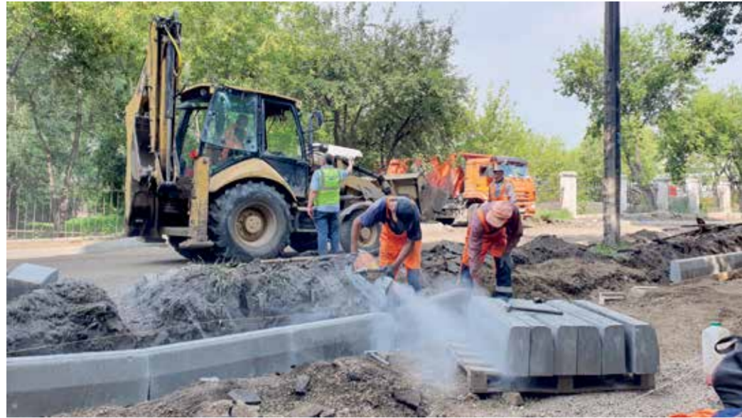
Каждый день на объекте трудятся минимум 14 рабочих. Плюс водители спецтехники — около 10 человек. В подрядной организации — ООО «Шелеховский АБЗ» говорят: такого количества достаточно, чтобы выполнить работы качественно и в срок