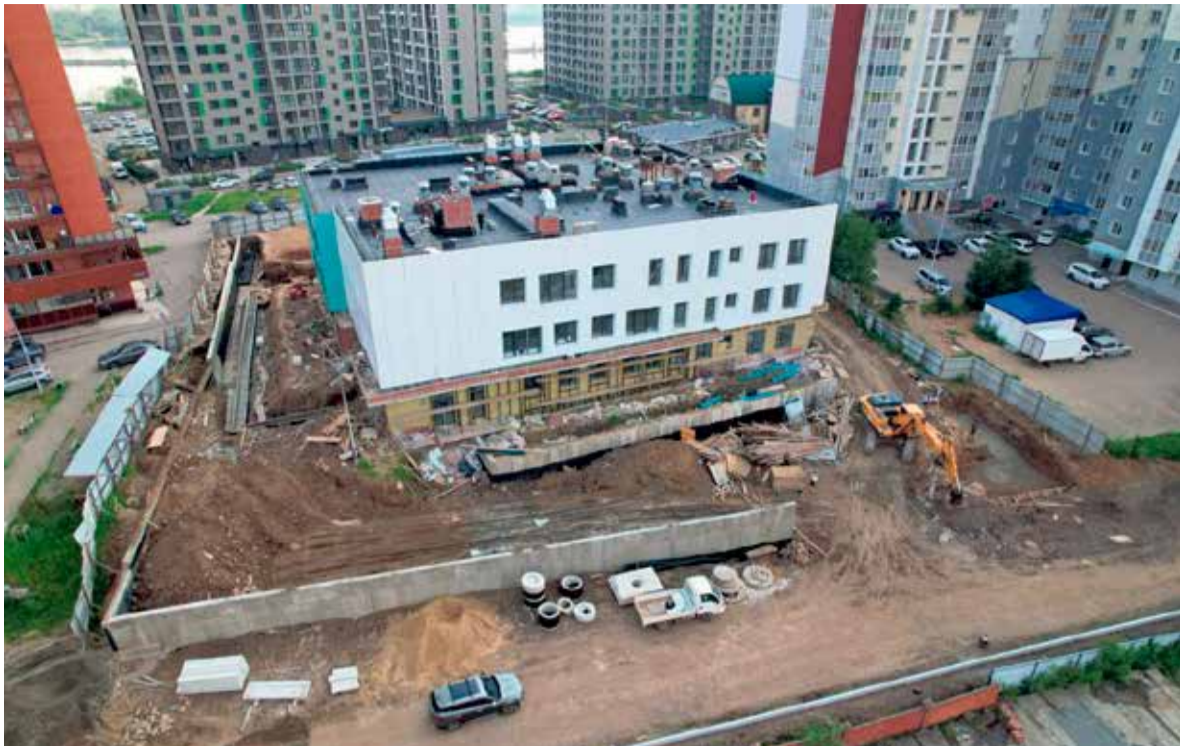
Детский сад в Нижней Лисихе возводится между высотками, это густозаселенная часть микрорайона, и социальный объект, по словам мэра Руслана Болотова, крайне необходим жителям. Общестроительные работы планируется закончить к концу лета. Кстати, уже определена кандидатура директора садика и подбирается коллектив