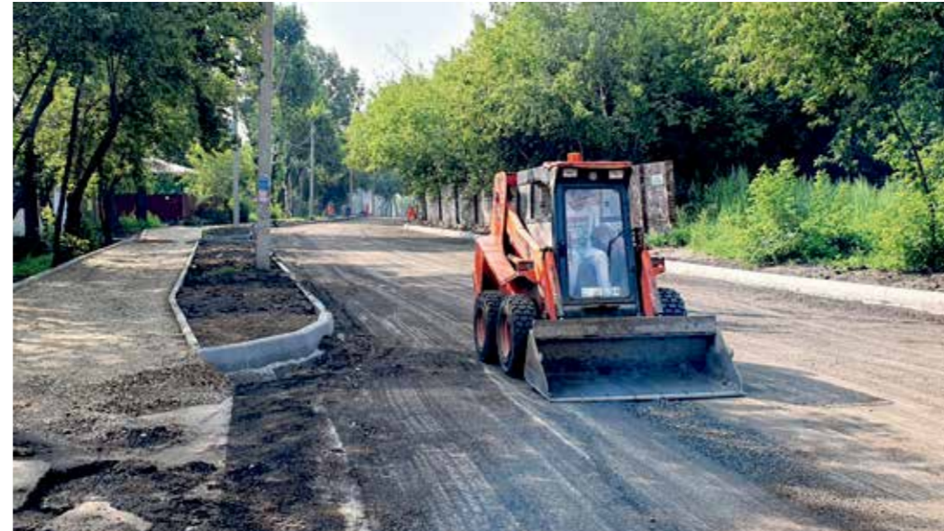
Этот снимок сделан во вторник, 30 июля. Сейчас дорога выглядит уже немного иначе — дорожники уложили нижний слой асфальта и начали выравнивать люки колодцев. А пока в кадре один из строителей зачищает дорогу для будущего асфальтирования