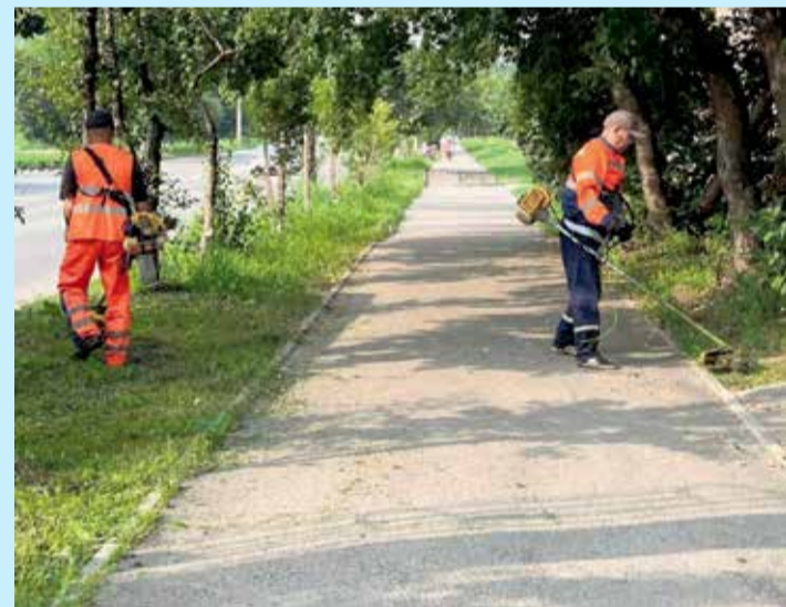
На улицы Иркутска ежедневно выходят бригады косильщиков, которые приводят в порядок газоны в городских скверах и парках, вдоль дорог и у жилых домов. «По правилам благоустройства нашего города высота растительности не должна превышать 15 сантиметров. Обязательное условие — траву следует сразу убирать», — отмечают специалисты МКУ «Городская среда»

Иркутянам напоминают, что при возникновении экстренных ситуаций необходимо обращаться в Единую дежурно-диспетчерскую службу города по телефонам: 520-112, 269-783.