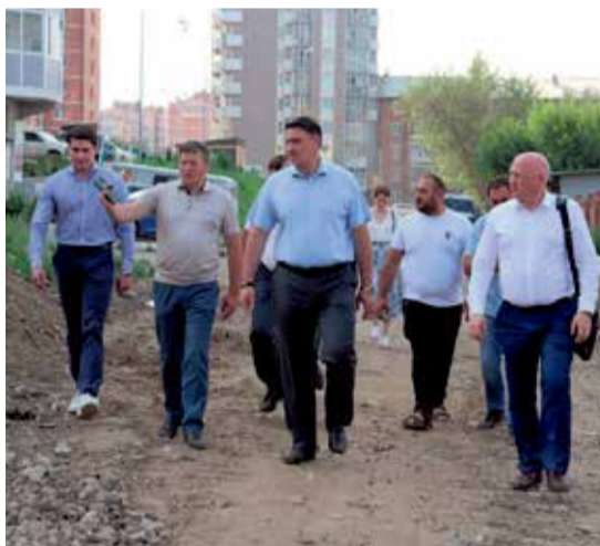
«Район Нижней Лисихи густо заселен, и этим проездом пользуются сотни горожан, проживающих здесь. Поэтому крайне важно сделать дорогу, отвечающую всем стандартам. Напомню, средства дополнительно выделили из регионального бюджета благодаря поддержке правительства и решению губернатора Игоря Кобзева», — написал мэр Иркутска в своем телеграм-канале ruslanbolotov

Возведение нового детсада началось в 2022 году по нацпроекту «Демография». Работы идут с опережением графика. В настоящее время трехэтажное строение готово почти на 70%. Уже имеется каркас здания, обустроены кирпичные стены и перегородки, смонтированы окна и наружные двери, проведены вода и канализация. Сейчас ведется внутренняя отделка, устройство подпорной стенки, инженерных сетей, вентилируемого фасада, укладка плитки на пол, создание лестничных маршей, подключение к сетям теплоснабжения.