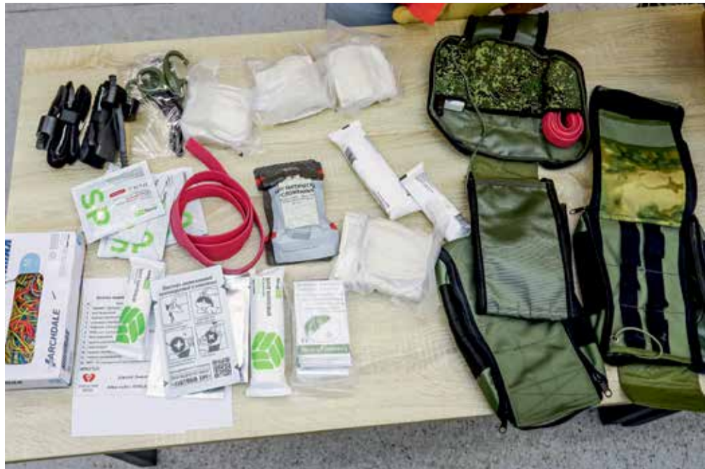
Состав аптечек для бойцов СВО, которые собирают волонтеры из «Золотых рук ангела», формируется по основному алгоритму оказания первой помощи. Прежде всего должен присутствовать турникет (жгут для остановки кровотечения), жгут резиновый Эсмарха (для тех же целей), перманентный маркер, чтобы обозначать время наложения жгута, два шприц-тюбика обезболивающего препарата, два перевязочных пакета собственного производства, два марлевых бинта, противоожоговая повязка, гемостатический бинт и тактические ножницы (быстро разрезать одежду)