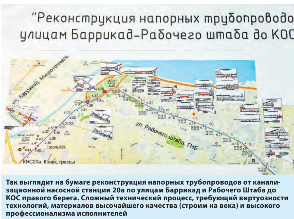
Так выглядит на бумаге реконструкция напорных трубопроводов от канализационной насосной станции 20а по улицам Баррикад и Рабочего Штаба до КОС правого берега. Сложный технический процесс, требующий виртуозности технологий, материалов высочайшего качества (строим на века) и высокого профессионализма исполнителей

— Это не просто ремонтные работы, это проекты, которые позволят в дальнейшем обеспечить жителей правобережной части Иркутска надежными, качественными инженерными сооружениями. На текущий момент все стоки сбрасываются через центр города — через коллекторы, расположенные на улицах Поленова, Фридриха Энгельса и Нижняя Набережная. Новая линия напорных трубопроводов по Рабочего Штаба позволит разгрузить от стоков центральную часть, появится запас мощ-