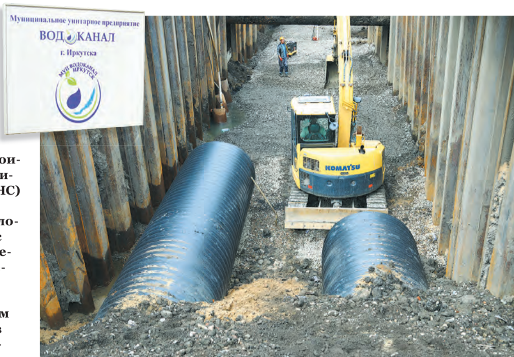
Вот такого диаметра трубы укладывают рабочие подрядной организации под контролем специалистов нашего муниципального предприятия «Водоканал» на улице Челябинской. Там обновляют коллектор сброса очищенных стоков, его длина — полтора километра. Диаметр труб, кстати, — 160 сантиметров, они изготовлены из полипропилена, который не подвержен коррозии. К работам приступили в марте 2023 года и уже подошли к отметке в 75 % готовности

Кроме этого, мы заканчиваем в 2024 году десятый, последний этап строительства сбросных трубопроводов на канализационно-очистных сооружениях правого берега Ангары. По состоянию на сегодняшний день, техническая готовность объекта составляет 75 процентов.