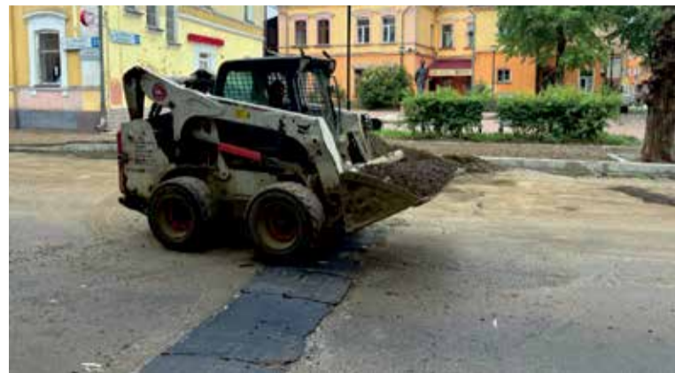
Комплексный ремонт на улице Горького в самом разгаре: почти везде демонтированы старые тротуары, рабочие готовят основание для новых, устанавливают гранитные (!) бордюры. Происходящее радует нас, сотрудников «Иркутска», не меньше, чем жителей окрестных домов или тех, кто часто бывает в центре города по делам: именно на Горького находится наша редакция. «Наберитесь терпения», — говорят нам дорожники. Да с удовольствием — не вопрос!