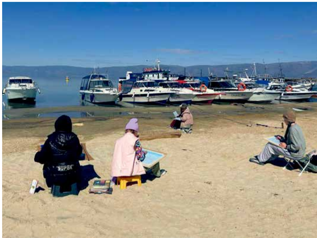
Байкальский пленэр для юных художников начинается еще с дороги: паром, водная гладь озера, стаи белоснежных чаек. А по прибытии — великолепные локации Ольхона, каждая из которых достойна своего пейзажа

Пленэр «Байкальские истории» проводят второй год. Его организаторами выступают Иркутское региональное представительство Международного союза педагогов-художников и детская художественная школа № 1 Иркутска при поддержке областной Общественной палаты и управления культуры администрации города.