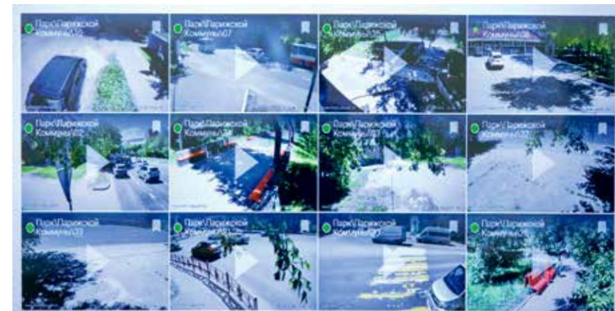
Репортерская группа «Иркутск» в едином центре видеонаблюдения муниципального учреждения «Безопасный город». Так на момент нашего посещения выглядела обстановка в парке Парижской коммуны в Свердловском округе — все спокойно. Материалы с каждой видеокamеры, установленной в Иркутске, может посмотреть любой горожанин. Обычно это делается в случае дорожно-транспортного происшествия, потери имущества или криминального инцидента, например, драки (нужно обратиться в МКУ города Иркутска «Безопасный город» с официальным запросом)