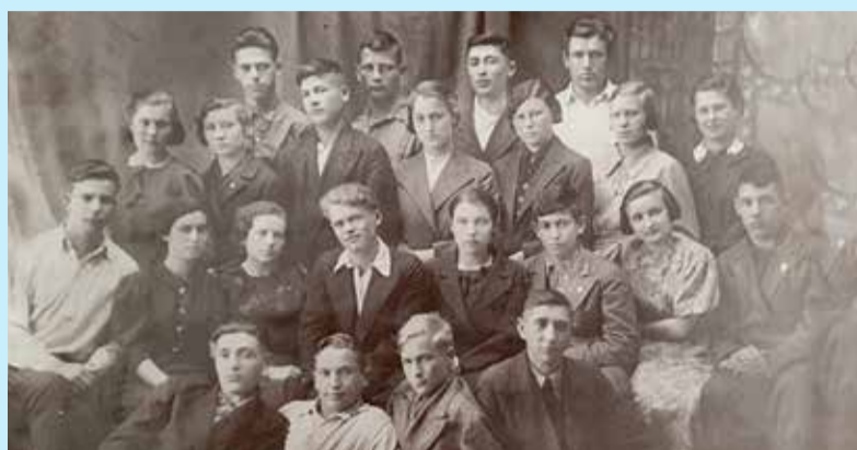
Этот снимок сделан в 1941 году — на нем выпускники одного из двух 10-х классов 9-й школы. К сожалению, большинство этих ребят не доживут до Победы — погибнут в боях Великой Отечественной, а те, кто вернется, расскажут потомкам об учебных годах в «девятке», о том, как сложилась их жизнь, лишь коротко упоминая военные годы. Сегодня эти истории бережно хранятся в школьном музее