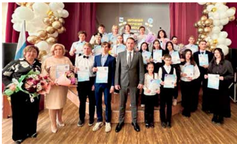
Фото на память после вручения стипендий учителям и учащимся школ № 27 и 39. «Второй год подряд я поощряю школьников и педагогов за особые успехи в учебе, творчестве и спорте по итогам учебного года. Система выдвижения и отбора стипендиатов прозрачная: учащиеся выбирают среди представленных кандидатов педагогов, а последние выбирают самых достойных среди ребят. На мой взгляд, это наиболее оптимальный и демократичный подход!» — убежден Александр Валерьевич