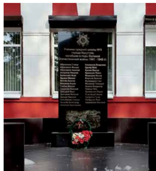
Иркутская школа № 9 имени А. С. Пушкина находится на улице Иосифа Уткина, в этом году ей исполнилось 87 лет. Во дворе школы установлен мемориал, на котором высечены имена погибших в годы Великой Отечественной войны учеников