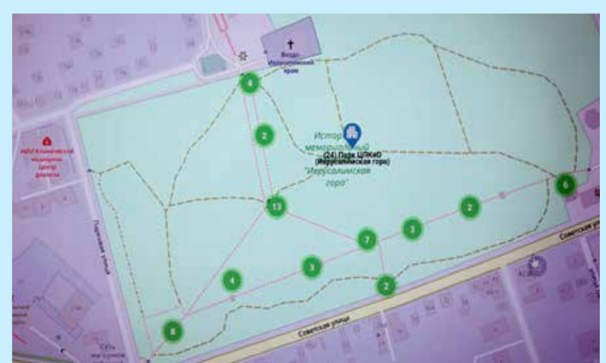
На территории историко-мемориального комплекса «Иерусалимская гора» установлены 54 видеокamеры: все они следят за тем, чтобы горожане спокойно отдыхали, гуляли вечером после трудового дня с детьми по теннисным аллеям парка