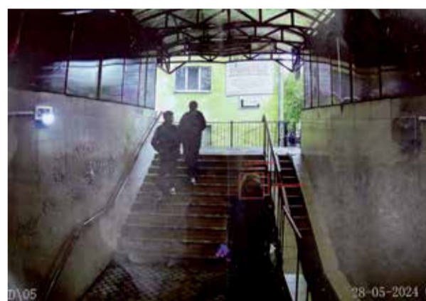
Возможности современного видеонаблюдения поражают воображение. Например, камеры с вариофокальным объективом позволяют регулировать расстояние до объекта наблюдения, тем самым давая возможность более подробно рассмотреть ту или иную деталь происходящего. При этом вариофокальный объектив, в отличие от цифрового зума, не портит качество изображения и не уменьшает детализацию при масштабировании. С расстояния в десятки метров можно увидеть черты лица и даже случайно оброненные вещи. В подземных переходах Иркутска по поручению мэра Руслана Болотова будет установлено видеонаблюдение.

Изображение с камер передается на огромные мониторы в кабинете видеонаблюдения. Наблюдая за событиями, происходящими в городе, Алексей Савенко, заместитель начальника службы автоматизированных систем управления и связи по системам видеонаблюдения, в случае необходимости незамедлительно сообщает об увиденном в соответствующие инстанции для оперативного реагирования.