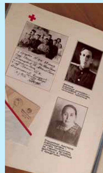
Одна из страниц музейных альбомов. На ней — история госпиталя, размещавшегося в школе № 9. Фотографии врачей, медперсонала, выздоравливающих бойцов и школьной учительницы, воспитанники которой были частыми гостями в палатах госпиталя с концертами. В отдельном уголке — солдатский треугольник, подлинное письмо тех лет

формировались запасники, начинался наш школьный музей.