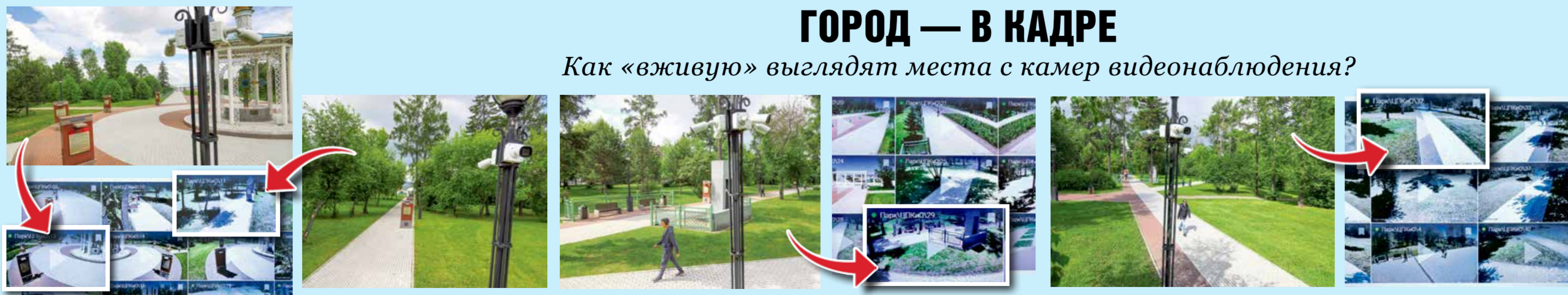
Это несколько локаций в историко-мемориальном комплексе «Иерусалимская гора» (бывший ЦПКИО). Вот так знакомые горожанам места выглядят на экранах видеонаблюдения «Безопасного города». И все это — в режиме 24/7! Ничто не останется незамеченным: ни хулиганский поступок, ни порча городского имущества

Как «живую» выглядят места с камер видеонаблюдения?