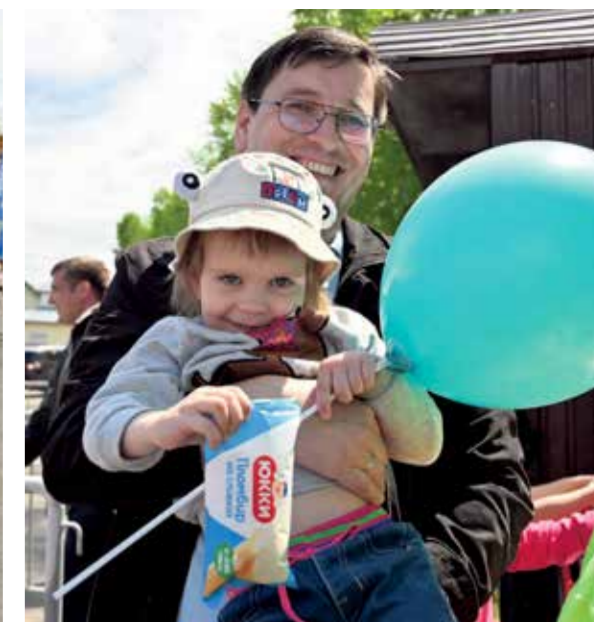
Самый вкусный летний подарок для детей — 10 000 стаканчиков с мороженым. Холодный десерт раздавали бесплатно всем, кому не исполнилось 18, и только по одному пломбированному в руки. Родителей с малышами специально подзывали к холодильникам, чтобы не проходили мимо и успели угостить ребятшек

Погода в первый день лета не подвела: не слишком жарко, солнце, пробивавшееся сквозь тучи, не слепило глаза — идеально для длительных прогулок. И если утром на центральных улицах Иркутска народу было немного, то к обеду на основных праздничных площадках: сквер Кирова и прилегающую к нему площадь Графа Сперанского, бульвар Гагарина, острова Юность и Конный — начали сходиться иркутяне всех возрастов. Самых маленьких везли родители в колясках, а самые взрослые шли, опираясь на трости и руки внуков. Главными героями на празднике в этот день стали дети. Особое внимание в честь Года семьи уделено семейным ценностям. Репортерская группа «Иркутск» побывала на нескольких развлекательных площадках, чтобы запечатлеть, как город отметил свое 363-летие.