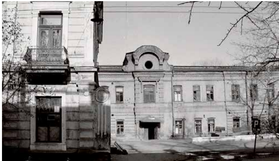
Фотография 1980-х годов. Тогда «Амурское подворье» еще было жилым — здесь с 1930-х до начала 1990-х размещались коммунальные квартиры. Добавим, когда кирпичное двухэтажное здание было построено и введено в эксплуатацию, оно входило в список пяти лучших гостиниц Иркутска того времени

квартиры для иркутян, расселили которые только в начале 1990-х.