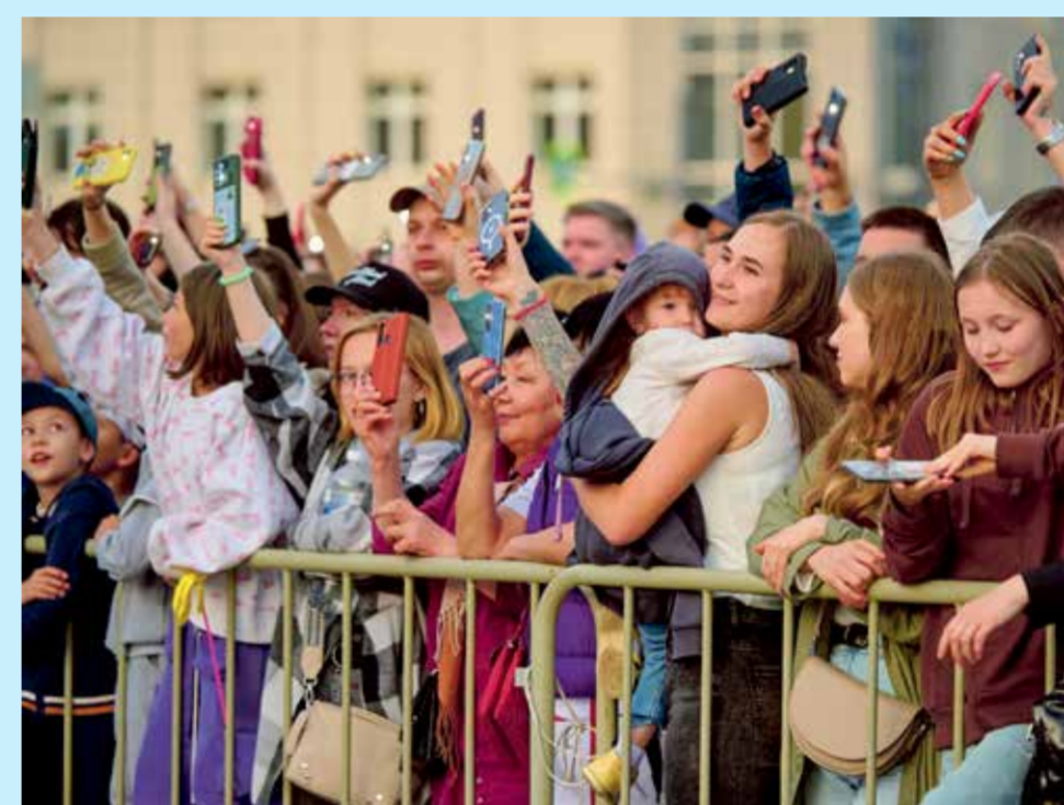
В прошлом году День города выдался дождливым, в этот раз иркутянам с погодой повезло. Возможно, поэтому на концерте на площади Графа Сперанского побывало так много зрителей — 55 тысяч человек. К началу выступления певицы Юлии Савичевой вся площадь была заполнена людьми. Артистка не только показала свой певческий талант, но и продемонстрировала умение играть на гитаре и барабанной установке. Хитом «Привет», «Если в сердце живет любовь», «Корабли» и другим известным композициям певицы иркутяне громко подпевали. В финале Юлия поблагодарила горожан за теплый прием, исполнила свою дебютную песню «Высоко» и пообещала вернуться в Иркутск с гастролями

— Мороженое очень вкусное, мне понравилось! Мы живем в Свердловском районе, приехали семьей — мама, брат и я на праздник, чтобы поучаствовать в конкурсах, отдохнуть. У нас чистый и красивый город, хочется,