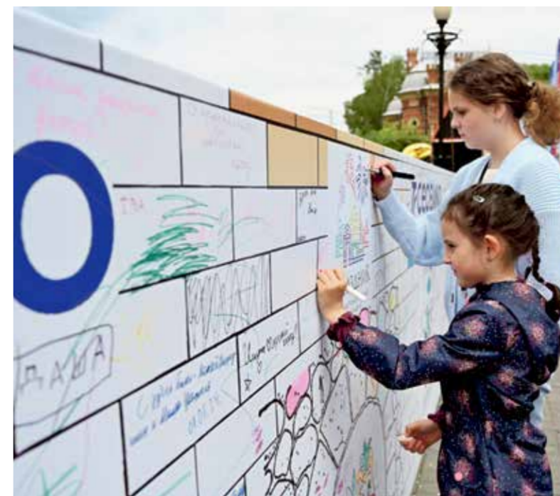
Масштабная раскраска в форме крепости у памятника Александру III быстро заполнялась надписями и рисунками. Самые маленькие оставляли на память калейки-маляки, а дети постарше писали благодарности родному городу и признавались в любви