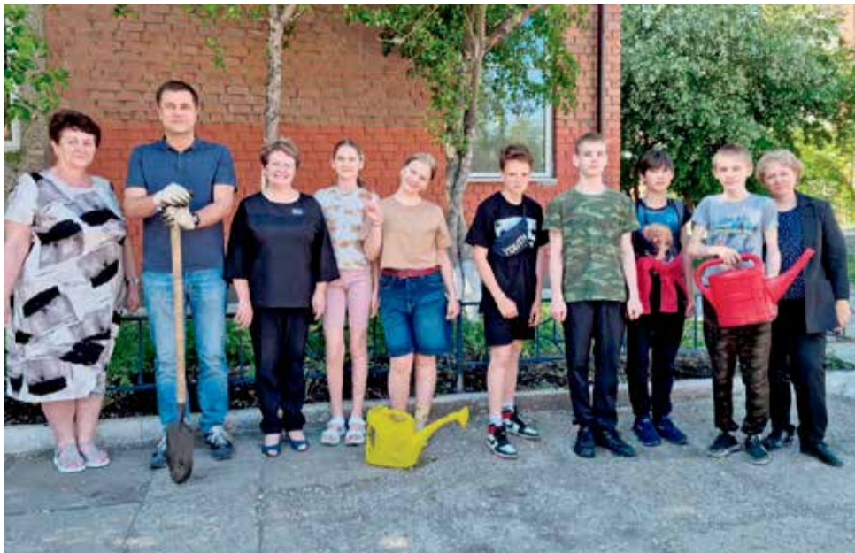
На фото — депутат от избирательного округа № 10 Максим Булдаков, директор, преподаватели, ученики гимназии № 44. Таким составом иркутяне приводили территорию образовательного учреждения в порядок и высаживали цветы