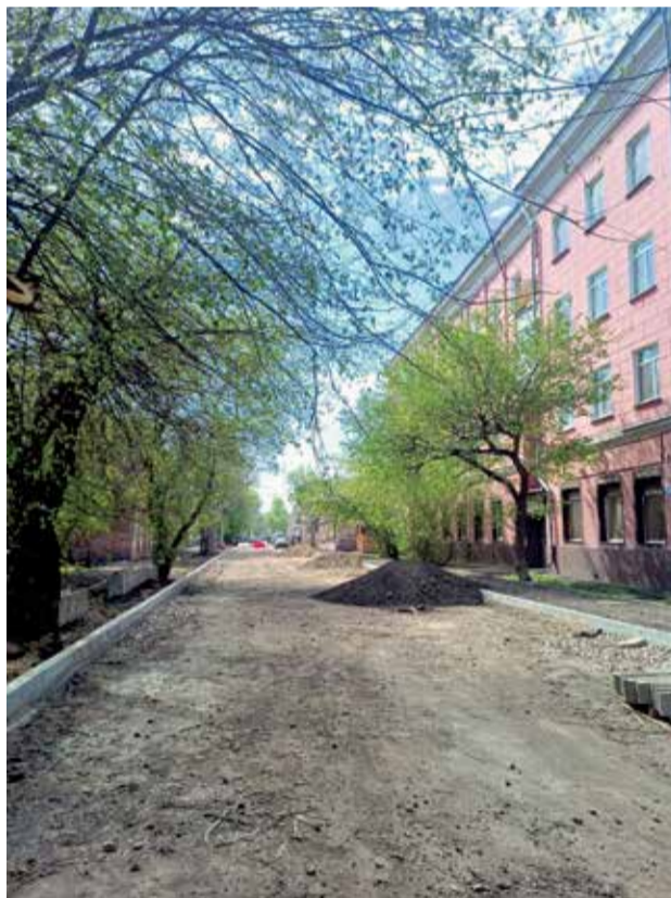
Это дорога на улице Пролетарской, которую обновляют на участке от Польских Повстанцев до Карла Маркса. Здесь проведут санитарную обрезку деревьев, демонтаж старых и установку новых элементов, переустройство колодцев. Планируется восстановление освещения, нанесение разметки, установка дорожных знаков, тактильной плитки для людей с ограниченными возможностями здоровья, выполнение мероприятий по озеленению. Здесь уже заасфальтировали тротуар

По национальному проекту «Безопасные качественные дороги» в этом году проведут ком-