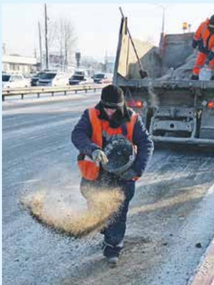
Сотрудники «Иркутскавтодора» в эти морозные дни борются с гололедом на дорогах и тротуарах. Отсев — это хорошее средство, повышающее сцепление подошвы обуви или колес автомобилей с поверхностью земли. Он не вредит экологии и весьма эффективен против скольжения

Особое внимание сотрудники «Иркутскавтодора» уделяют противогололедной обработке дорог: предприятие даже увеличило расход материалов для обработки городских магистралей. Для улучшения сцепления с дорожным покрытием применяют отсев: проезжую часть посыпают ночью и перед