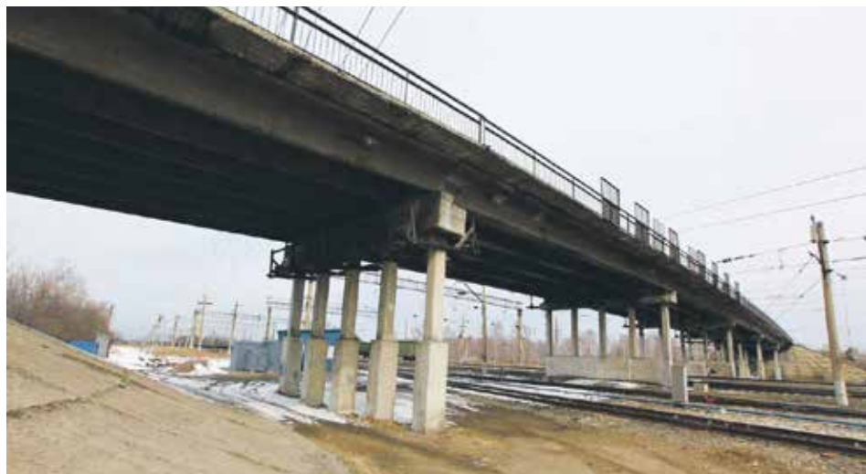
Нуждающийся в капитальном ремонте путепровод над железной дорогой в районе станции Батарейной Ленинского округа закрыли для проезда в 2022 году. Подрядная организация должна была завершить реконструкцию в июне 2023-го, но не справилась с этой задачей

Городская власть определила новую подрядную организацию для завершения капитального ремонта путепровода в Ленинском округе