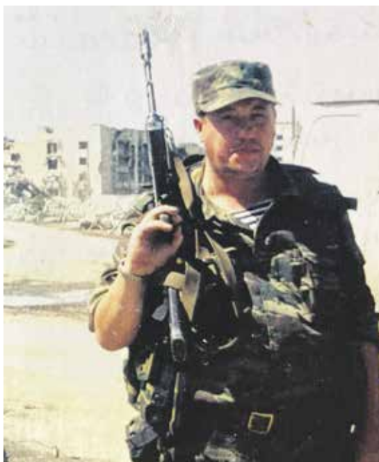
2000 год, город Грозный Чеченской Республики, площадь Минутка. Командировка в составе Объединенной группировки войск (сил)

— В 90-е, когда я начал жить в Первомайском, Падь Долгая была уютным зеленым местом между двумя районами (разделяет Первомайский и Университетский. — Прим. авт.). И кое-какое благоустройство там имелось: чугунные тяжелые скамьи, кованые ограждения. Монументальные такие, знаете... Остатки от СССР. И постепенно там украли все это и превратили в помойку. Я негодовал, просто злился очень на это, как местный житель. Постепенно это негодование привело к пониманию, что нужно брать ситуацию в свои руки. И в 2000 году я выдвинулся на выборы в Законодатель-