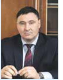
Мэр Иркутска Руслан Болотов

Развитие застроенных территорий в Иркутске реализуется с 2012 года. В результате муниципально-частного партнерства на месте не пригодных для проживания домов появляются современные новостройки. Это эффективный механизм для ликвидации ветхого фонда. Кроме того, на освобожденных участках есть возможность возводить социальные объекты, делать дорожные магистрали. Все это позволит создавать микрорайоны со всей необходимой инфраструктурой.