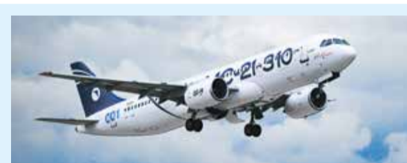
Иллюстрация из открытых источников