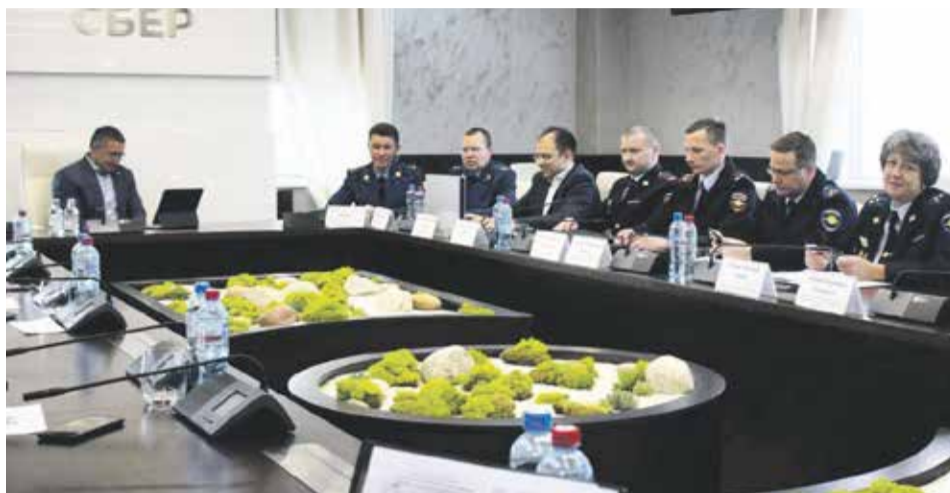
«Технологии искусственного интеллекта и цифровая грамотность для устойчивого развития региона» — круглый стол с таким названием прошел в конце ноября в главном офисе Байкальского банка Сбербанка в Иркутске. В обсуждении актуальных вопросов кибербезопасности приняли участие специалисты банковской сферы, прокуратуры, МВД и СМИ

Что нового придумали кибермошенники и как от них защититься, рассказали представители правоохранительных органов и крупнейших банков Иркутской области