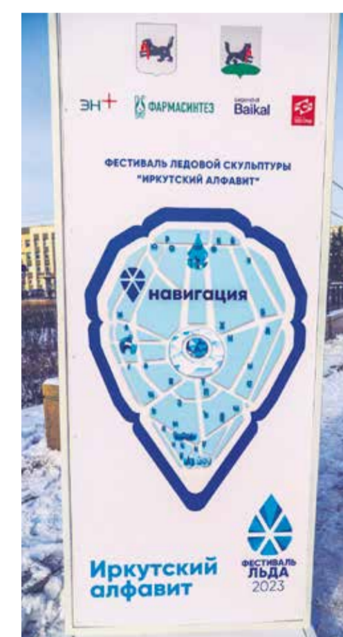
Чтобы быстро и оперативно найти «свою» букву в сквере Кирова (а многие горожане делают селфи рядом с со своими инициалами), подойдите к этой схеме: на ней ясно и четко виден весь «Иркутский алфавит» — где и какая из 33 букв размещена.