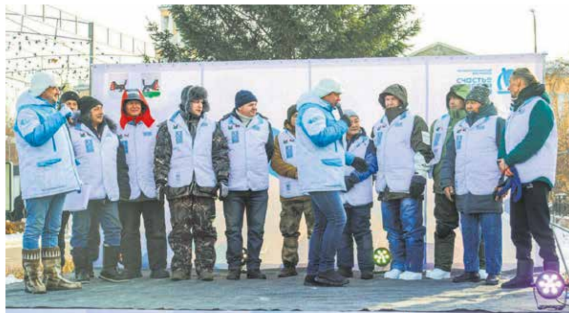
Вот они — герои минувшей недели: 11 лучших ледовых скульпторов России начиная с прошлой субботы валяли в сквере Кирова «Иркутский алфавит». Сложная задача стояла перед мастерами — каждая буква должна отразить культурные, географические и исторические особенности Иркутска. Кто справился лучше всех? Узнаем уже в ближайшую субботу, 9 декабря. Встречаемся в сквере Кирова в 15.00