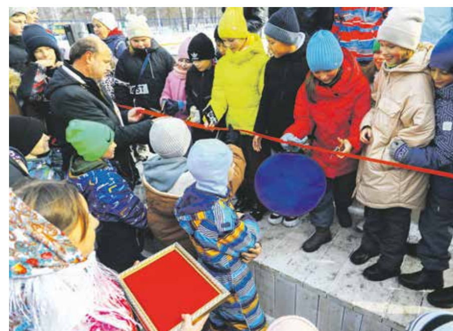
Традиционная церемония разрезания красной ленточки открытия нового сквера (ну а как без этого?) превратилась в настоящую аттракцион на скорость реакции и ловкость: в ней захотели принять участие десятки ребятишек. Как видите — победила дружба, всех желающих выстроили с ножницами вдоль ленты. По кусочку алой ткани на память досталось каждому

Синее небо над новым сквером, легкий морозец, казачья песня от театра народной драмы... Праздник в Приморском, посвященный открытию нового сквера в микрорайоне, несмотря на камерность, получился славным, улучшил настроение и укрепил понимание того, что само собой ничего не происходит! Если бы местные жители полтора года назад не проголосовали за сквер, то его бы и не было! Делаем выводы