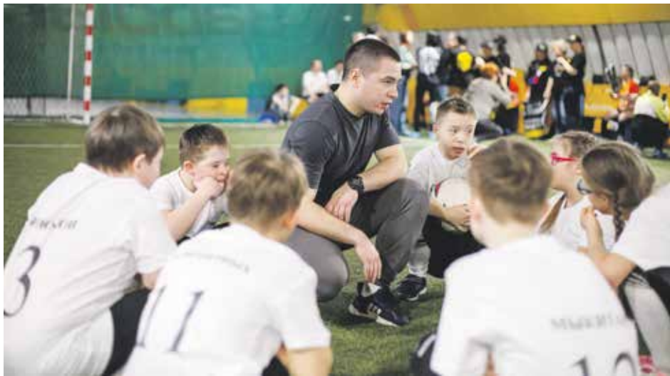
Эмоции после только что забитого гола, напряженные минуты совещания с тренером — это кадры с I Сибирского турнира по мини-футболу среди команд людей с синдромом Дауна «В свои возможности поверь!». Соревнования прошли в Иркутске в апреле этого года. Проект реализован Федерацией спорта лиц с интеллектуальными нарушениями, поддержан Фондом президентских грантов. Иркутская команда «Быстрые панды» заняла на этих соревнованиях второе место и буквально на днях отправится играть в футбол в Красноярск, на региональный турнир