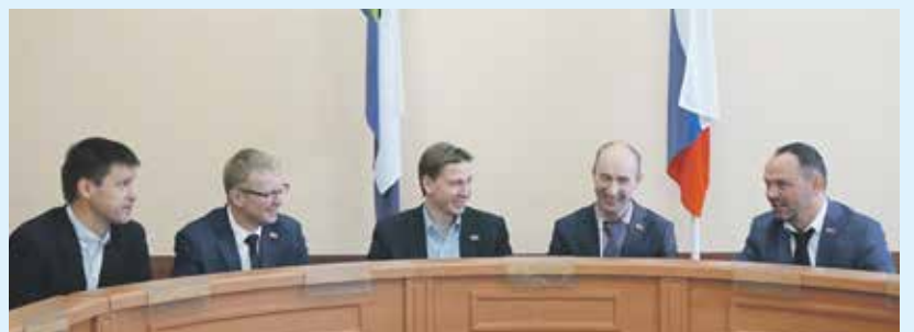
Объединение депутатов «Стратегия социально-экономического развития Иркутска» создано в городской думе в феврале 2020 года. Его целью является выражение консолидированной позиции народных избранников в отношении разработки и формирования плана развития города и других важных вопросов местного значения

выявить тренды, сильные и слабые стороны Иркутска, разработчики проводили опрос жителей старше 18 лет, интервью с представителями правительства региона, федеральными экспертами, стратегические сессии с общественностью, использовали данные официальной статистики. Все это помогло проанализировать многие проблемы оптимизации социально-экономической жизни города и продумать план дальнейшего его развития.