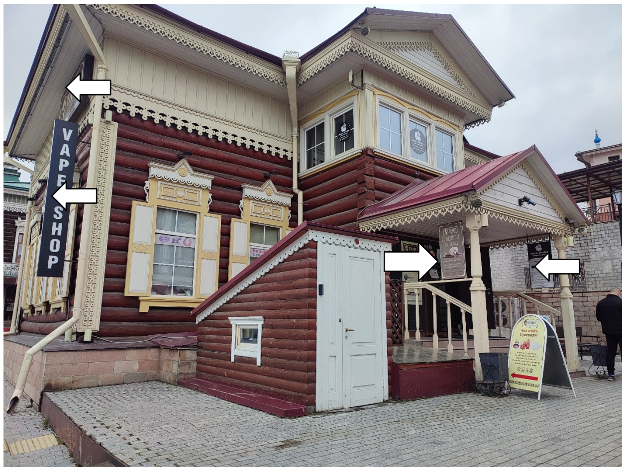
Перечень информационных конструкций, подлежащих демонтажу в добровольном порядке