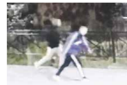
Этот скриншот сделан с видеозаписи одной из камер наблюдения, расположенной в Пади Долгой: около часа ночи 22 октября двое неизвестных сломали несколько игровых элементов в сквере у крытого катка «Иркутск». Полицейские занимаются розыском злоумышленников

Более 350 камер появятся на объектах, построенных в предыду-