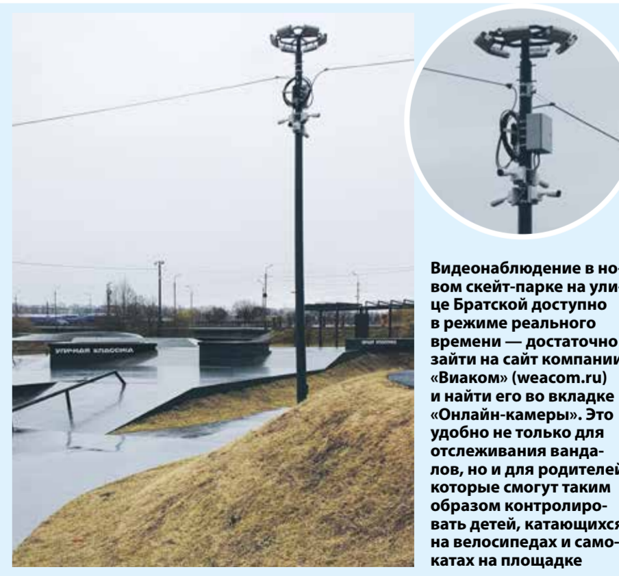
Видеонаблюдение в новом скейт-парке на улице Братской доступно в режиме реального времени — достаточно зайти на сайт компании «Виаком» (weacom.ru) и найти его во вкладке «Онлайн-камеры». Это удобно не только для отслеживания вандализма, но и для родителей, которые смогут таким образом контролировать детей, катающихся на велосипедах и самокатах на площадке

Специальсты монтируют камеры так, чтобы в обзор попадали самые важные объекты и территории — сцены, детские площадки, пути входа и выхода и так далее. В администрации Иркутска уверены — чем больше камер видеонаблюдения, тем спокойнее жизнь в нашем городе.