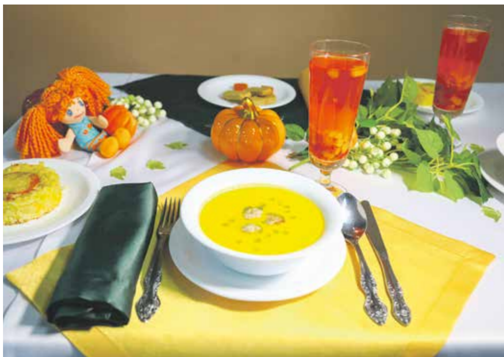
Вот такой — яркой, вкусной и эстетичной может быть тыква в разных гастрономических проявлениях. Участники кулинарного поединка постарались не просто вкусно ее приготовить, но еще и сделать это красиво! Компетентное жюри из профессионалов и любителей оценивало и вкус блюда, и всю подачу в целом