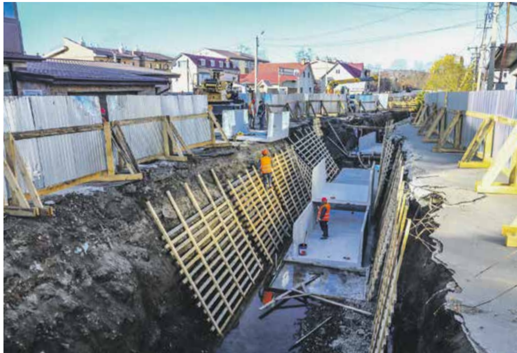
Сейчас работы идут на нескольких участках, а стартовали они на улице Ипподромной. Здесь и в районе улицы Култукской прямо сейчас, когда вы читаете этот номер «Иркутска», работают более 100 человек и десять единиц строительной техники. В конце года специалисты приступят к возведению насосной станции «Ядринцева» — она необходима для откачки используемой в тепловой сети воды обратно на Ново-Иркутскую ТЭЦ