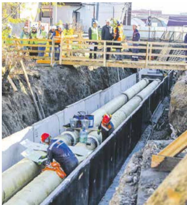
Вот так выглядит начало строительства теплового луча на улице Ипподромной. Здесь проведены земляные работы, подготовлено бетонное основание, использовано пять тонн арматуры, 30 кубических метров бетона, выполнен монтаж железобетонных лотков под будущую тепловую сеть. Параллельно специалисты провели вынос городских коммуникаций. Полностью закончить трехсотметровый участок планируют до конца октября

— Сегодня мы создаем инженерную инфраструктуру, которая обеспечит качественное развитие