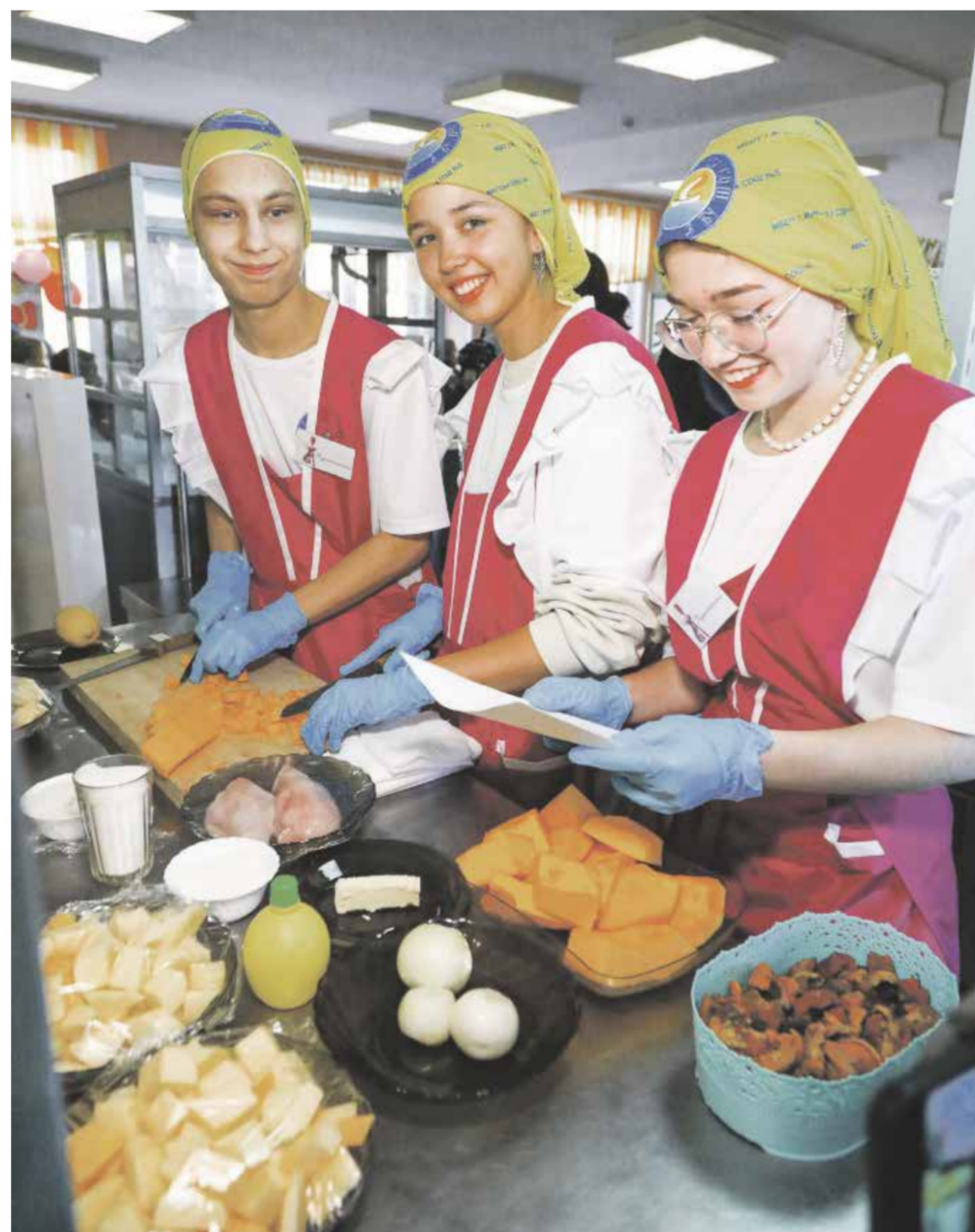
Перед вами — ребята из команды «Кулинарики», одиннадцатиклассники школы № 5. По большому счету, все действие было организовано именно для них: чтобы во время соревнования они полюбили и научились готовить неизвестные раньше блюда, открыли для себя интересный и захватывающий мир поварского искусства

Команда одиннадцатиклассников «Кулинарики» на второе тушила курицу с тыквой, а третья варила компот из нее же и су-