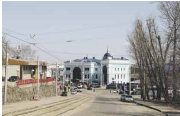
На фото справа — так выглядела улица Терешковой на спуске к вокзалу в мае этого года. На фото слева — так она выглядит сейчас. «Небо и земля!» — говорят местные жители, шагающие по новым тротуарам, огороженным заборчиками. А водители уже оценили «безбарьерный» проезд через трамвайные пути