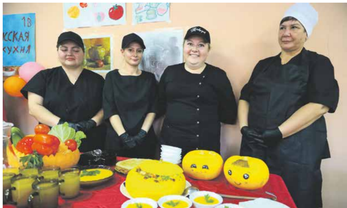
Мастерство команды поваров школы № 5 не вызывает сомнений: все, кого мы расспрашивали с пристрастием, признавались, что в столовой едят с охотой. Первое место досталось поварам заслуженно: их запеканка в тыкве и яркая сервировка выше всяких похвал. А как обыграны и маленькие потешные тыквы, и цветочные акценты (уж не говорим о вкусовых!)