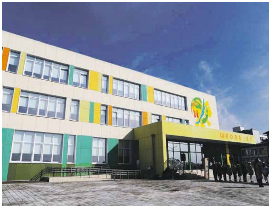
Буквально месяц назад в Ново-Ленино открыли новый блок школы № 57. Пристрой на 500 мест на улице Ярославского построили за полтора года. В трехэтажном корпусе есть актовый, хореографический и спортивный залы, медицинский и пищевой блоки, игровые комнаты, лифты, библиотека и центр детских инициатив