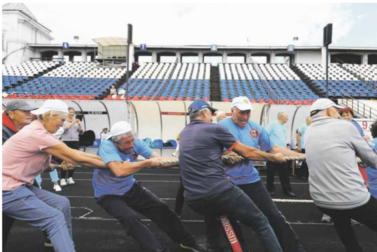
В сентябре при поддержке управления по физической культуре, спорту и молодежной политике администрации Иркутска и МКУ «Городской спортивно-методический центр» на стадионе спортивного комплекса «Труд» прошла спартакиада ветеранов. В ней приняли участие пять команд советов ветеранов войны, труда, Вооруженных сил и правоохранительных органов административных округов нашего города. Одна из самых зрелищных дисциплин на соревнованиях — перетягивание каната