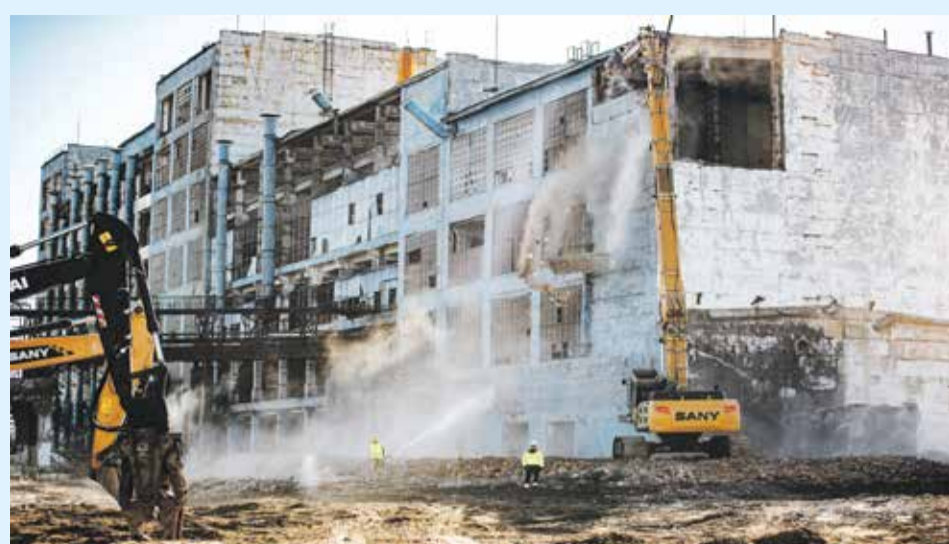
Снос опасных производственных объектов — технически один самых сложных видов работ, поэтому здание цеха № 94 аккуратно разбирали с помощью специального экскаватора-разрушителя

Ирина Покоева. Фото автора и из архива Павла Ореза В ближайших номерах нашей еженедельника мы расскажем о других муралах, появившихся этим летом в Иркутске.