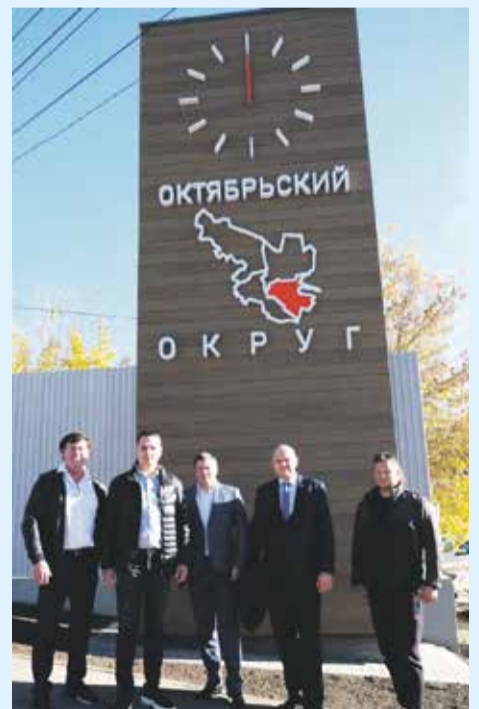
Рядом со новенькой стелой также облагородили территорию: уложили плитку вокруг, обустроили газон. Сам арт-объект подключили к электроснабжению, все силуэты и буквы имеют светодиодную подсветку, а часы идут!