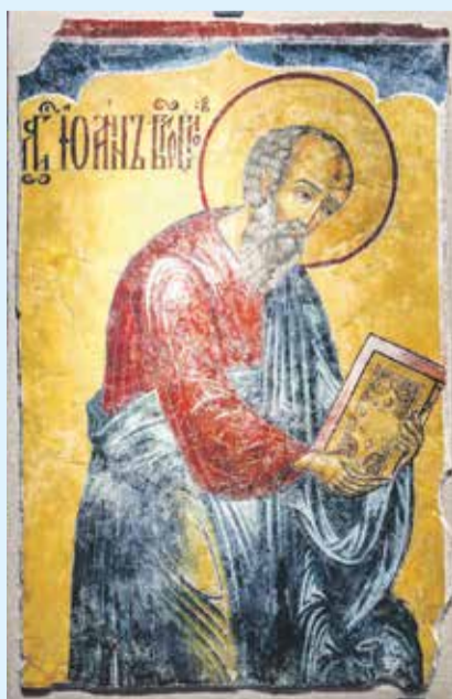
Написанные иконы с изображением Иоанна Богослова — одного из ближайших учеников Спасителя, автора четвертого Евангелия, из коллекции Музея имени Иоанна Богослова датируются первой половиной XVIII столетия