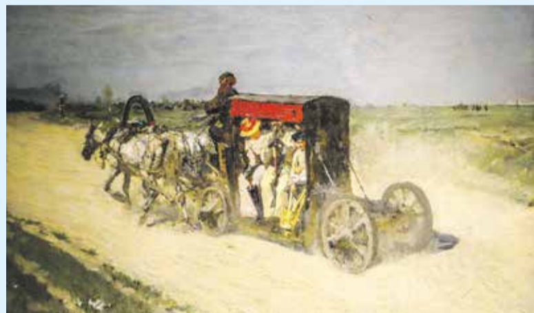
Картина Валентина Серова «Линейка из Москвы в Кузьминки» написана в 1892 году. Конные линейки в конце XIX века были городским общественным транспортом, но в летнее время их маршруты продляли до популярных дачных мест. Кузьминки пользовались у москвичей большой популярностью во многом благодаря знаменитым владельцам — князьям Голицыным, которых неоднократно удостоивали посещениями царственные особы

На этой выставке московского Музея имени Андрея Рублева представлены и новаторские для петровских времен иконы, созданные в технике масляной живописи по европейскому образцу Карпом Золотаревым. В экспозицию также вошли фрагменты стенописного иконостаса не сохранившейся до нашего времени Благовещенской церкви