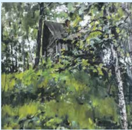
Великий портретист был не менее замечательным мастером пейзажа. Наглядный пример тому — работа «Старая баня в Домотканове» (1888). Валентин Серов часто приезжал в усадьбу в Домотканово, что недалеко от Твери, и подолгу жил там. Здесь он создал около 30 живописных работ и бесчисленное количество рисунков