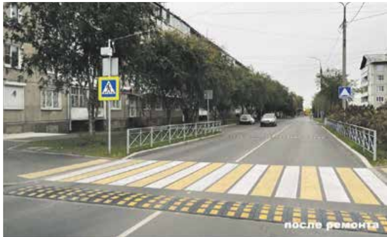
На фото — улица Ярославского (на участке от 18-го Советского переулка до улицы Баумана, 223) до и после ремонта. Благодаря нацпроекту «Безопасные качественные дороги» в этом году здесь провели комплексную работу: уложили новый асфальт, сделали ограждения, тротуары и освещение, обустроили газоны