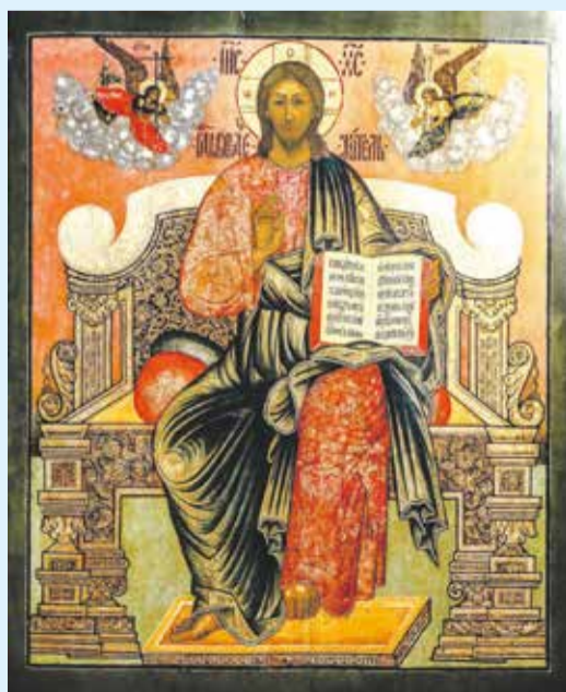
Икона «Господь Вседержитель на престоле» (начало XVIII века) относится к редчайшим дошедшим до нас произведениям эпохи домонгольской Руси. В музее имени Андрея Рублева была передана с многочисленными поздними записями. Восстановившая икону, реставраторы обнаружили настоящий шедевр

Выставка «Окно в Россию. Религиозное искусство эпохи Петра I» открыта в главном здании художественного музея на улице Ленина, 5. Выставка «Валентин Серов. Из собрания Русского музея» — в Галерее сибирского искусства на Карла Маркса, 23. Обе выставки работают до 12 ноября.