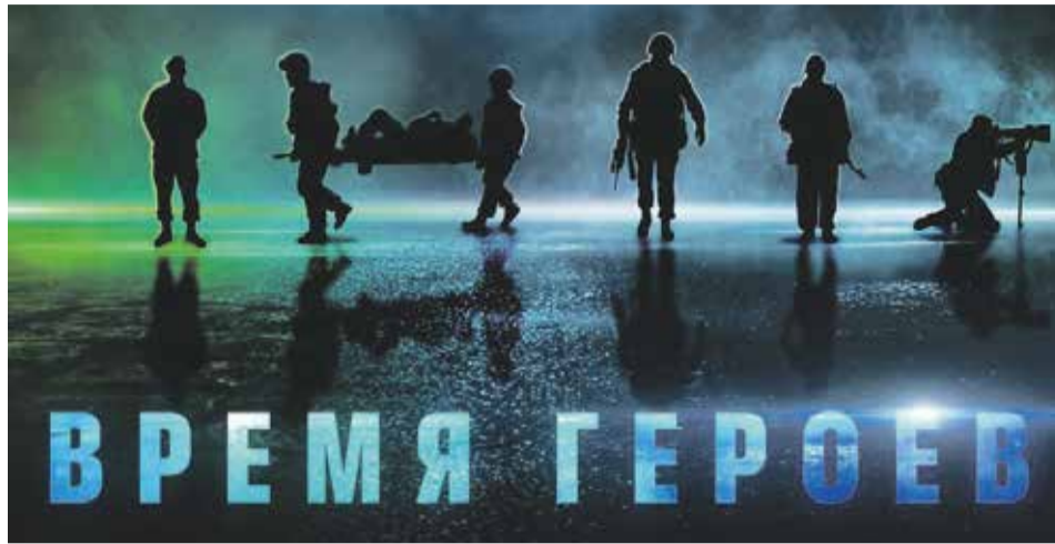
Посещение всех мероприятий фестиваля бесплатно по предварительной регистрации на сайте http://rtfestival.ru (во вкладке «Города»)

— В рамках деловой программы пройдет мастер-класс для блогеров, студентов, журналистов, которые делают контент, рассказывая о нашей стране, наших людях, наших уникальных особенностях, природных и человеческих. Мы можем подсказать, как сделать этот