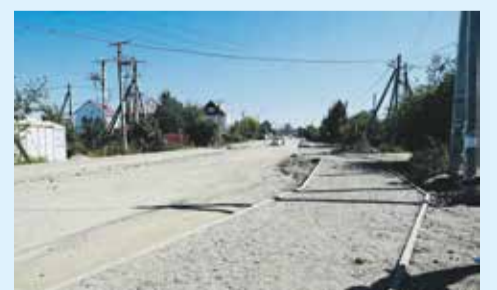
Дорога на улице Олонской во время ремонтных работ, еще до асфальтирования. Согласно проекту, подрядчик должен уложить асфальт, отремонтировать тротуары, обустроить ливневую канализацию, заменить ограждения и оборудовать автобусные остановки

В прошедшие выходные на дороге началось асфальтирование. Только за субботу и воскресенье подрядчик сделал участок, протяженностью один километр. После окончания работ с нижним слоем специалисты строительного контроля проверят качество дорожного покрытия путем вырубки образца асфальта и исследования его в лаборатории.