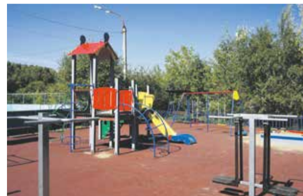
На фото — новая детская площадка в микрорайоне Университетском рядом с домом № 95, построенная за счет «депутатского фонда». На ней установлены качели, качели-скамейки под навесом, лавочки, горка, песочница, тренажеры. Игровая зона пользуется популярностью у ребятишек и находится под присмотром местных жителей

Также прошла встреча с жителями микрорайона «Союз». Их беспокоит сразу несколько проблем. Одна из них — не восстановленный подрядчиком тротуар после работ, проведенных возле проезда Юрия Тена, 30 в прошлом году. Представитель подрядной организации отметил, что проблема будет решена. Еще иркутян интересовали строительство школы, обустройство освещения на аллее рядом с домами, обрезка деревьев, ямочный ремонт и другие вопросы.