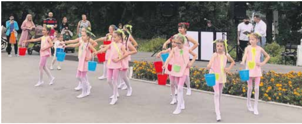
Отпраздновать день родного микрорайона собралось около 300 местных жителей. Для них выступили коллективы Первомайского с творческими номерами, и аниматоры провели для юных иркутян отдельную программу. Такой праздник проводится ежегодно и уже в следующем году ожидается юбилейная дата — 45 лет