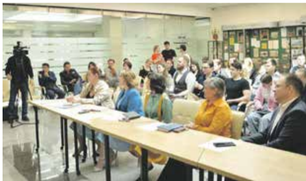
Студенты сибирско-американского факультета ИГУ, прослушавшие курс «Корпоративно-социальная ответственность», на защите проектов должны были показать, чем их бизнес будет полезен обществу и насколько он окажется безвредным для окружающего мира

Итогом образовательного курса стала защита проектов. Студентам САФ мало было найти оригинальную идею бизнеса, они должны были доказать, что их проект экономически эффективный, произведенный товар будет конкурентоспособен, а предлагаемая услуга окажется востребованной.