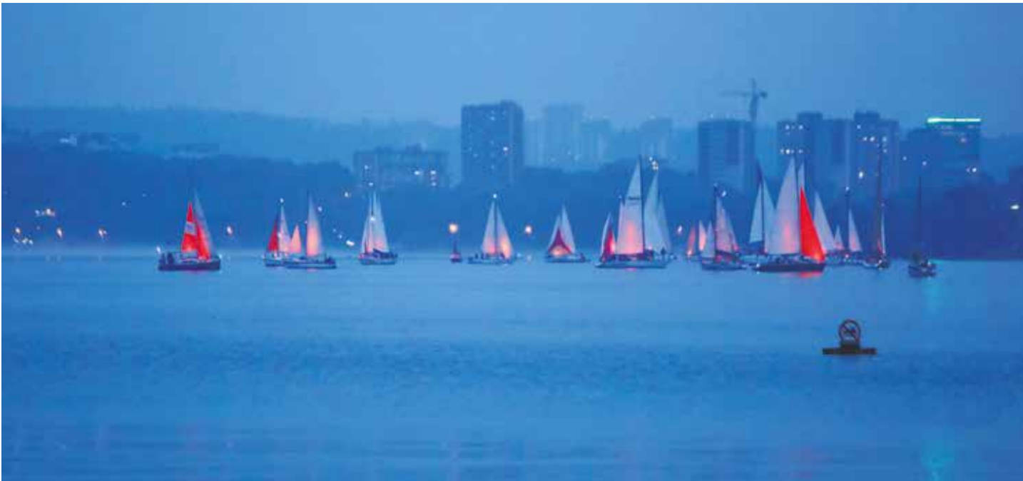
Воскресный вечер 25 июня, акватория Иркутского водохранилища недалеко от ледокола «Ангара». 28 яхт приняли участие в фестивале «Алые паруса Иркутска», посвященном выпускникам-2023. И знаете, огромное количество зрителей на берегу собралось, чтобы увидеть завораживающее свечение парусов!