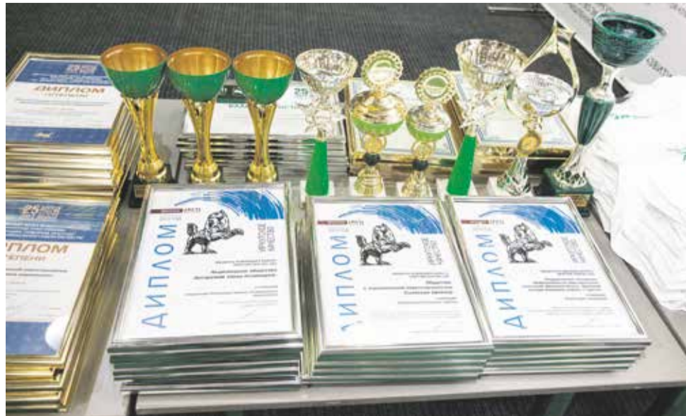
На региональном этапе конкурса «100 лучших товаров России» дипломов первой степени были удостоены 107 товаров и услуг 58 предприятий. Три предприятия с тремя видами продукции получили дипломы второй степени