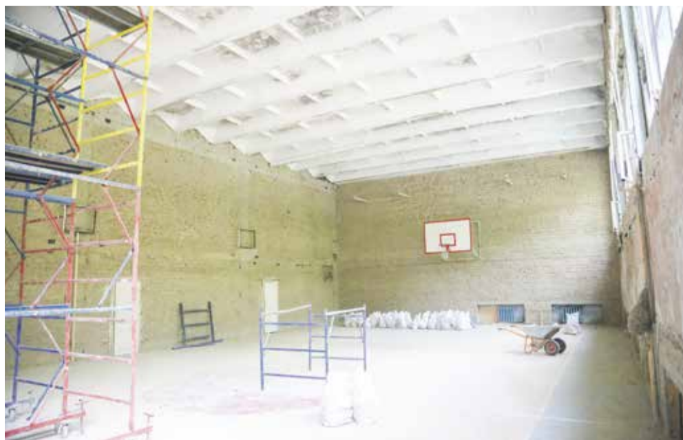
Спортивный зал школы № 22 в микрорайоне Солнечном этим летом переживает капитальный ремонт. Представители подрядной организации говорят, что уроки физкультуры теперь будут проходить в новеньком зале, его не узнаешь — поменяют абсолютно все. Системы отопления и вентиляции, электрику, освещение — все заменят, включая покрытие стен, потолков и пола. Кроме того, прямо на месте Руслан Николаевич обсудил с руководством школы благоустройство территории и варианты строительства нового блока для начальных классов

Летом в областном центре ремонтные работы пройдут более чем в 120 образовательных учреждениях. Большую часть из них подрядчики обещают закончить с опережением графика. На выполнение капитальных и текущих ремонтов в этом году из федерального, регионального и местного бюджетов направят более 600 миллионов рублей. При этом большую часть — 400 миллионов рублей — из городской казны. Это в три раза больше, чем было потрачено в 2022 году.