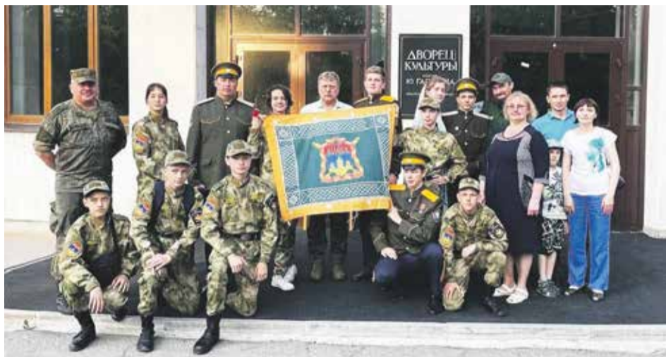
Казаки Иркутского городского казачьего войска «Вознесенское» после благотворительного концерта «Родина моя»: он состоялся 8 июня во Дворце культуры имени Ю. Гагарина. Мероприятие было посвящено сбору помощи семьям участников специальной военной операции