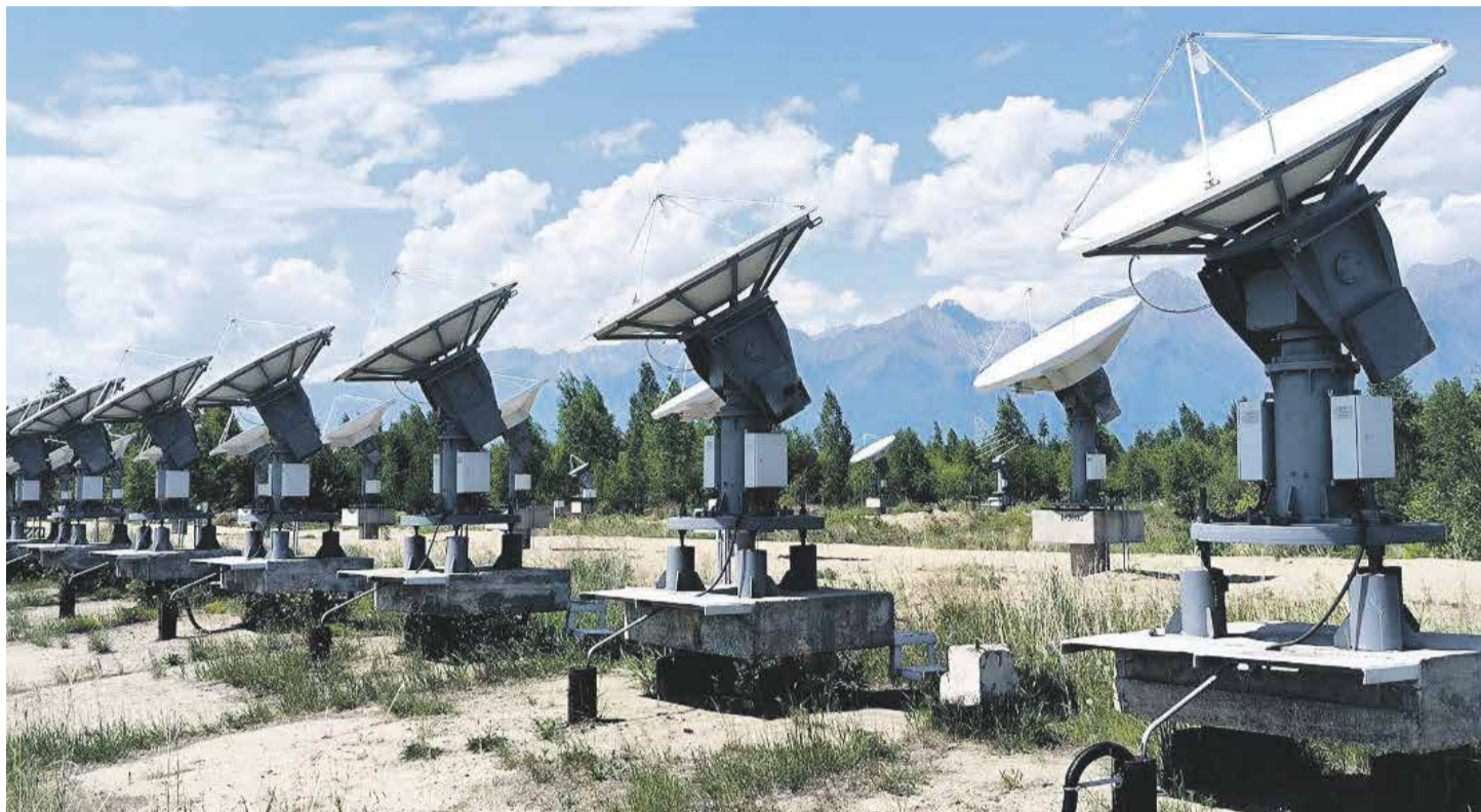
Запуск телескопа обсерватории «Бадары» (она находится в Тункинской долине между хребтами Восточных Саян и Хамар-Дабана) осуществили в августе 1984 года. 256 антенн имеют диаметр 2,5 м и установлены на равном расстоянии — в 4,9 м — друг от друга. На момент создания телескопа он не имел мировых аналогов. Авторский коллектив создателей телескопа был удостоен премии Правительства РФ в области науки и техники за 1996 год

Сама концепция комплекса была разработана в Институте солнечно-земной физики СО РАН под руководством академика РАН Гелия Александровича Жеребцова в 2007 году, а в 2013 году концепция получила поддержку правительства России.