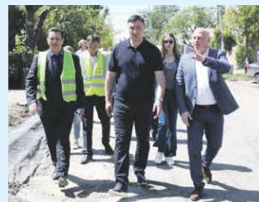
Идет проверка качества ремонта на улице Марии Ульяновой по национальному проекту «Безопасные качественные дороги». Кстати, глава города Руслан Болотов в минувшую среду «взял с собой на работу» двух иркутян — участников проекта #вместесМэром. Подробности — в следующем номере «Иркутска»