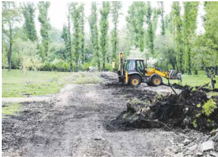
Борьба добра и зла в отдельно взятом парке «Комсомольский» продолжается. Чтобы дети не ломали все вокруг, для них сделают скейт-площадку, чтобы появилась возможность выплеснуть энергию без разрушения и на соревновательном драйве. Стоимость проекта — более пяти миллионов рублей. На фото экскаватор выравнивает будущее место для катания на самокатах, роликах и скейтах