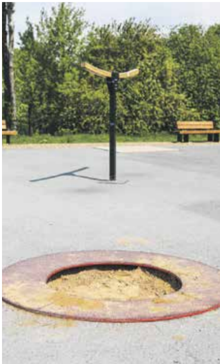
Батут, встроенный в эту окружность, уничтожили в первую же неделю после открытия парка. Его три раза рвали, и здесь не может быть и речи о том, что люди не знали, как правильно его эксплуатировать. Подрядчик восстанавливал повреждения за свой счет, хотя это не является гарантийным случаем. В итоге решено было сделать здесь песочницу. На качелях рядом оторвали сиденья вместе с креплениями. Небольшую канатную дорожку для катания на тарзанках тоже сломали