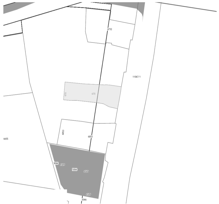
СХЕМА РАСПОЛОЖЕНИЯ ЗЕМЕЛЬНОГО УЧАСТКА И ОБЪЕКТА КАПИТАЛЬНОГО СТРОИТЕЛЬСТВА, В ОТНОШЕНИИ КОТОРЫХ ПОДГОТОВЛЕН ПРОЕКТ РЕШЕНИЯ О ПРЕДОСТАВЛЕНИИ РАЗРЕШЕНИЯ НА УСЛОВНО РАЗРЕШЕННЫЙ ВИД ИСПОЛЬЗОВАНИЯ «МАГАЗИНЫ» В ОТНОШЕНИИ ЗЕМЕЛЬНОГО УЧАСТКА С КАДАСТРОВЫМ НОМЕРОМ 38:36:000011:670, ПЛОЩАДЬЮ 730 КВ. М, РАСПОЛОЖЕННОГО ПО АДРЕСУ: ИРКУТСКАЯ ОБЛАСТЬ, Г. ИРКУТСК, УЛ. ПОЛЯРНАЯ, 119, «ОБЪЕКТЫ ТОРГОВОГО НАЗНАЧЕНИЯ» В ОТНОШЕНИИ ОБЪЕКТА КАПИТАЛЬНОГО СТРОИТЕЛЬСТВА С КАДАСТРОВЫМ НОМЕРОМ 38:36:000011:1912, ПЛОЩАДЬЮ 26,1 КВ. М, РАСПОЛОЖЕННОГО ПО АДРЕСУ: ИРКУТСКАЯ ОБЛАСТЬ, Г. ИРКУТСК, УЛ. ПОЛЯРНАЯ, Д. 119.

Учитывая запрос Набиева Низами Наби оглы о предоставлении разрешения на условно разрешенный вид использования земельного участка и объекта капитального строительства, предоставить разрешение на условно разрешенный вид использования «Магазины» в отношении земельного участка с кадастровым номером 38:36:000011:670, площадью 730 кв. м, расположенного по адресу: Иркутская область, г. Иркутск, ул. Полярная, 119, «Объекты торгового назначения» в отношении объекта капитального строительства с кадастровым номером 38:36:000011:1912, площадью 26,1 кв. м, расположенного по адресу: Иркутская область, г. Иркутск, ул. Полярная, д. 119.