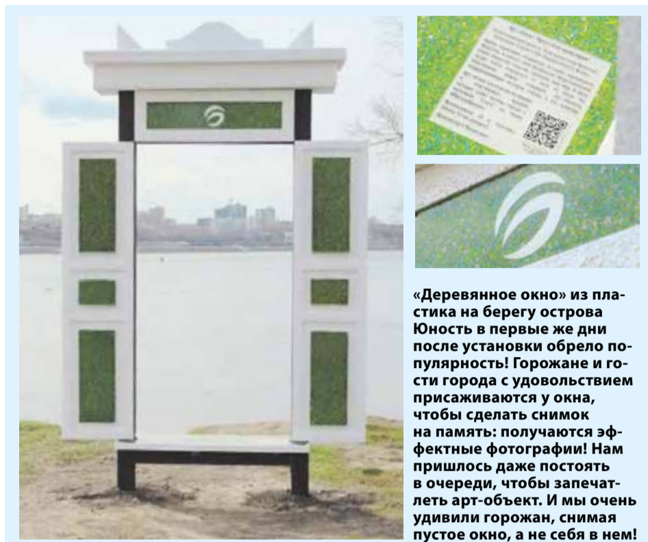
«Деревянное окно» из пластика на берегу острова Юность в первые же дни после установки обрело популярность! Горожане и гости города с удовольствием присаживаются у окна, чтобы сделать снимок на память: получаются эффектные фотографии! Нам пришлось даже постоять в очереди, чтобы запечатлеть арт-объект. И мы очень удивили горожан, снимая пустое окно, а не себя в нем!

Место выбрано не случайно. По задумке создателей, если заглянуть в арт-окно, откроется прекрасный пейзаж с историей — берега чистой-шей реки Ангары, на другом берегу — старинный железнодорожный вокзал, хранящий историю строительства Транссиба. На этот вокзал в 1898 году прибыл первый поезд. В окне хорошо виден и Глазковский мост протяженностью 1 км 245 метров, свидетель