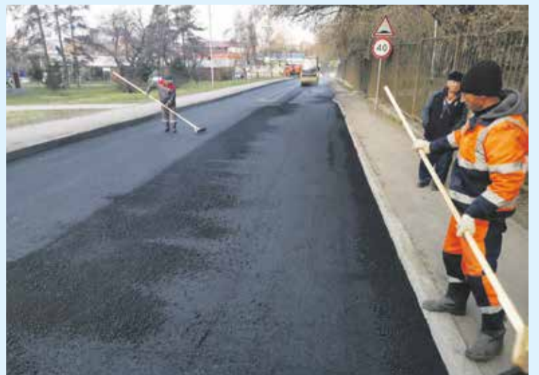
На фото — проезд от ул. Байкальской до ул. Коммунистической, где в минувший вторник утром заменили асфальт на проезжей части. Теперь в этом месте комфортная дорога для автолюбителей

Оставшиеся средства, выделенные в округе № 22 на наружное освещение, используют на обустройство третьего участка. Всего из депутатского фонда, сформированного из средств бюджета города, на эти работы Алексеем Распутиным направлено 1,55 млн рублей.