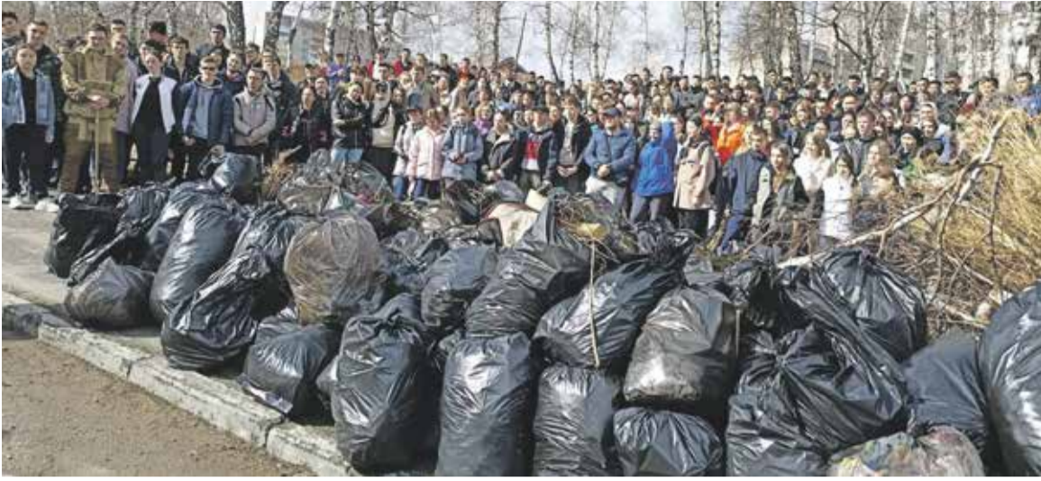
200 мешков с мусором, которые собрали неравнодушные жители микрорайона Университетского. Это традиционное мероприятие, которое проводится на территории избирательного округа № 28 уже на протяжении многих лет