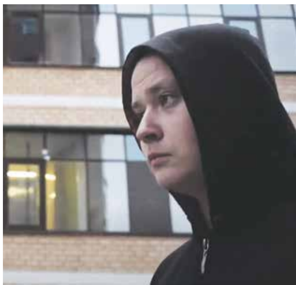
Фильм «В лес» создан в стилистике, при которой у зрителя создается ощущение присутствия на месте события. Он словно следует за персонажем, последовательно наблюдая за его действиями и поступками. На фото — кадр из фильма