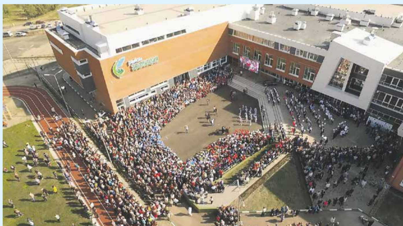
Знаменитая иркутская школа № 69 — объект, выполненный АО «Управление капитального строительства» Иркутска. Напомним, это трехэтажное здание площадью 23 тысячи квадратных метров, в восьми блоках различной конфигурации, связанных в единый комплекс. В школе размещено более 50 классов, четыре мастерских для занятий технологией, зрительный зал на 420 мест, актовый зал-форум на 146 мест, бассейн длиной 25 метров, большой спортивный зал, в котором могут одновременно заниматься три класса, хореографический зал, столовая, медицинский блок

— Как выходили из этой ситуации? — Применяли классические антикризисные меры.