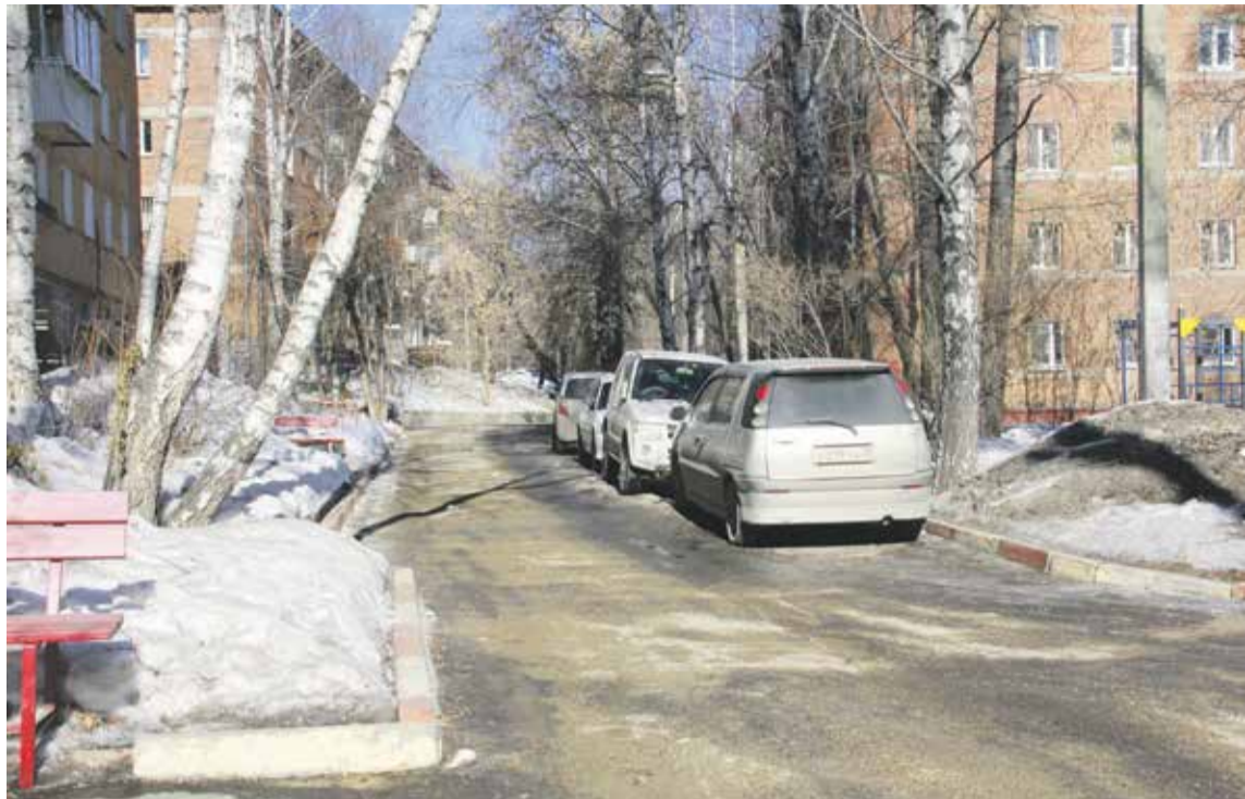
На фото — Академгородок, двор у дома № 325а на улице Лермонтова. Местные жители сообщили в социальных сетях, что на их дворовой территории скользко. И мэр Руслан Болотов приехал сюда с проверкой. Дороги во дворе действительно оказались покрыты льдом, однако незадолго до приезда проверяющих их все же обильно посыпали отсевом. Не знаем, связано это с проверкой или нет, но в любом случае для жителей это хороший знак. Возможно, теперь здесь будут чаще проводить обработку противогололедными материалами