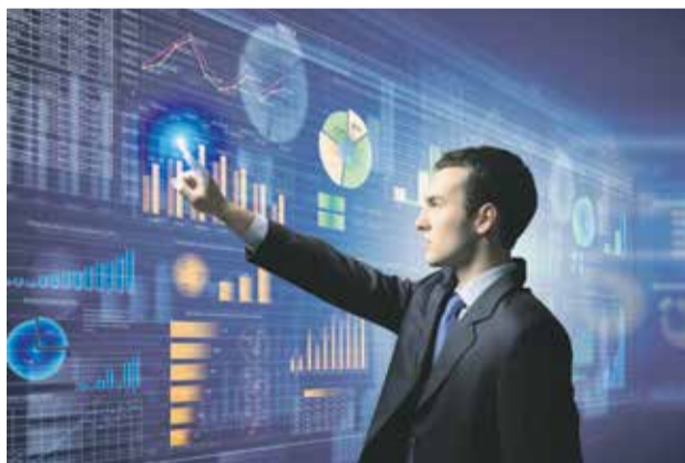
Выпускник сибирско-американского факультета ИГУ сможет стать, к примеру, специалистом по сотрудничеству с нейросетями и созданию текста. Профессионалы в этой сфере уже востребованы многими компаниями. Им необходимы глубокие знания в области лингвистики, стилистики, компьютерной науки, машинного обучения, математической статистики и других смежных дисциплин