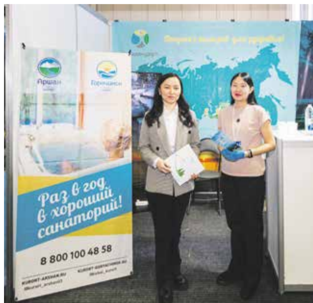
На «Ярмарке здоровья» сотрудники здравниц Тункинской долины рассказывали гостям о курортах «Аршан» и «Горячинск»

Для гостей курорта — массажи, фитобочки, гидромассаж и соляная пещера, различные ванны, широкий спектр физиотерапии, плавательный бассейн и сауна с минеральной водой, магнитотурботрон, Дэнас-Вертебра, озон- и гирудотерапия. Балконы, вид на ГЭС, чистый воздух. Рядом с городом. И вода, и чай в свободном доступе для отдыхающих.