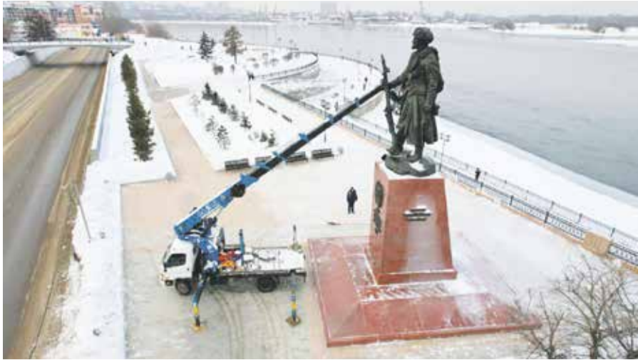
Памятник Якову Похабову (его еще называют памятником первопроходцам Сибири) — второй по величине монумент исторической личности в Иркутске (после памятника Александру Третьему). Так как сведений о том, как выглядел Похабов, не осталось, внешность первопроходца — исключительно плод воображения художника. Высота скульптуры — 6 метров, вес — 5 тонн