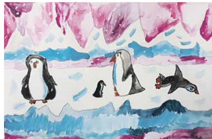
«Пингвины». Обратите внимание на гармонию цвета — ничего лишнего

что учить ее в школе нет смысла. Дети с таким диагнозом не могут ни читать, ни писать — вообще ничего. У них моторика не развита, они плохо ориентируются в пространстве, не способны к анализу.