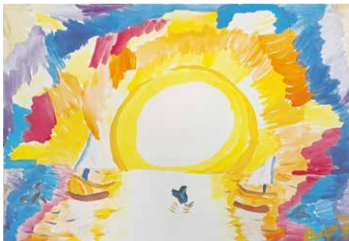
«Солнечное море». Эта работа написана под впечатлением от морского заката