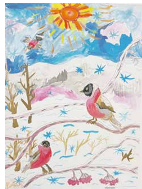
«Снегири». Глядя на этот рисунок, понимаешь, что Варя знает принципы перспективы и как правильно изобразить размеры объектов