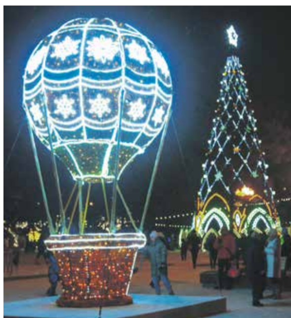
Вот такой воздушный шар появился в прошлом году у главной городской елки в сквере Кирова. Кстати, это место стало самым популярным для селфи у иркутян. В этом году можно будет продолжить появившуюся традицию — воздушный шар установят недалеко от елки

По словам Татьяны Николаевны, сегодня в стране есть общая тенденция на сокращение бюджетных расходов, связанных с проведением празд-