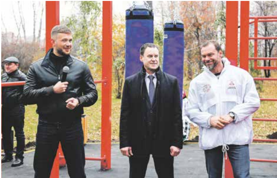
Председатель думы Иркутска Евгений Стекачев: «Искренне рад тому, как активно развивается мой любимый вид спорта в нашем городе: мы открываем новые залы, а теперь еще и появилась такая отличная уличная спортивная зона»