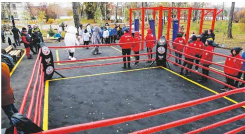
Такой ринг теперь появился для всех желающих на острове Юность. Рядом расположены скамейки, воркаут-зона, груши. Оборудование морозостойкое и выдерживает температуру до -50 градусов по Цельсию