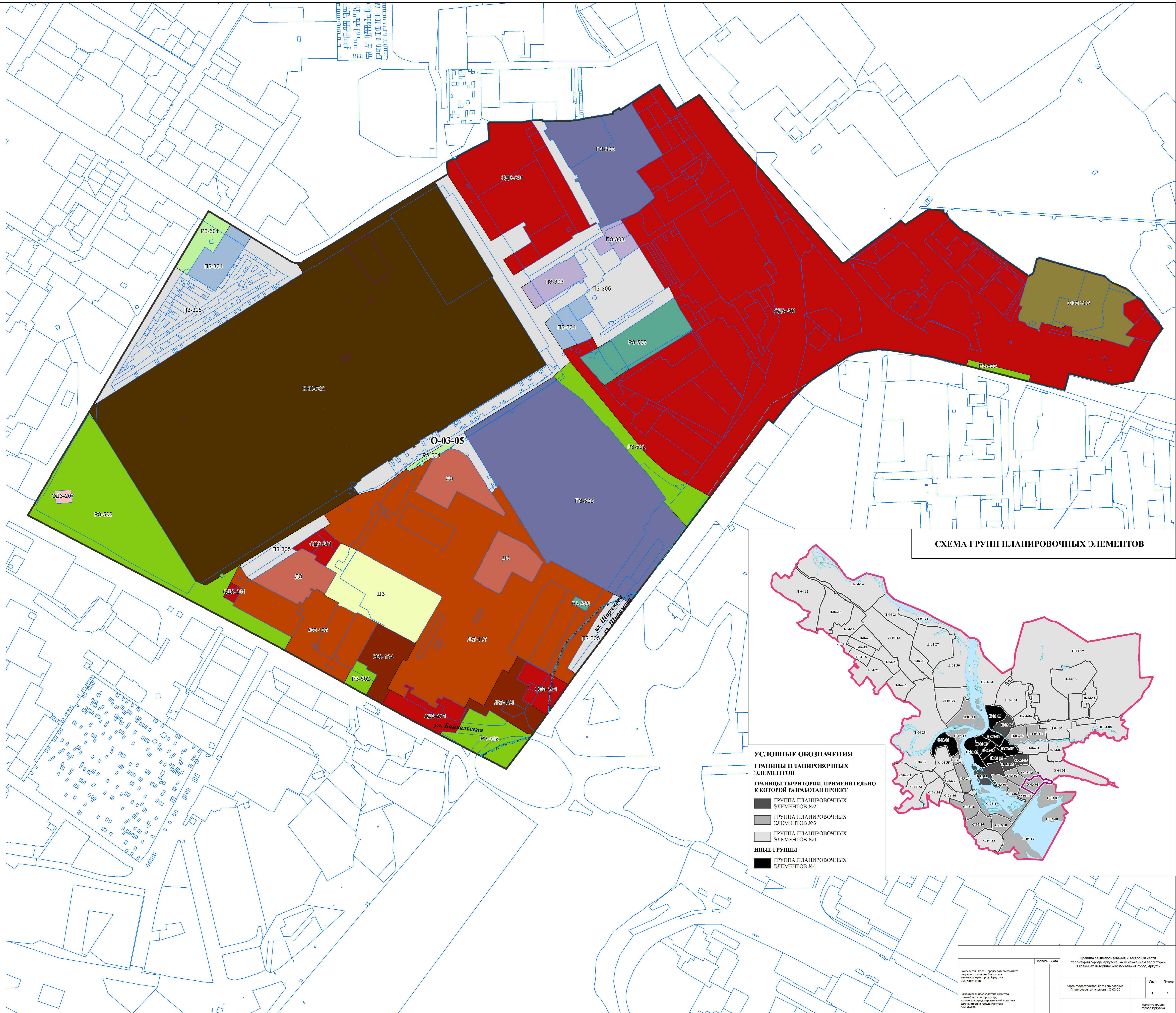
СХЕМА ГРУПП ПЛАНИРОВОЧНЫХ ЭЛЕМЕНТОВ