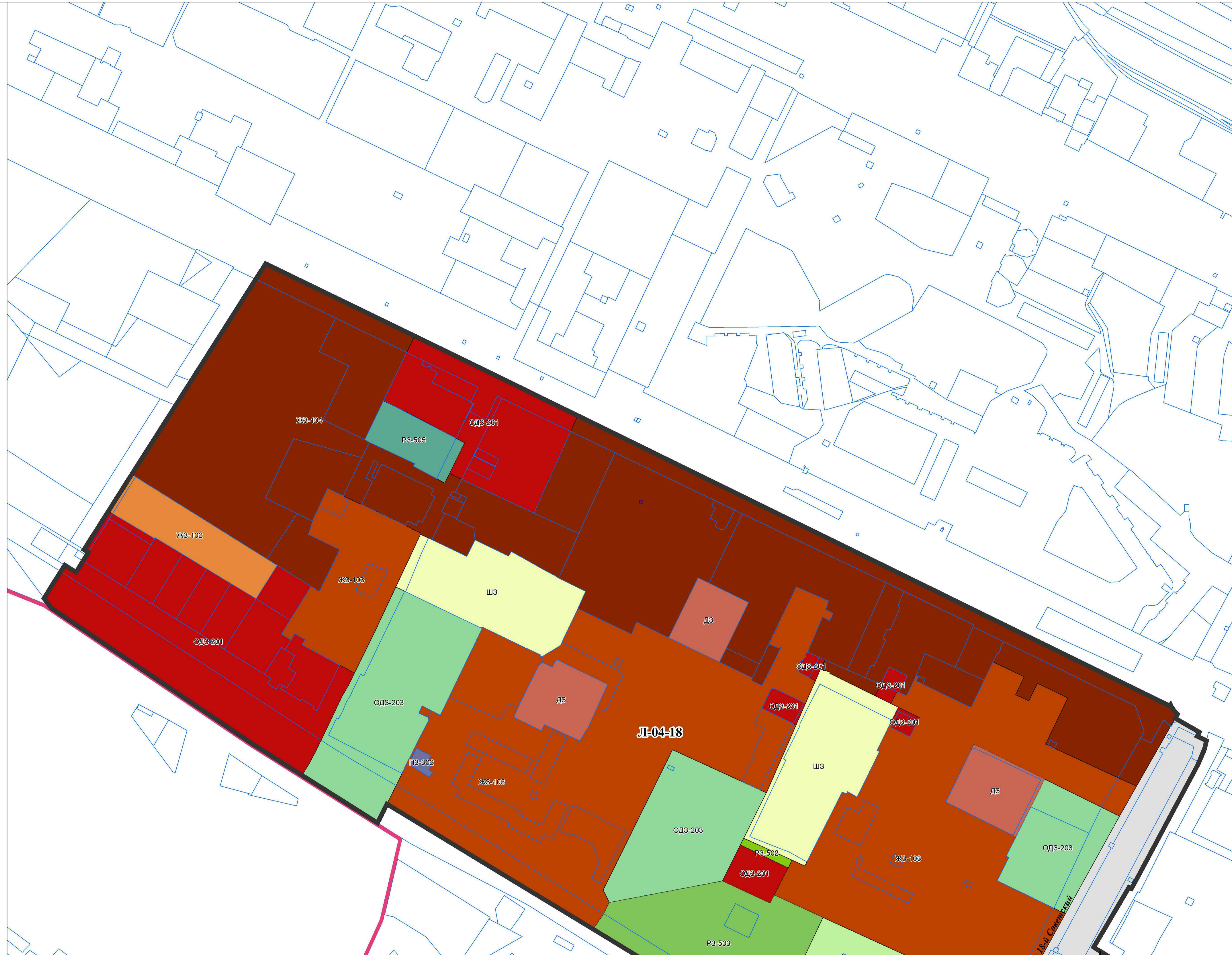
СХЕМА ГРУПП ПЛАНИРОВОЧНЫХ ЭЛЕМЕНТОВ