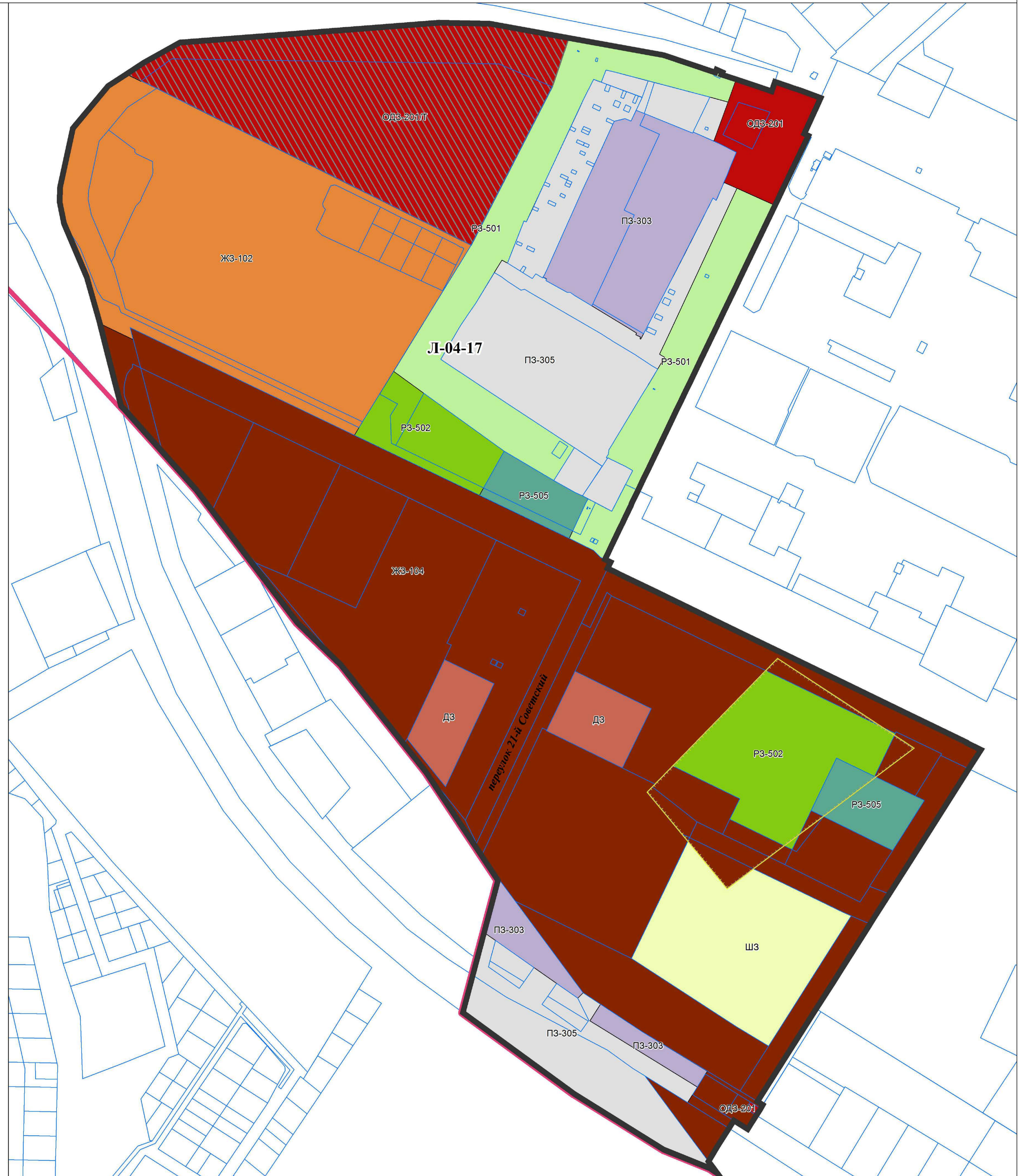
СХЕМА ГРУПП ПЛАНИРОВОЧНЫХ ЭЛЕМЕНТОВ