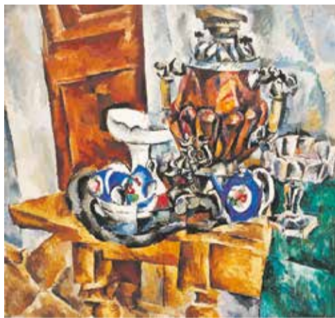
Среди произведений, которые представит на выставке в Галерее сибирского искусства Государственный Русский музей, — натюрморт Петра Кончаловского «Самовар» (1917 год) и картина Роберта Фалька «Старая Руза» (1913 год)

Что касается экспозиции Эрмитажа, то на ней будут представлены уникальные произведения прикладного искусства XVI–XXI веков. Генеральный директор Государственного Эрмитажа, академик РАН Михаил Пиотровский отметил, что на этой выставке собраны вещи, которых нет на страницах известных путеводителей, и их не видели даже те, кто хорошо знает этот легендарный музей. Она представляет предметы, на создание которых художников вдохновила раковина, как некое совершенное творение природы. На примере этих произведений хорошо видно, как