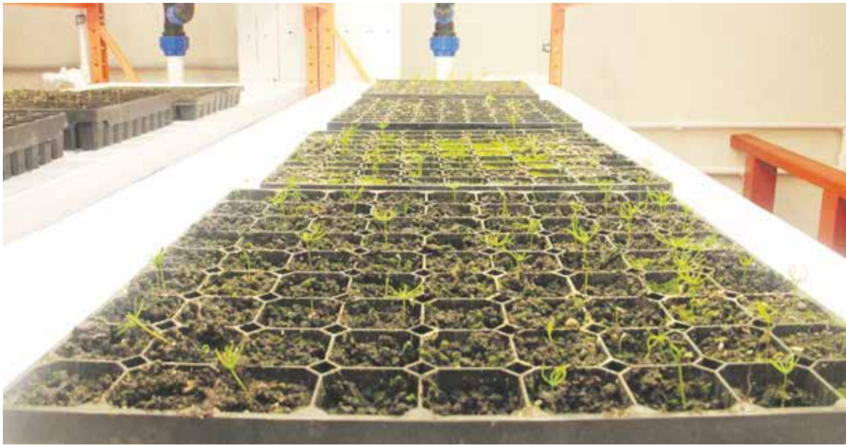
На фото — вертикальная ферма в экспериментальной лаборатории «Горзеленхоза». Она занимает гораздо меньше пространства за счет многоуровневых конструкций, а все важные для растений операции происходят автоматически. Новая технология требует меньшего участия человека и обеспечивает максимальную скорость роста и выживание растений. Для начала в «Горзеленхозе» планируется построить одну вертикальную теплицу на 500 кв. м высотой 10 ярусов