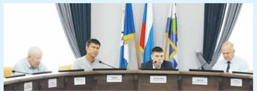
Сейчас в думе города Иркутска седьмого созыва четыре депутатских объединения: две фракции — ВПП «Единая Россия», «Гражданская платформа» и две группы — «Иркутск социальный», «Стратегия социально-экономического развития Иркутска»

Подрядная организация уже выполнила планировочные работы, уложила кабель для опор освещения и установила закладные детали под опоры. Сейчас устанавливается гранитный бортовой камень, подготавливается основание для укладки тротуарной плитки. Также проезжую часть выложат гранитной брусчаткой, проведут озеленение территории (высадят лиственницу, калину, сирень, кизильник обыкновенный), установят скамейки и урны.