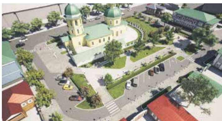
Это эскиз из проекта по благоустройству сквера в переулке Волконского. Общий вид с высоты птичьего полета с южной стороны в дневное время. Совсем скоро эта территория станет хорошим местом для отдыха жителей

Р аботы по благоустройству территории ведутся по федеральному проекту «Формирование комфортной городской среды». Их планируют закончить до сентября. В настоящее время подрядчик выполнил около 40% от общего объема работ.