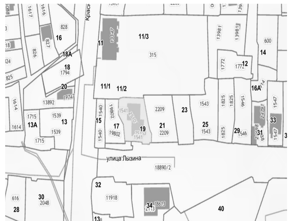
СХЕМА РАСПОЛОЖЕНИЯ ЗЕМЕЛЬНОГО УЧАСТКА, В ОТНОШЕНИИ КОТОРОГО ПОДГОТОВЛЕН ПРОЕКТ РЕШЕНИЯ О ПРЕДОСТАВЛЕНИИ РАЗРЕШЕНИЯ НА УСЛОВНО РАЗРЕШЕННЫЙ ВИД ИСПОЛЬЗОВАНИЯ «ПРЕДПРИНИМАТЕЛЬСТВО» В ОТНОШЕНИИ ЗЕМЕЛЬНОГО УЧАСТКА С КАДАСТРОВЫМ НОМЕРОМ 38:36:000020:1541, ПЛОЩАДЬЮ 732 КВ. М, РАСПОЛОЖЕННОГО ПО АДРЕСУ: ИРКУТСКАЯ ОБЛАСТЬ, Г. ИРКУТСК, УЛ. ЛЫЗИНА, 19, «МНОГОФУНКЦИОНАЛЬНЫЕ ОБЪЕКТЫ» В ОТНОШЕНИИ ОБЪЕКТА КАПИТАЛЬНОГО СТРОИТЕЛЬСТВА С КАДАСТРОВЫМ НОМЕРОМ 38:36:000020:25103, ПЛОЩАДЬЮ 774,3 КВ. М, РАСПОЛОЖЕННОГО ПО АДРЕСУ: РОССИЙСКАЯ ФЕДЕРАЦИЯ, ИРКУТСКАЯ ОБЛАСТЬ, Г. ИРКУТСК, УЛ. ЛЫЗИНА, Д. 19.

Учитывая запрос Акимовой Анастасии Олеговны о предоставлении разрешения на условно разрешенный вид использования земельного участка и объекта капитального строительства, предоставить разрешение на условно разрешенный вид использования «Предпринимательство» в отношении земельного участка с кадастровым номером 38:36:000020:1541, площадью 732 кв. м, расположенного по адресу: Иркутская область, г. Иркутск, ул. Лызина, 19, «Многофункциональные объекты» в отношении объекта капитального строительства с кадастровым номером 38:36:000020:25103, площадью 774,3 кв. м, расположенного по адресу: Российская Федерация, Иркутская область, г. Иркутск, ул. Лызина, д. 19.