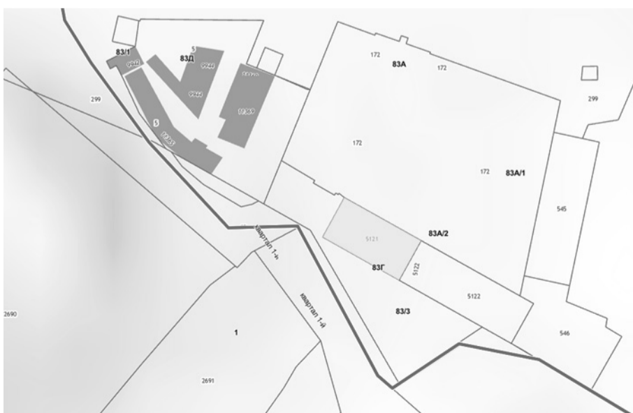
СХЕМА РАСПОЛОЖЕНИЯ ЗЕМЕЛЬНОГО УЧАСТКА, В ОТНОШЕНИИ КОТОРОГО ПОДГОТОВЛЕН ПРОЕКТ РЕШЕНИЯ О ПРЕДОСТАВЛЕНИИ РАЗРЕШЕНИЯ НА УСЛОВНО РАЗРЕШЕННЫЙ ВИД ИСПОЛЬЗОВАНИЯ «ДЛЯ ИНДИВИДУАЛЬНОГО ЖИЛИЩНОГО СТРОИТЕЛЬСТВА» В ОТНОШЕНИИ ЗЕМЕЛЬНОГО УЧАСТКА С КАДАСТРОВЫМ НОМЕРОМ 38:36:000026:5121, ПЛОЩАДЬЮ 407 КВ. М, РАСПОЛОЖЕННОГО ПО АДРЕСУ: ИРКУТСКАЯ ОБЛАСТЬ, Г. ИРКУТСК, СВЕРДЛОВСКИЙ РАЙОН, МКР. ЮБИЛЕЙНЫЙ.

Учитывая запрос Томеряна Гарика Врежевича о предоставлении разрешения на условно разрешенный вид использования земельного участка, предоставить разрешение на условно разрешенный вид использования «Для индивидуального жилищного строительства» в отношении земельного участка с кадастровым номером 38:36:000026:5121, площадью 407 кв. м, расположенного по адресу: Иркутская область, г. Иркутск, Свердловский район, мкр. Юбилейный.