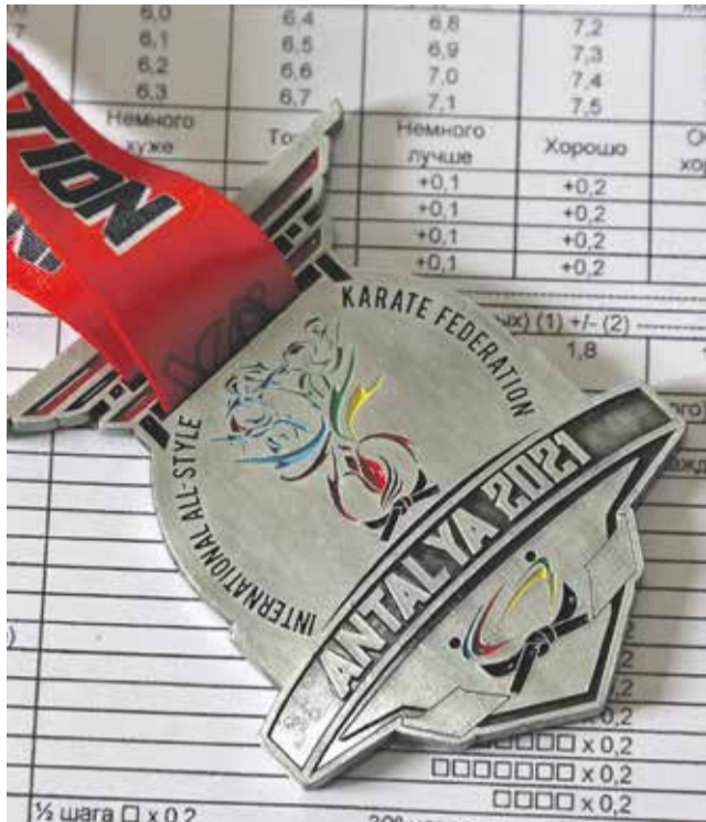
Вот такие медали, сразу ставшие раритетными, с надписью ANTALYA 2021 вручали призерам чемпионата мира по всестилевому карате, проходившего в марте 2022 года в Суздале

тельное слово в схватке предоставлено его сопернице — именно женщина наносит последний удар.