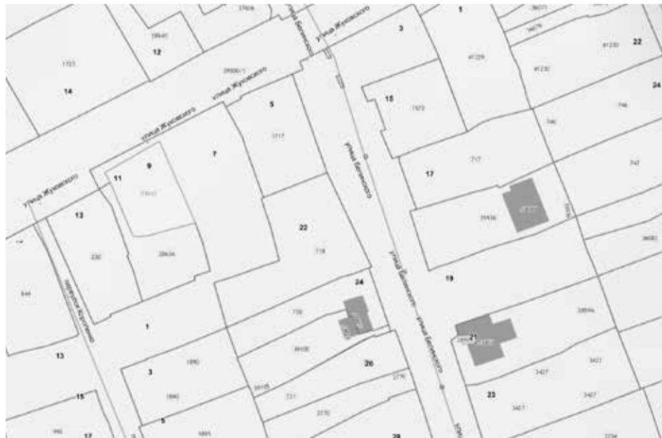
СХЕМА РАСПОЛОЖЕНИЯ ЗЕМЕЛЬНОГО УЧАСТКА, В ОТНОШЕНИИ КОТОРОГО ПОДГОТОВЛЕН ПРОЕКТ РЕШЕНИЯ О ПРЕДОСТАВЛЕНИИ РАЗРЕШЕНИЯ НА УСЛОВНО РАЗРЕШЕННЫЙ ВИД ИСПОЛЬЗОВАНИЯ «ДЛЯ ИНДИВИДУАЛЬНОГО ЖИЛИЩНОГО СТРОИТЕЛЬСТВА» В ОТНОШЕНИИ ЗЕМЕЛЬНОГО УЧАСТКА С КАДАСТРОВЫМ НОМЕРОМ 38:36:000033:33843, ПЛОЩАДЬЮ 529 КВ. М, РАСПОЛОЖЕННОГО ПО АДРЕСУ: ИРКУТСКАЯ ОБЛАСТЬ, Г. ИРКУТСК, СВЕРДЛОВСКИЙ РАЙОН, УЛ. ЖУКОВСКОГО, 9.

Учитывая запрос Кязимова Видадия Ниязлы оглы о предоставлении разрешения на условно разрешенный вид использования земельного участка, предоставить разрешение на условно разрешенный вид использования «Для индивидуального жилищного строительства» в отношении земельного участка с кадастровым номером 38:36:000033:33843, площадью 529 кв. м, расположенного по адресу: Иркутская область, г. Иркутск, Свердловский район, ул. Жуковского, 9.