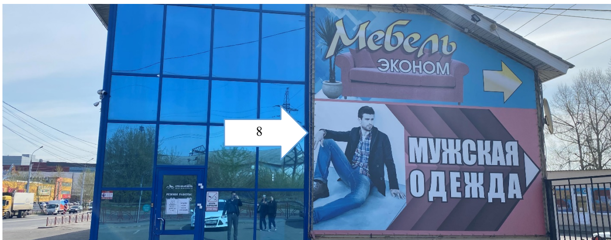
Перечень информационных конструкций, подлежащих демонтажу в добровольном порядке