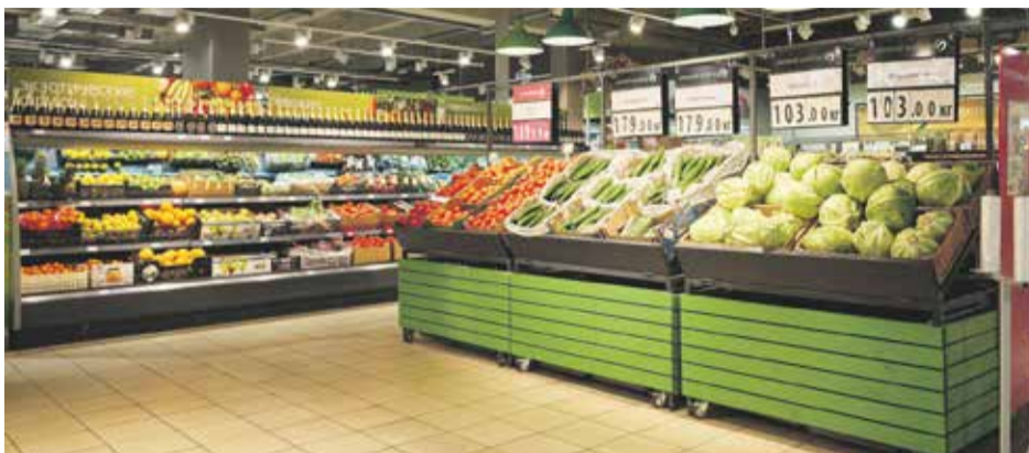
Основной объем фруктов и овощей в магазины компании «Слата» поставляется из стран ближнего зарубежья — Узбекистана, Казахстана, Киргизии, Китая

— Какие направления интересны вашим сетям для развития?