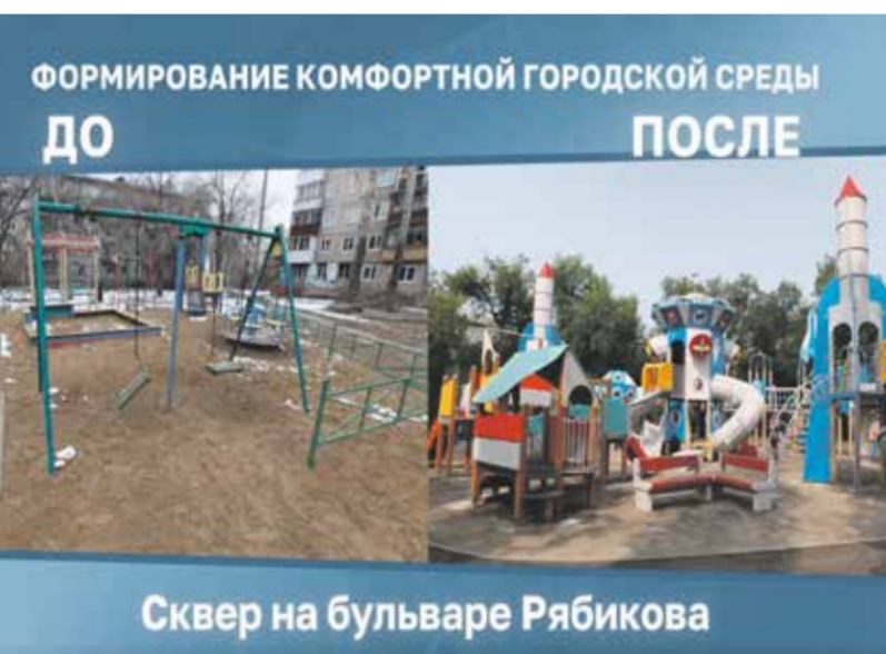
Сквер на бульваре Рябикова

В 2021 году в рамках федерального проекта «Формирование комфортной городской среды» комплексно благоустроили 54 двора и 17 общественных пространств.