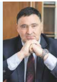
Мэр Иркутска Руслан Болотов

По результатам голосования прошлого года мы увидели, что иркутяне активно включились в процесс выбора общественных территорий. Убежден, что в этом году за парки и скверы, которые планируются для благоустройства в 2023 году, проголосуют также не менее 50 тысяч жителей. Второй год подряд участвовать в голосовании можно онлайн, что удобно и не займет много времени. Поэтому призываю иркутян не оставаться в стороне: от нашего выбора зависит то, как будет меняться облик города.