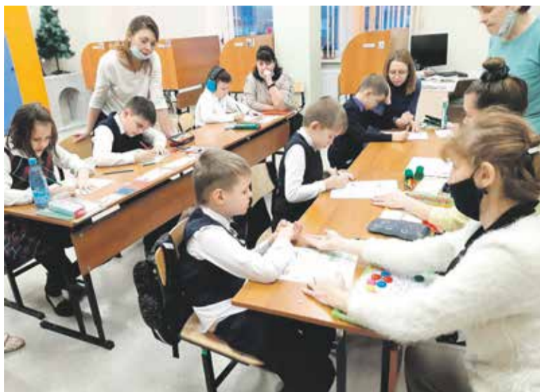
Ученики ресурсного класса школы № 33 посещают по два урока в день в общеобразовательных классах. При поддержке тьютора они сосредотачиваются на материале и выполняют все задания учителя, не отвлекаются и не отвлекают других ребят. Остальные часы они занимаются индивидуально или в группе в своем классе