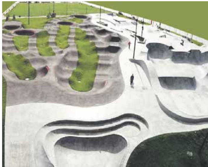
Будущий «спортивный парк на берегу Ушаковки» расположен возле торгового центра «Флагман» в Правобережном округе Иркутска. На данном этапе на пустующей территории проведут работы по созданию бетонного скейт-парка с обустройством там пешеходной зоны и освещения