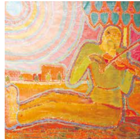
Творчество иркутских художников в советское время не вписывалось в рамки соцреализма. Они представляли самые разные направления, в том числе авангард, несмотря на жесткое давление официальной критики и властей. Одним из ярких представителей этого стиля был Алексей Жибинов. В экспозиции представлены несколько его работ, в том числе «Играющий на скрипке» из цикла «Синее солнце»