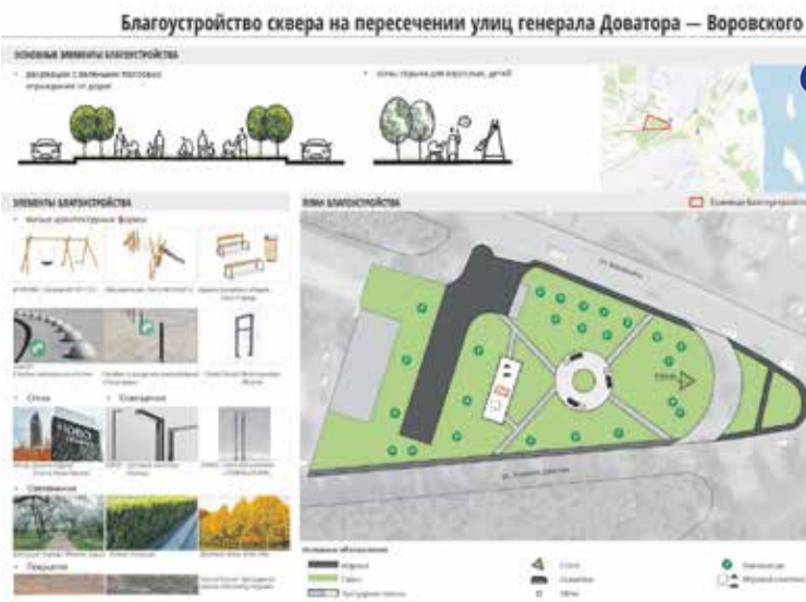
Сквер на пересечении улиц Генерала Доватора и Воровского находится в поселке Жилкино, недалеко от Ангары. Благоустройство его территории — это создание рекреационной зоны с зелеными полосами ограждения от дорог, зоны отдыха для взрослых и детей, установка малых архитектурных форм и стелы, освещение, озеленение территории и устройство покрытия

По результатам голосования прошлого года мы увидели, что иркутяне активно включились в процесс выбора общественных территорий. Убежден, что в этом году за парки и скверы, которые планируются для благоустройства в 2023 году, проголосуют также не менее 50 тысяч жителей. Второй год подряд участвовать в голосовании можно онлайн, что удобно и не займет много времени. Поэтому призываю иркутян не оставаться в стороне: от нашего выбора зависит то, как будет меняться облик города.