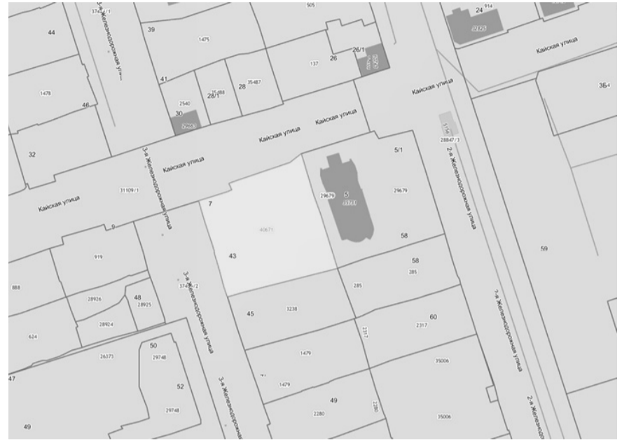
Схема расположения земельного участка, в отношении которого подготовлен проект решения о предоставлении разрешения на условно разрешенный вид использования «Гостиничное обслуживание» в отношении земельного участка с кадастровым номером 38:36:000033:40671, площадью 1740 кв. м, расположенного по адресу: Российская Федерация, Иркутская область, городской округ город Иркутск, город Иркутск, улица Кайская, земельный участок 7.

Учитывая запрос Калашниковой Светланы Анатольевны о предоставлении разрешения на условно разрешенный вид использования земельного участка, предоставить разрешение на условно разрешенный вид использования «Гостиничное обслуживание» в отношении земельного участка с кадастровым номером 38:36:000033:40671, площадью 1740 кв. м, расположенного по адресу: Российская Федерация, Иркутская область, городской округ город Иркутск, город Иркутск, улица Кайская, земельный участок 7.