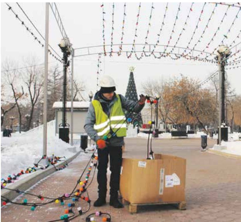
Так демонтируют «Звездное небо» — масштабную гирлянду, которая создавала своеобразную светящуюся арку на входе в сквер Кирова со стороны здания Востсибугля. Длина этой гирлянды более километра, а убирают ее секциями, упаковывая каждую в отдельную коробку