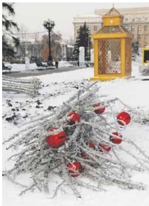
Светящиеся по вечерам деревья в новогоднем убранстве в сквере Кирова заворачивали! Даже не верится, что вот это они и есть — тщательно разобранные, готовые к тому, чтобы уехать в специальный склад на хранение до следующего декабря