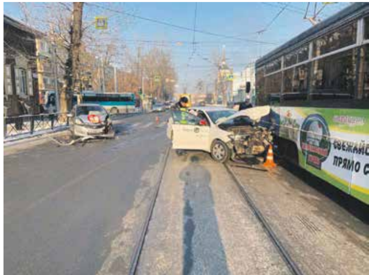
В центре Иркутска, на улице Тимирязева, в воскресенье, 30 января, дорогу не поделили «Хонда Фит» и «Фольксваген Поло». После удара «Фольксваген» отбросило на стоявший рядом на остановке трамвай. В аварии пострадали два человека