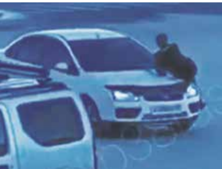
Двух лихачей задержали на прошлой неделе сотрудники ГИБДД благодаря социальным сетям. На кадре из видео неизвестный водитель совершает опасные маневры, в то время как на капоте его автомобиля сидит человек. 19-летний нарушитель признал вину, объяснив, что «просто не подумал»

Антон Конев, по информации ОИГБДД МУ МВД России «Иркутское»