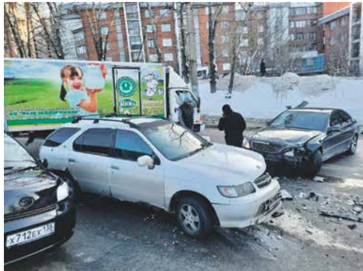
Сразу четыре автомобиля столкнулись на улице Академической в субботу, 29 января. По информации дорожной полиции, происшествие не обошлось без пострадавших. Медицинская помощь потребовалась одному из пассажиров легковушек