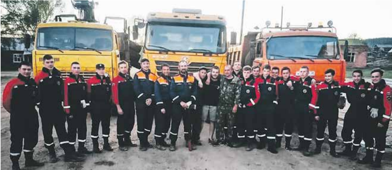
Команда Иркутского регионального отделения Всероссийского студенческого корпуса спасателей на ликвидации последствий пожара в поселке Дальнем Нижнеилимского района в мае 2021 года