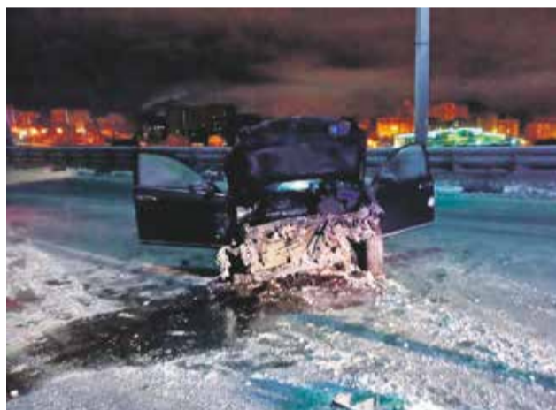
Эта авария произошла около четырех часов утра 29 января на Академическом мосту. Водитель «Ниссана», двигавшийся на левый берег, не справился с управлением. Его автомобиль занесло, и он врезался в металлическое ограждение. Молодой человек бросил разбитую машину и находившихся в ней друзей и скрылся

В отношении шестнадцатилетнего иркутянина сотрудниками ГИБДД