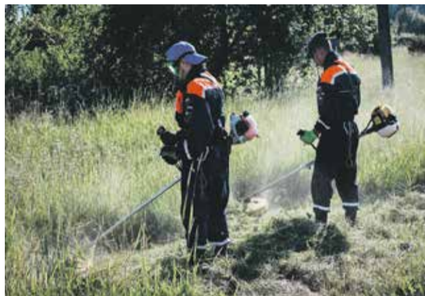
Одна из задач, которая стоит перед членами студенческого отряда во время ликвидации последствий пожаров: убрать все, что еще может загореться. Поэтому спасатели скашивают все сухие растения на территории и убирают ветхое жильё

ВСКС — это всероссийская команда спасения, которая проводит спасательные операции, принимает участие в ликвидации крупных ЧС федерального масштаба, проектах МЧС, а также молодежных форумах и соревнованиях. Все сту-