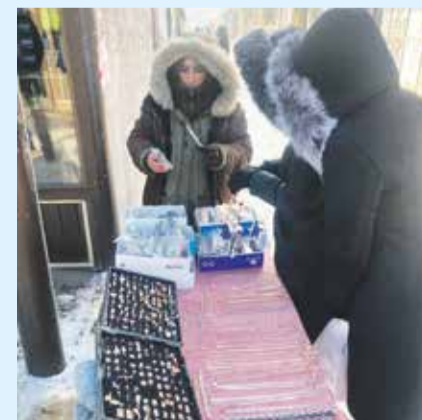
Вот такие самодельные прилавки-столы привлекли внимание проверяющих на улице Тимирязева. Здесь шла бойкая торговля очками и бижутерией очень сомнительного качества. В отношении продавцов составлены протоколы об административном правонарушении