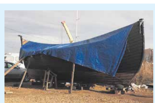
Драккар «Ворон» на зимовке. К слову, если деревянное судно вовремя не вытащить на берег, дерево раздавит льдом. А если доски не успеют просохнуть к зиме, то вода в них начнет расширяться, и вся конструкция потрескается