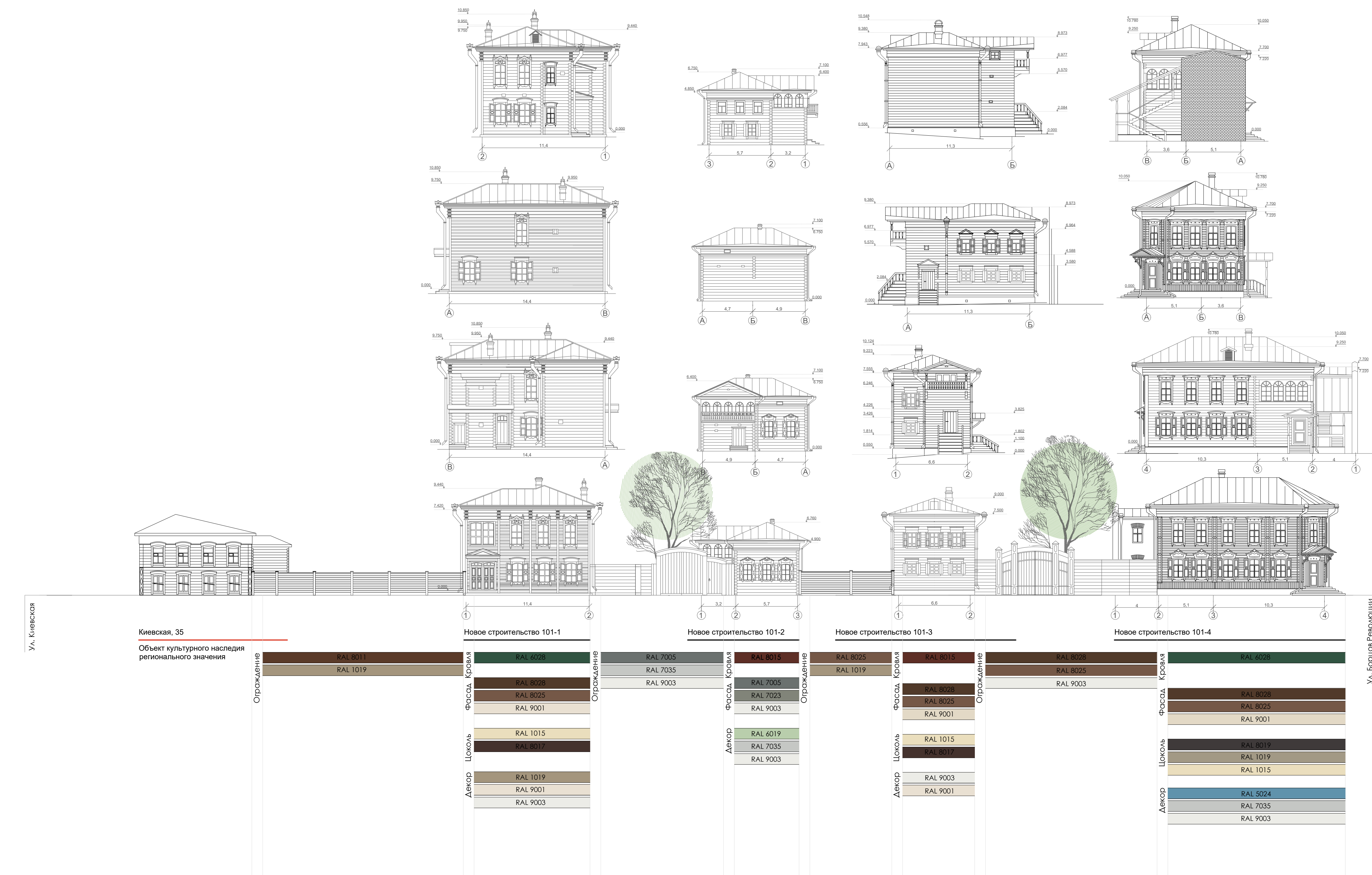
Развертка по улице Подгорная в границах улиц Киевская, Борцов Революции, нечетная сторона.