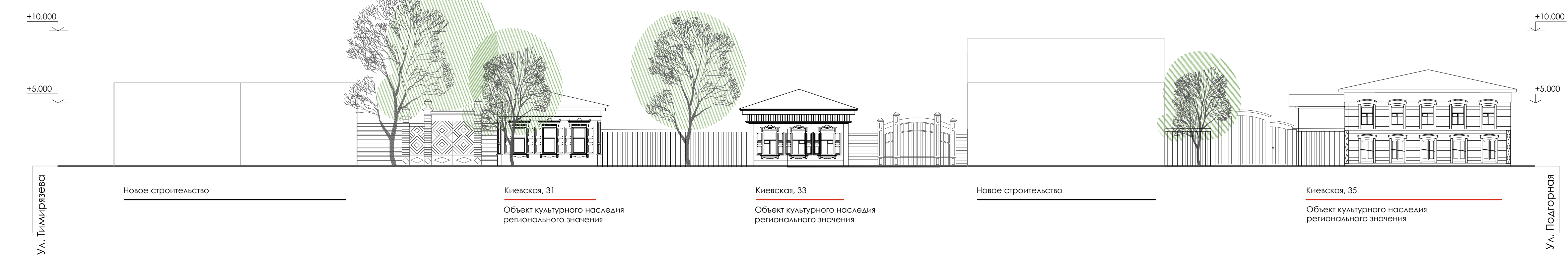
Развертка по улице Киевская в границах улиц Тимирязева, Подгорная, нечетная сторона.