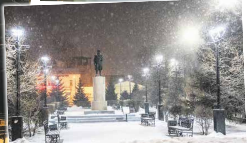
Так атмосферно перед Новым годом выглядит сквер на углу улиц Карла Маркса и Октябрьской Революции, где стоит памятник Валериану Куйбышеву