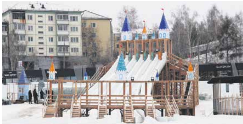
В этом году «Хрустальная сказка» распахнет свои двери в конце декабря. В честь открытия в городке проведут праздничные мероприятия и розыгрыши. За новостями можно следить в группах «Хрустальной сказки». Телефон для справок 97-48-27

Ледовый городок в Солнечном готовится к открытию