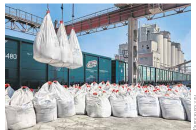
АО «Ангарскцемент» заранее готовит оборудование к предстоящему строительному сезону, чтобы по первому требованию рынка предоставить необходимый объем высококачественной продукции

К слову, в этом году механики «Ангарскцемента» в очередной раз завоевали первое место в ежегодном отраслевом конкурсе холдинга «Сибирский цемент». Что подтверждает профессионализм спе-