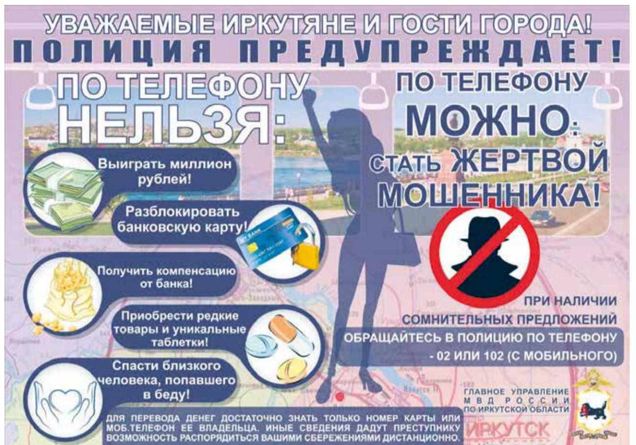
Чтобы защитить граждан от действий преступников, полицейские проводят профилактические мероприятия и разрабатывают памятки с описанием распространенных видов мошенничества

— И никто из проходивших мимо людей ей не помог, — сокрушается собеседница. — Не обратил внимания, не поинтересовался этой странной ситуацией.