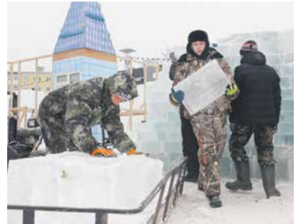
Строительство ледового городка идет полным ходом! И совсем скоро популярная развлекательная площадка в Солнечном примет гостей

«Хрустальная сказка». — Все это время мы совершенствовали форму горки, пока не нашли идеальные параметры. Они рассчитаны по градусам скольжения и по уклонам в поворотах, отчего развивается хорошая, а главное безопасная скорость.