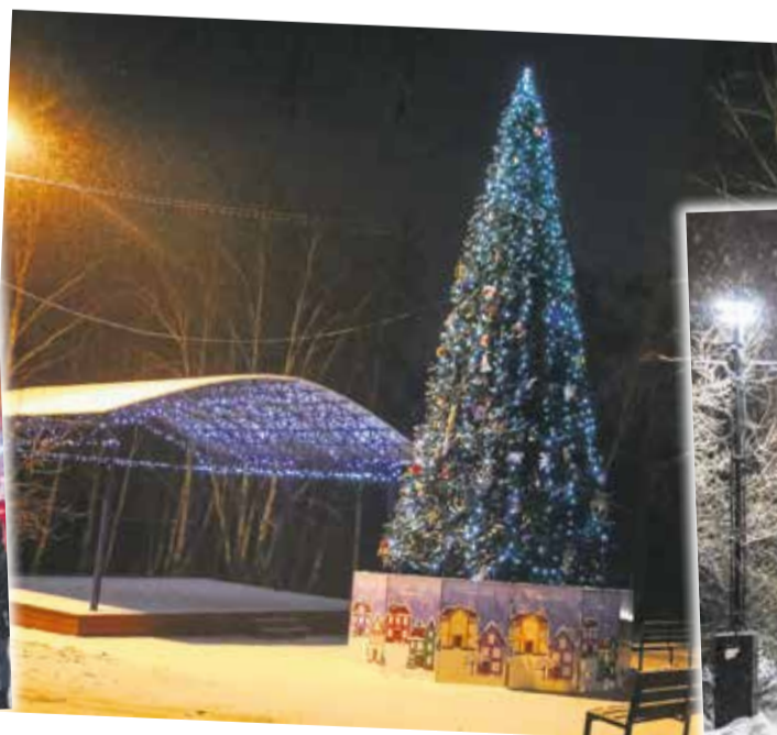
В роще на Синюшиной Горе установили елку высотой 10 метров! Открытая сцена рядом тоже получила свою порцию светящихся огоньков