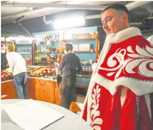
В таком образе иркутяне еще не видели своего мэра. Сыграть в новогоднем фильме Руслан Болотов согласился без раздумий, причем роль ему досталась немаленькая: с диалогами и двумя сценами. «Хорошо, что петь не пришлось», — пошутил глава города