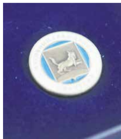
Вот так выглядит иркутский знак отличия «Активный гражданин». Его теперь будут вручать каждый год, но, разумеется, не всем подряд. Знак должен стать редкой и престижной наградой для иркутян