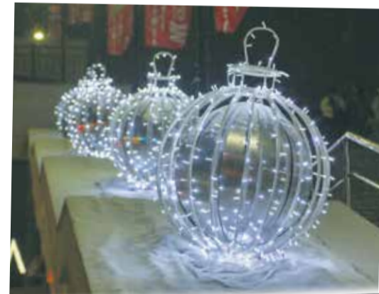
Никогда такого не видели: светящиеся елочные шары (примерно с метр в диаметре) у «Модного квартала»