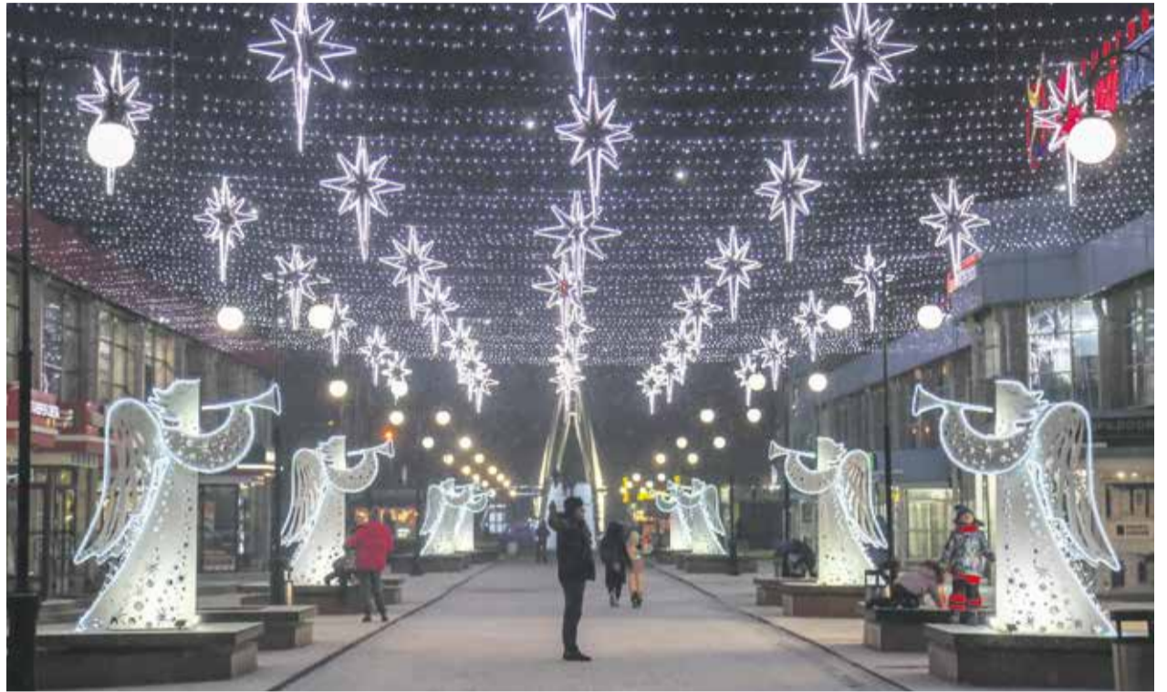
Потрясающе оформлен проход между зданиями у торговых центров «Фортуны»: трубящие ангелы и «небо в алмазах» мгновенно погружают в праздничную атмосферу. Большое спасибо ГК «Фортуна» за то, что так талантливо предприятие украшает свои территории к празднику!

В городе продолжается подготовка к новогодним торжествам: праздничное настроение создают яркая иллюминация, ледовые фигуры и необычное оформление торговых точек. Для предпринимателей администрация Иркутска проводит смотр-конкурс «Лучшее праздничное оформление», всего семь номинаций: «Лучшее праздничное оформление торгового центра», «Лучшее праздничное оформление стационарного магазина у дома», «Лучшее праздничное оформление супермаркета, универсама», «Лучшее праздничное оформление предприятия общественного питания», «Лучшее праздничное оформление предприятия бытового обслуживания», «Лучшее праздничное оформление нестационарного торгового объекта», «Лучшее праздничное оформление цветочного магазина». Итоги конкурса будут подведены в январе. А мы рады сообщить горожанам, что на всех украшенных к Новому году общественных пространства установлены камеры видеонаблюдения — такое поручение на заседании рабочей группы по вопросам организации празднования Нового года дал мэр Иркутска Руслан Болотов.