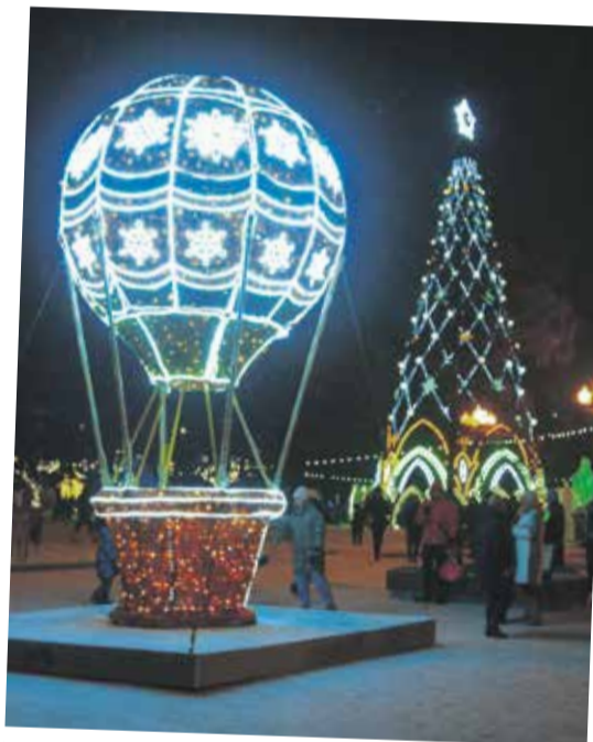
Воздушный шар у главной городской елки в сквере Кирова: сразу вспоминаются герои Жюль Верна