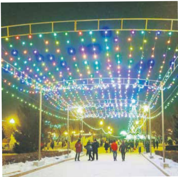
Новогодняя арка «Звездное небо» в сквере Кирова: самое популярное место для селфи