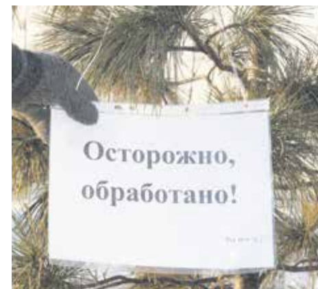
Деревья, обработанные специальным химическим раствором, можно узнать вот по таким табличкам

При этом препарат, которым опрыскивают елки, соответствует всем санитарно-эпидемиологическим требованиям и безопасен для людей и животных. В этом году в его состав добавили зеленое мыло — специальный компонент, помогающий