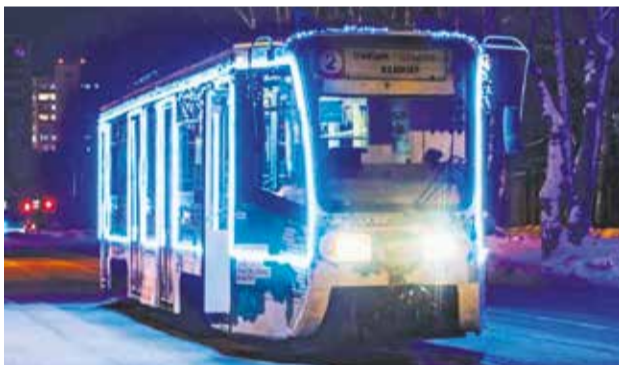
Знаменитая «двойка» — один из самых популярных иркутских трамваев с конечной на железнодорожном вокзале. Новогодний прикид для нее создали работники родного Иркутскгортранса

«Ангарскцемент» в 2021 году превысил прошлогодние объемы производства и реализации на 30 процентов и рассчитывает на столь же высокий спрос в будущем