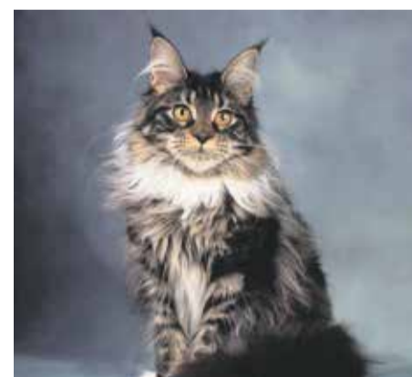
На фото — один из представителей породы мейн-кунов. Именно их предпочитают заводить иркутяне