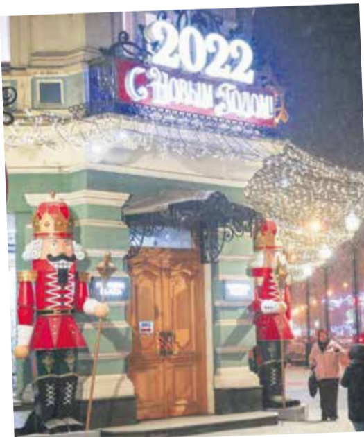
Зубастые Щелкунчики у торгового центра «Фортуна Плаза» на углу улиц Чехова и Карла Маркса: много желающих здесь сфотографироваться. И как всегда, ГК «Фортуна» — на высоте в создании новогоднего настроения иркутянам