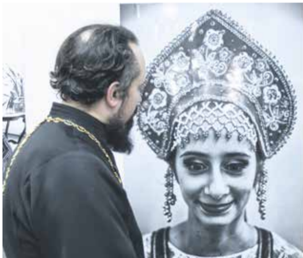
Среди девушек — потомков русских эмигрантов, живущих в Кампина-дас-Мисойнс, уже 30 лет ежегодно проходит конкурс красоты. Участницы по эскизам традиционных славянских костюмов шьют себе наряды, исполняют русские песни и танцы, готовят национальные блюда. Красавица, победившая в конкурсе, затем весь год принимает участие в мероприятиях, организованных администрацией города. На снимке — одна из победительниц конкурса

У Иркутска может появиться побратим в Бразилии