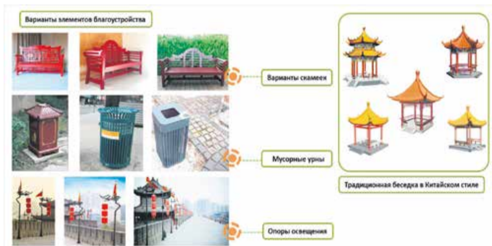
Иркутск интересен туристам из Китая: зарубежных гостей привлекают Байкал и архитектура сибирского города. И смотровая площадка, оформленная в традиционном китайском стиле, может стать еще одной местной достопримечательностью

Мария Николаева.