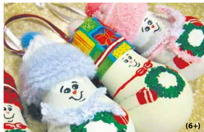
Таких симпатичных снеговиков из обычных лампочек можно научиться делать в мастерской Деда Мороза (6+)

Мария Николаева Фото из открытых источников