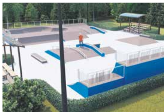
Скейт-площадки стали очень популярны в последнее время — одна за другой они появляются в разных точках Иркутска. Все потому, что на них есть спрос, а депутаты и администрация прислушиваются к мнению спортивной молодежи. Еще одна зона со специальными трюковыми фигурами может появиться в предместье Рабочем