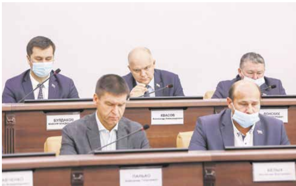
Депутаты городской думы подробно рассказали, какие проекты «Народных инициатив» получили поддержку большинства жителей и будут реализованы в их избирательных округах

— Впервые о «Народных инициативах» я узнал в конце 2019 года, когда был избран депутатом по 33-му избирательному округу. И хотя проект появился в 2016-м, наш округ в нем ни разу не участвовал, и мы решили это изменить. Вместе с активными жителями подготовили проект и начали работать. К сожалению, в прошлом году нам не удалось одержать победу, а в этом проголосовало много людей, за что я им очень благодарен. Теперь благодаря нашим инициативным жителям и у нас в округе появятся новые места для отдыха, — рассказал депутат думы Иркутска