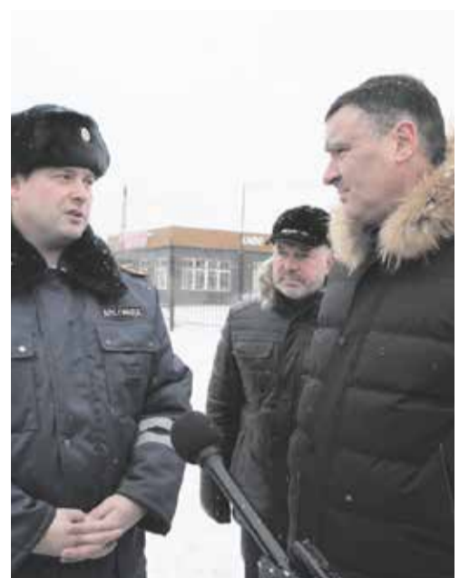
«Нам всем нужно привыкать к тому, что по выделенной полосе на Тракторной будет ездить лишь общественный транспорт», — мэр Иркутска Руслан Болотов и старший госавтоинспектор отделения дорожного надзора ОГИБДД МУ МВД России «Иркутское» капитан полиции Вячеслав Синютин обсуждают первую в Иркутске полосу для автобусов и маршруток