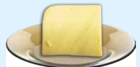
В декабре специалисты ФГБУ «Иркутская МВЛ» обнаружили в пробе сыра «Голландский» стеринами, характеризующие наличие растительных жиров. Продукт является фальсификатом

На стеринах организм человека реагирует по-разному. Существен-