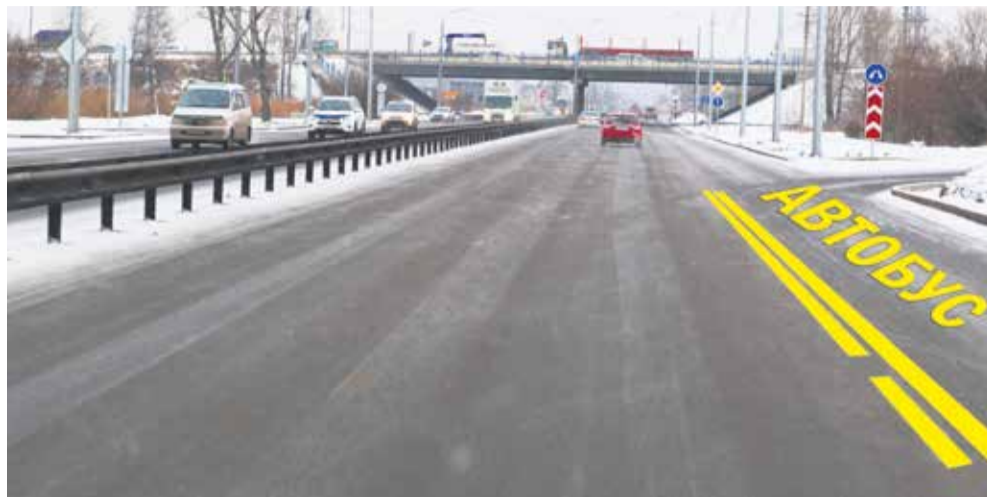
Тракторная после ремонта, конечно, впечатляет: три полосы в каждую сторону, освещение по центру дороги на разделительной полосе, пешеходное и барьерное ограждения, новые светофоры. Теперь привыкаем не заезжать на правую полосу: это право дано только водителям общественного транспорта

ства уже отправил заявку в министерство транспорта и дорожного хозяйства Иркутской области на установку камер. Разумеется, точки видеофиксации будут согласованы с ГИБДД.