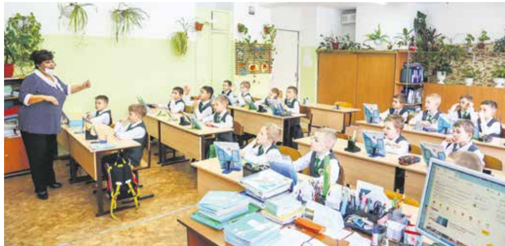
А вот та же самая команда два часа спустя: без шлемов, клюшек и коньков. Тренируются не в мастерстве владения мячом, а в сложении и вычитании цифр