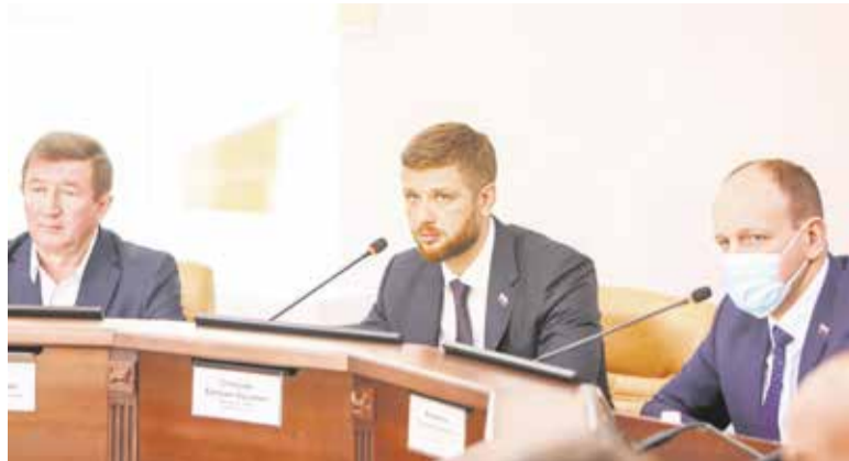
Иркутску необходим Единый центр видеонаблюдения — убеждены депутаты думы. Он позволит оперативно выявлять преступления и нарушения и даже пресекать попытки их совершить. Картинка с городских камер будет выводиться на мониторы, а за ними в свою очередь будут следить специалисты и сотрудники полиции