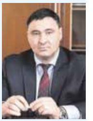
Мэр Иркутска Руслан Болотов

«Народные инициативы» — отличная программа. В ней реализуются сразу несколько важных моментов: мы воплощаем именно те проекты, которые действительно нужны иркутянам. Жители сами выходят с инициативами, а потом активно голосуют за них.