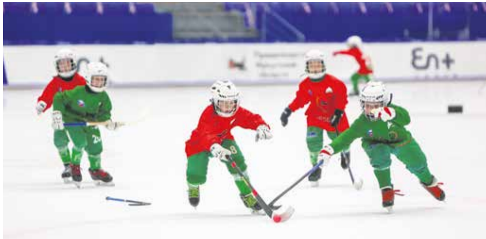
У второклашек каждое утро начинается с интенсивной тренировки на льду. Эти мальчишки с пяти лет стоят на коньках и, как шутят наставники, катаются уже лучше некоторых хоккеистов «Байкал-Энергии»