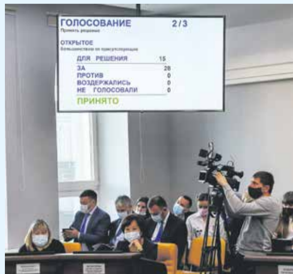
Идет заседание думы Иркутска, на котором было принято решение о новой мере социальной поддержки молодых педагогов — компенсации ежемесячной оплаты аренды жилья. Ее разработала администрация Иркутска и единогласно поддержали депутаты

Кроме того, в Иркутске уже действуют установленные думой повышающие коэффициенты к зарплате для тех, кто вышел на работу в школы сразу после учебы (в 1-й год работы — 0,6% от оклада, 2-й год — 0,36%, 3-й год — 0,24%). За эти три года специалист получает стаж и право сдать аттестационный экзамен на определенную квалификационную категорию, что позволяет получить доплату к окладу. Помимо этого молодым педагогам в возрасте до 30 лет предоставляется единовременная выплата в размере 100 тысяч рублей.