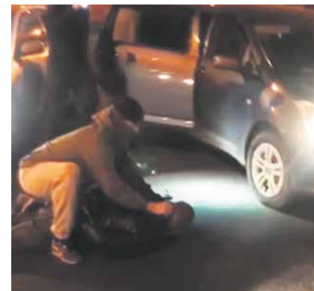
Это момент задержания сутенеров, которые создали в Иркутске сеть фирм по оказанию интим-услуг. Все они были лично знакомы с организатором преступного бизнеса и прекрасно понимали, что нарушают закон. Теперь они будут наказаны по справедливости

Э та криминальная история началась в Иркутске шесть лет назад. Местный житель Алексей, отсидев в колонии больше пяти лет, решил создать преступный бизнес на девушках. В проституцию он вовлекал молодых, в том числе несовершеннолетних, жительниц областного центра, Усолья-Сибирского, Черемхово. Сейчас организатор и все его подельники арестованы и ждут судебных приговоров.