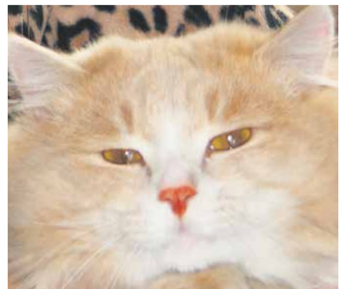
Если у кошки выявлена коронавирусная инфекция, нужно как можно раньше начать симптоматическое лечение. Также необходим контроль за перемещением животных, их лабораторное обследование. Обязательно соблюдение режимов кормления и гигиены содержания

Чем опасна инфекция и как ее распознать?