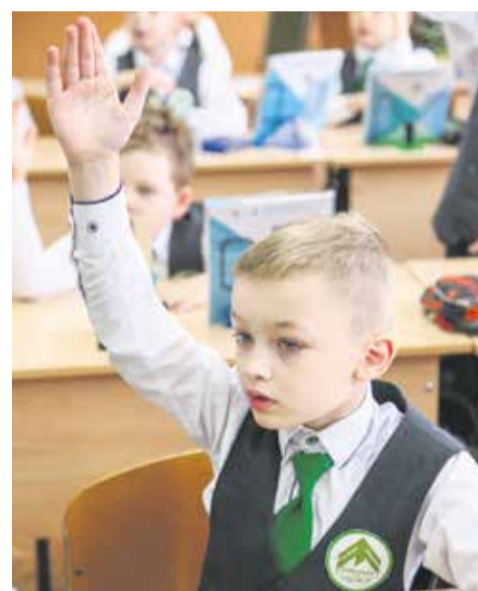
Учеников 2 «С» класса видно издали по зеленым галстучкам и эмблеме команды. «В сентябре они ходили по школе как картинки и ловили взгляды всех девчонок из параллели», — говорит классный руководитель