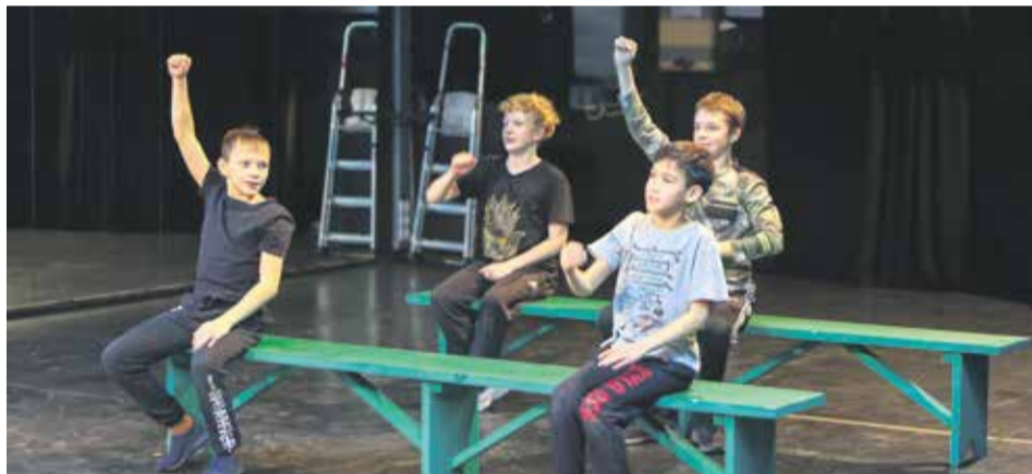
Репетиции спектакля проходят интересно и весело. Кажется, что мальчишки готовы заниматься со своими театральными педагогами сколько угодно долго. И это при том, что все юные артисты хорошо учатся в школе и занимаются в спортивных секциях