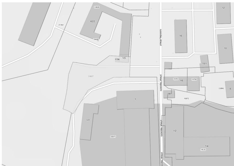
СХЕМА РАСПОЛОЖЕНИЯ ЗЕМЕЛЬНОГО УЧАСТКА, В ОТНОШЕНИИ КОТОРОГО ПОДГОТОВЛЕН ПРОЕКТ РЕШЕНИЯ О ПРЕДОСТАВЛЕНИИ РАЗРЕШЕНИЯ НА УСЛОВНО РАЗРЕШЕННЫЙ ВИД ИСПОЛЬЗОВАНИЯ «ПРЕДПРИНИМАТЕЛЬСТВО» В ОТНОШЕНИИ ЗЕМЕЛЬНОГО УЧАСТКА С КАДАСТРОВЫМ НОМЕРОМ 38:36:000018:24607, ПЛОЩАДЬЮ 1858 КВ. М, РАСПОЛОЖЕННОГО ПО АДРЕСУ: ИРКУТСКАЯ ОБЛАСТЬ, ГОРОД ИРКУТСК, УЛ. БАРИКАД.

Учитывая запрос Общественно-государственного объединения «Всероссийское физкультурно-спортивное общество «Динамо» о предоставлении разрешения на условно разрешенный вид использования земельного участка, предоставить разрешение на условно разрешенный вид использования «Предпринимательство» в отношении земельного участка с кадастровым номером 38:36:000018:24607, площадью 1858 кв. м, расположенного по адресу: Иркутская область, г. Иркутск, ул. Баррикад.