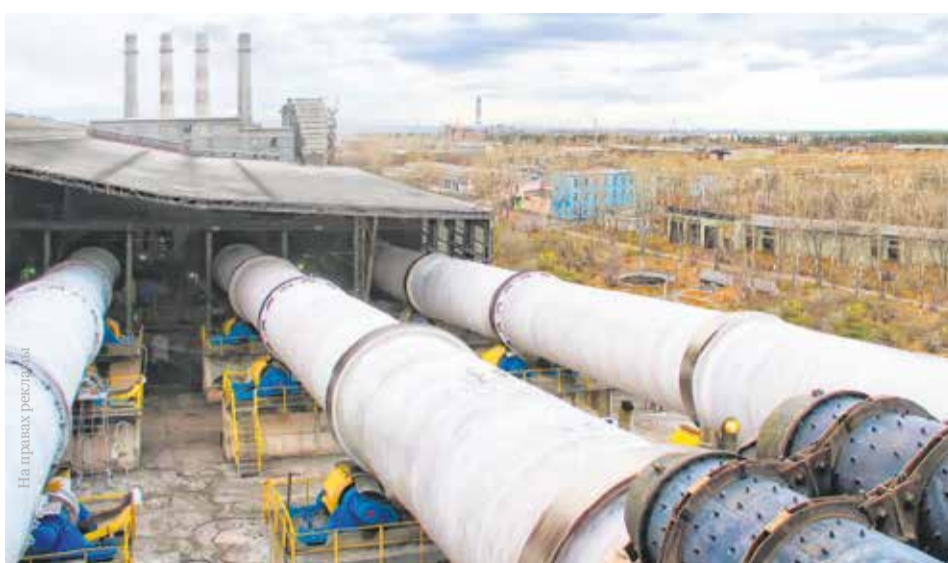
Ангарский цементно-горный комбинат (управляющая компания АО «ХК «Сибцемент») введен в эксплуатацию в 1957 году. Сырьевая база завода — карьер «Перевал» в городе Слюдянке. География поставок — Иркутская область, Забайкальский край, Республика Бурятия. Мощность предприятия составляет 1,3 млн тонн цемента в год