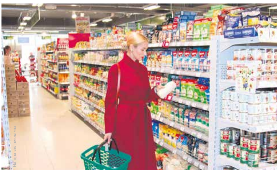
Сотрудники торговой сети «Слата» говорят, что на 2022 год запланированы оптимизация и ребрендинг уже имеющихся у них торговых марок, а также запуск новых в среднем сегменте. Ассортимент товаров СТМ будет расширяться во всех категориях — кондитерские изделия, бакалея, консервация и др.