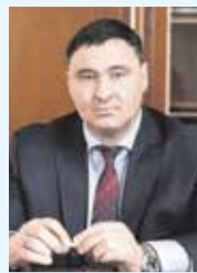
Мэр Иркутска Руслан Болотов

«Народные инициативы» — отличная программа. В ней реализуются сразу несколько важных моментов: мы воплощаем именно те проекты, которые действительно нужны иркутянам. Жители сами выходят с инициативами, а потом активно голосуют за них.