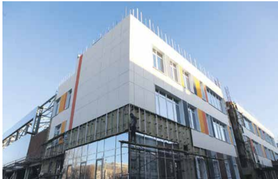
Фото слева репортер «Иркутска» Наталья Федотова сделала в августе, всего два месяца назад. Это начальный блок школы № 14 на улице Карла Либнехта, только-только возвели каркас стен и приступили к монтажу окон, кровли. На фото справа (снято в минувший вторник, 9 ноября) уже идет процесс внутренней и внешней отделки здания