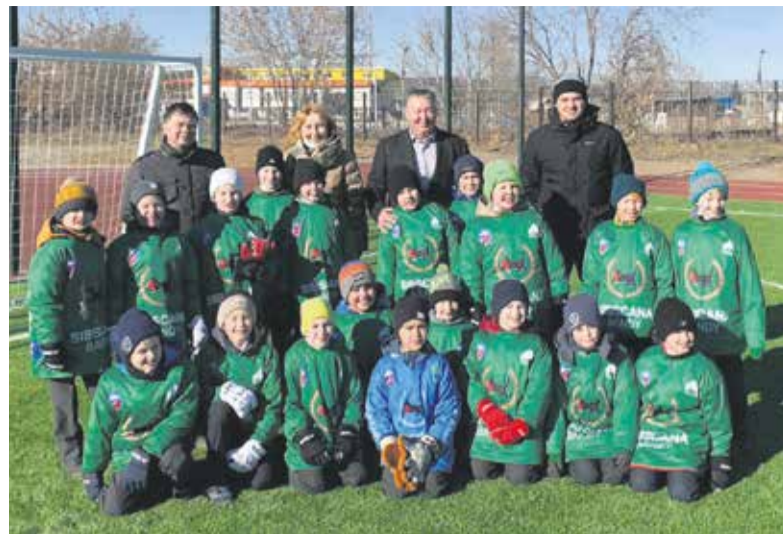
Традиционное фото на память: в день открытия обновленного стадиона школы № 77 (микрорайон Первомайский) состоялся товарищеский матч между игроками команды «Сибскана» и учениками. Именно здесь будут проводиться занятия специального учебного класса по хоккею с мячом — он открылся в школе в этом году