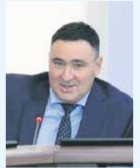
Мэр Иркутска Руслан Болотов

« Задача, которая стоит перед нами, легкая и сложная одновременно. Нам надо сохранить Иркутск таким, каким мы его любим и каким он был создан, а с другой стороны, необходимо сделать его новым и современным. »