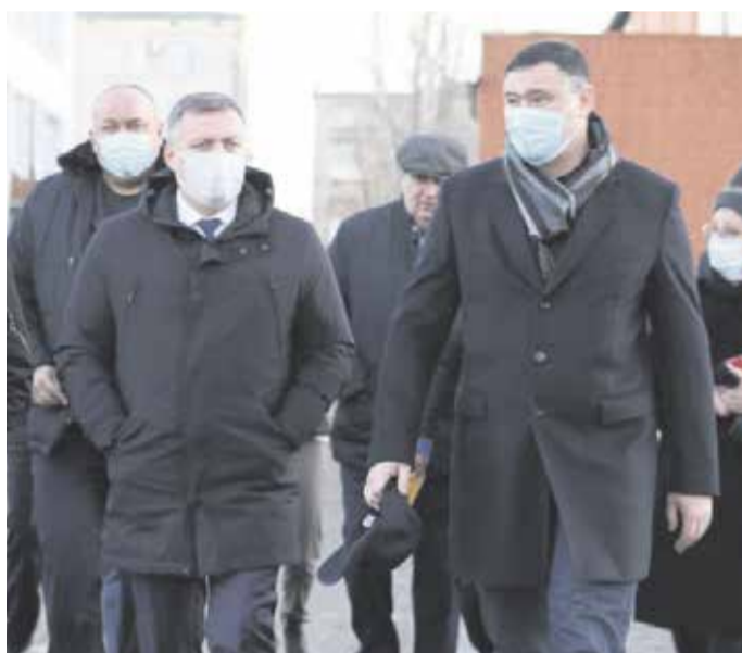
Вторник, 9 ноября. Мэр Иркутска Руслан Болотов и губернатор Игорь Кобзев на строительной площадке школы № 14 на улице Карла Либнехта. Ее планируют достроить к концу декабря. Если все пойдет по плану, а предпосылки для этого есть, то Иркутск в течение нескольких ближайших лет избавится от тяжелой проблемы нехватки школ

Наблюдая, как рабочие обшивают вентиляруемыми плитами корпус здания, Руслан Николаевич рассказал журналисту «Иркутска», что сейчас строительство трех школ финансируется из федерального, областного и местного бюджетов. Это продолжение строительства дополнительного блока на 500 мест школы № 14 (где мы и встре-