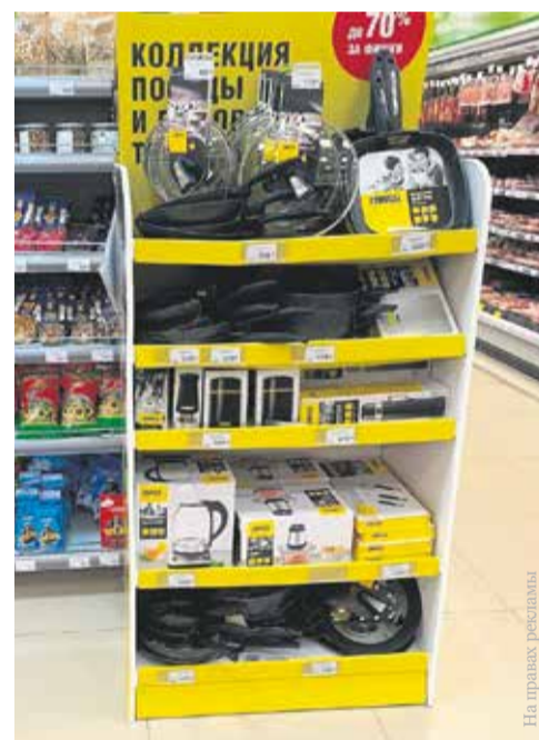
Вся коллекция посуды и бытовой техники ZANUSSI представлена на специальных стойках в супермаркетах «Слата»

— Наши программы направлены на то, чтобы дарить эмоции, как игрушки «Миньоны», «Витаминные друзья», или приносить пользу и комфорт. Антипригарная посуда ZANUSSI станет залогом успеха в создании ваших домашних кулинарных шедевров. Экологически безопасное