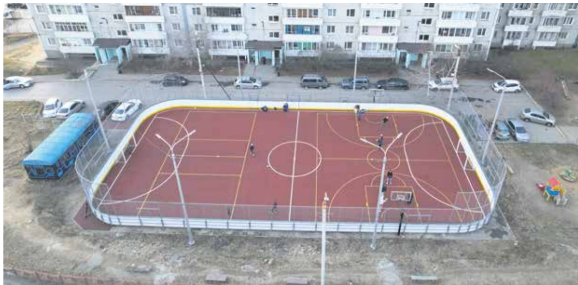
Новенький хоккейный корт в микрорайоне Университетском. На этом спортивном пространстве впервые в Иркутске использованы телескопические опоры: на них можно натягивать сетку для волейбола и тенниса. За ремонт этой площадки по программе «Народные инициативы» проголосовали 4,5 тысячи иркутян