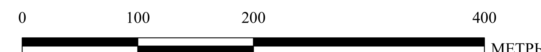
СХЕМА ГРУПП ПЛАНИРОВОЧНЫХ ЭЛЕМЕНТОВ

Приложение к решению Думы города Иркутска от _____ № _____