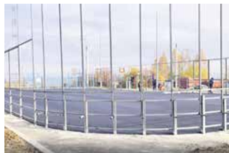
На фото — корт возле дома № 10 в микрорайоне Топкинском. Здесь будет резинопол, подрядчик должен успеть уложиться в установленные сроки

Депутаты думы Иркутска активно развивают спортивную инфраструктуру в своих избирательных округах