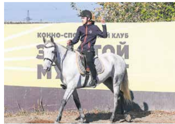
Калипсо считается молодой: ей пять «лошадиных» лет (по человеческим меркам это примерно 16 лет). Она спокойно ходит под седлом и бережно относится к наездникам — это самое важное качество верховой лошади. В следующем году ее планируют выводить на соревнования