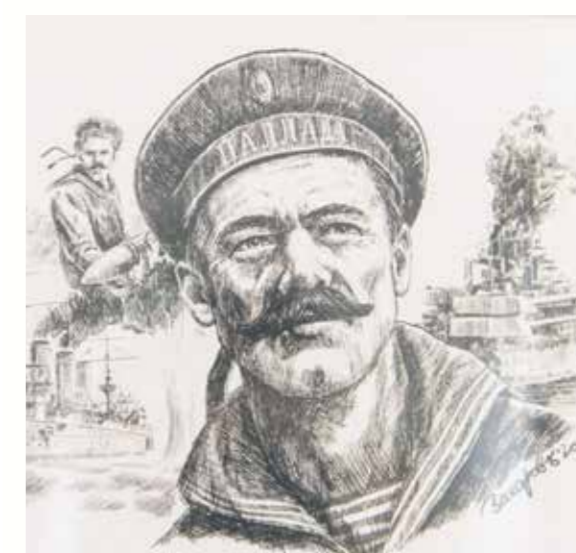
Иллюстрация из цикла «Великая Война», посвященного событиям Первой мировой войны. У Сергея Захарова потрясающая техника изображения: иллюстрации притягивают взгляд, заставляют остановиться, посмотреть, задуматься

Как из обычной роцы сделали семейный парк нового образца: с природными материалами, сенсорной дорожкой, холмом-скалодромом и деревянным амфитеатром