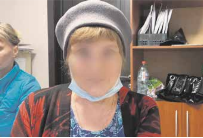
Схема «родственник попал в беду» не нова — несколько лет назад ее постоянно использовали телефонные мошенники. За последние два-три года о ней подзабыли, но этой осенью в Иркутске она вновь очень популярна. Обманутые пенсионеры (одна из пострадавших на фото) теперь уже никому не верят — и это правильно! — и просят не называть их имен