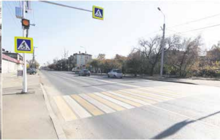
Один из самых крупных дорожных ремонтов — 2021 в Иркутске (улица Баррикад): было и стало. Здесь расширили перекрестки, сделали новые тротуары и парковочные карманы, установили современную систему светодиодного освещения. Но главное — недалеко от перекрестка с ул. Ушаковской оборудована новая система ливневой канализации

«Моя жесткая позиция: недобросовестные подрядчики должны платить за свое нежелание работать! Те, кто выходит на ремонт дорог, должны четко понимать, что переделывать потом придется за свой счет. Все взысканные средства повторно направим на ремонт дорог.»