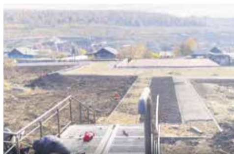
Площадка на улице Губернатора Трескина пока что лидирует в личном рейтинге Юрия Корнева: подрядная организация работает споро. Ожидается, что объект успеет доделать вовремя

В избирательном округе № 21 Юрия Корнева также развернуты значимые