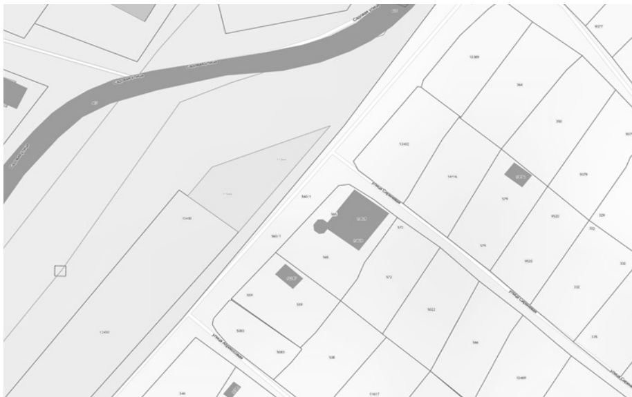
СХЕМА РАСПОЛОЖЕНИЯ ЗЕМЕЛЬНОГО УЧАСТКА, В ОТНОШЕНИИ КОТОРОГО ПОДГОТОВЛЕН ПРОЕКТ РЕШЕНИЯ О ПРЕДОСТАВЛЕНИИ РАЗРЕШЕНИЯ НА УСЛОВНО РАЗРЕШЕННЫЙ ВИД ИСПОЛЬЗОВАНИЯ «ДЛЯ ИНДИВИДУАЛЬНОГО ЖИЛИЩНОГО СТРОИТЕЛЬСТВА» В ОТНОШЕНИИ ЗЕМЕЛЬНОГО УЧАСТКА С КАДАСТРОВЫМ НОМЕРОМ 38:36:000026:11544, ПЛОЩАДЬЮ 441 КВ. М, РАСПОЛОЖЕННОГО ПО АДРЕСУ: РОССИЙСКАЯ ФЕДЕРАЦИЯ, ИРКУТСКАЯ ОБЛАСТЬ, ГОРОД ИРКУТСК, МИКРОРАЙОН ЕРШОВСКИЙ, 1Б.

Учитывая запрос Созиновой Елены Витальевны о предоставлении разрешения на условно разрешенный вид использования земельного участка, предоставить разрешение на условно разрешенный вид использования земельного участка, предоставить разрешение на условно разрешенный вид «Для индивидуального жилищного строительства» в отношении земельного участка с кадастровым номером 38:36:000026:11544, площадью 441 кв. м, расположенного по адресу: Российская Федерация, Иркутская область, город Иркутск, микрорайон Ершовский, 16.