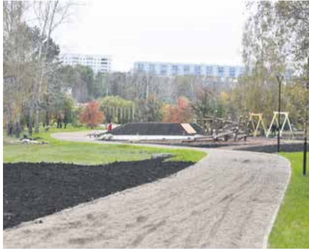
«Семейный парк» в микрорайоне Солнечном — это спортивная и детская зоны и отдельное место для выгула собак. Здесь есть дорожки со специальным покрытием для скандинавской ходьбы, панорамная площадка с видом на воду, высажен сад байкальских растений

Но есть и нюансы. Солнечный — микрорайон с высоким уровнем грунтовых вод. Это и другие гидрологические условия осложнили работу