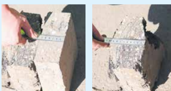
Это куски дороги с перекрестка улиц Пискунова — Красноярской. Нижний слой асфальта должен быть не менее 7 сантиметров. При измерении выяснилось, что он превышает нормативные показатели почти на три сантиметра (!). Верхний слой также показал хороший результат и прошел контроль: его толщина в месте вырубki более 5 сантиметров