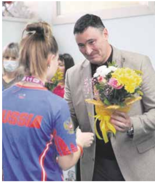
Момент торжественного вручения наград иркутским школьникам, праздничная атмосфера и хорошее настроение — отличный повод для встречи. «Наши дети блестяще выступили на Всемирных школьных играх и чемпионате мира по спортивному ориентированию. Сегодня встретился с ребятами, все они учатся в школе № 66 и лицее № 1», — написал мэр Иркутска Руслан Болотов на своей странице в социальных сетях