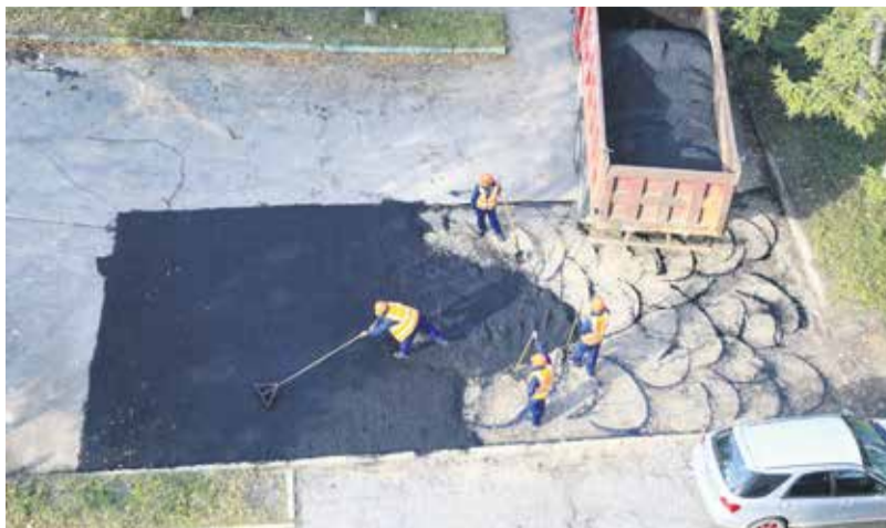
А это один из дворов в микрорайоне Первомайский: рабочие подрядной организации укладывают асфальт на месте, где ранее МУП «Водоканал» ремонтировал после аварии сети водоснабжения. Единая технологическая карта проведения работ не только контролирует их качество, но и обязывает организации «асфальтировать за собой»