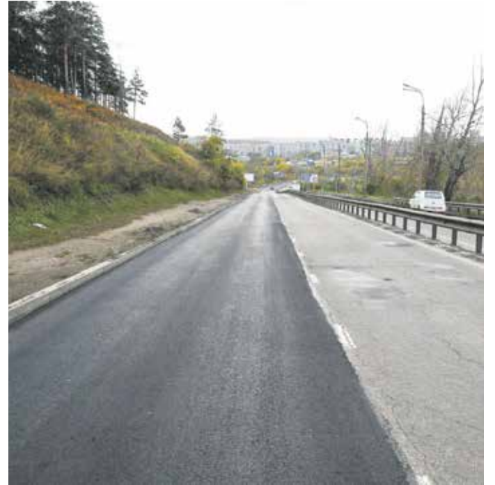
А этот снимок сделан нашим фоторепортером утром во вторник. На Кайской горе — полоса нового асфальта. «Автодор» сделал здесь свою работу ночью, теперь техника и люди работают в других районах города: в этом году предприятие взяло на себя обязательства привести в порядок тридцать девять участков по всему Иркутску