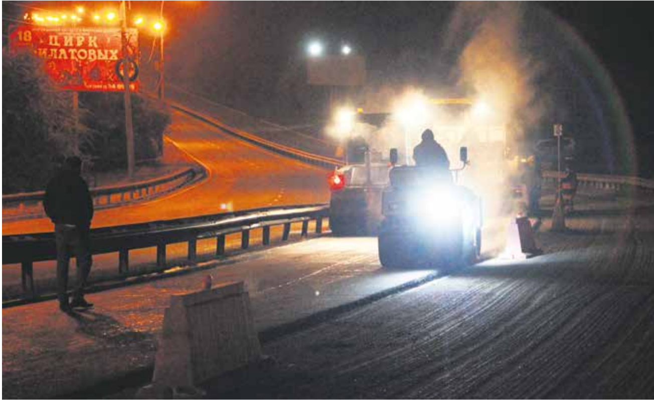
Ночь с понедельника, 27 сентября, на вторник, дорожники меняют асфальт на одном из самых сложных отрезков улицы Маяковского — Кайском подъеме. Чтобы не мешать движению, рабочие вышли на асфальтирование ночью, а вместе с ними — понаблюдать, как ремонтируют дороги, пока город спит — отправилась и репортерская группа «Иркутска»