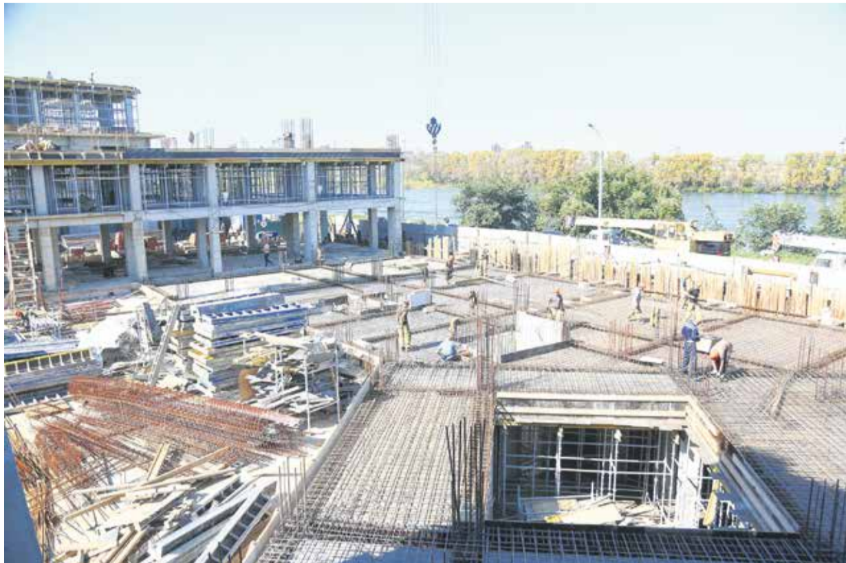
Еще недавно Курбатовские бани стояли в руинах, а сегодня снова возвышаются над Ангарой. В этом Г-образном здании, расположенном вдоль улицы Гаврилова и Цесовской набережной, как и 100 лет назад, будет работать большой банный комплекс, но уже на современный лад: с 25-метровым бассейном и SPA-центром