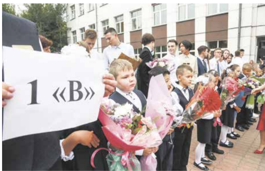
Вот она, школьная преемственность поколений. Праздничная линейка 1 сентября стала первой для 9 тысяч иркутских первоклассников и последней для 4 тысяч выпускников

Г ордо поправляя банты и галстуки, с любопытством в глазах и букетами наперевес стоят на школьном дворе виновники торжества — первоклашки. А за ними покровительственно выстроились стеной выпускники. В День знаний в 74 школах Иркутска прошли праздничные линейки для первых и одиннадцатых классов. Из-за эпидемиологической ситуации для всех остальных учеников организовали классные часы. Глава города принял участие в торжественной линейке в школе № 15.