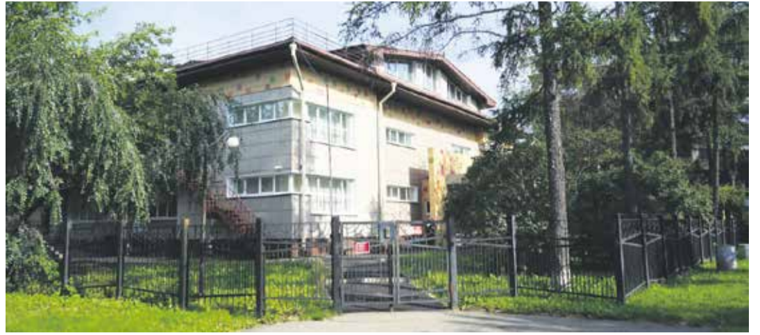
Корпус детского сада № 41, расположенный на ул. Горького, в отличном состоянии, недавно отремонтировали прилегающую территорию. Нужно еще уличное освещение — средства на это планируют выделить из бюджета