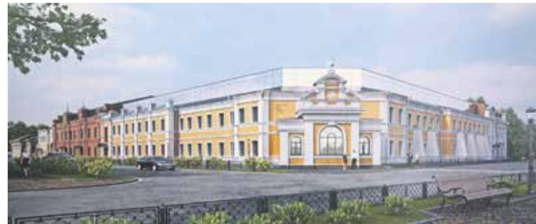
Так будет выглядеть завершённый образ Курбатовских бань. В разные годы они изменялись, перестраивались, дополнялись пристроями. В новом исполнении здание приведет к единому стилю, но подчеркнут эпохи строительства разными цветовыми решениями