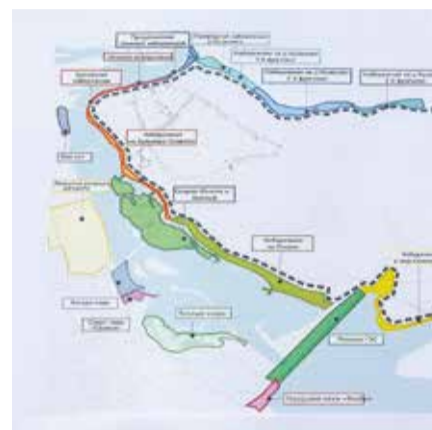
В перспективе все набережные Иркутска соединятся в одну большую прогулочную зону: можно будет выйти (или выехать на велосипеде) от плотины Иркутской ГЭС и через центр добраться вдоль Ангары и Ушаковки практически до ипподрома