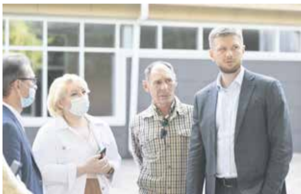
Школа № 17 в этом году получила средства на устранение предписаний надзорных органов и успешно их освоила. Однако в городе остаются другие учреждения образования, которые нуждаются в средствах на эти цели, поэтому сумму будут увеличивать